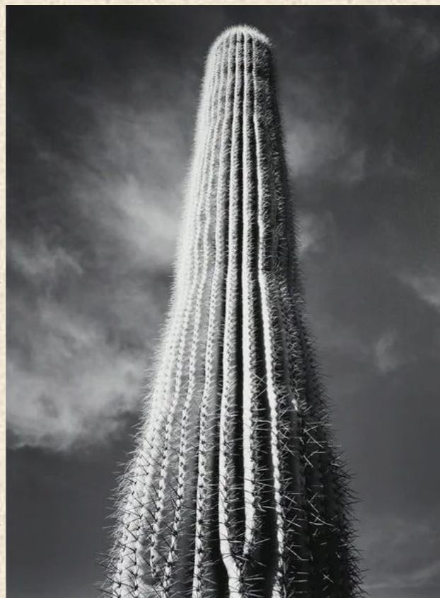
Кактус Сагуаро, Восход солнца, Аризона, 1942. Фотограф Энсел Адамс