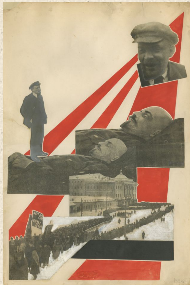
Александр Родченко. Похороны Ленина. 1924