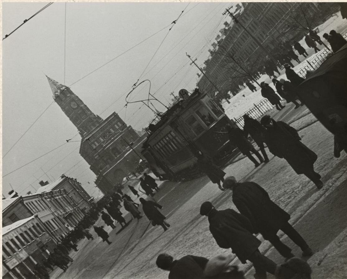
Александр Родченко. Сухаревский бульвар. 1928