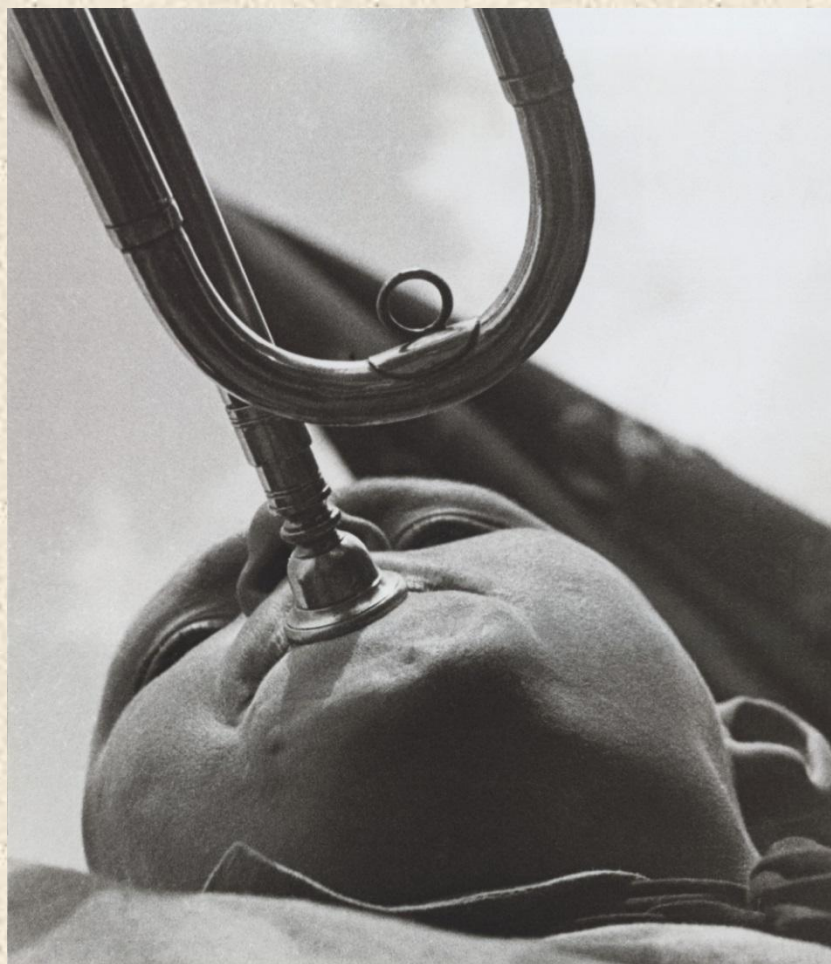
Александр Родченко. Пионер-трубач. 1932