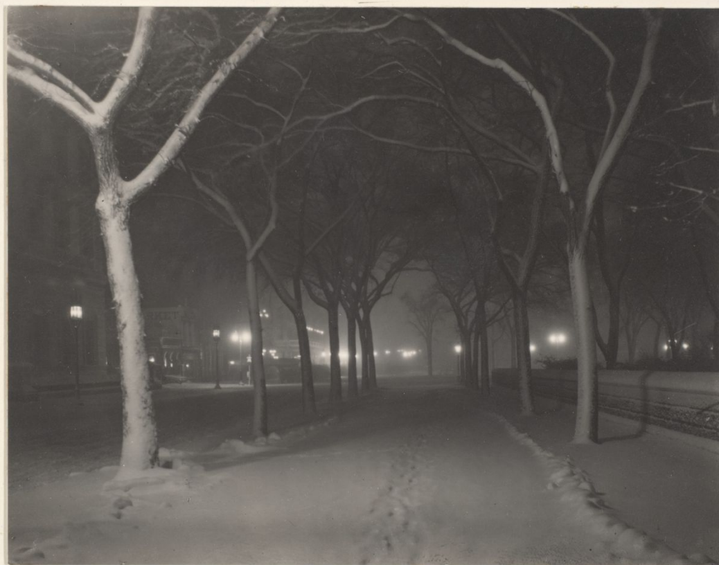
Студеная ночь, Нью-Йорк, 1889 Альфред Стиглиц