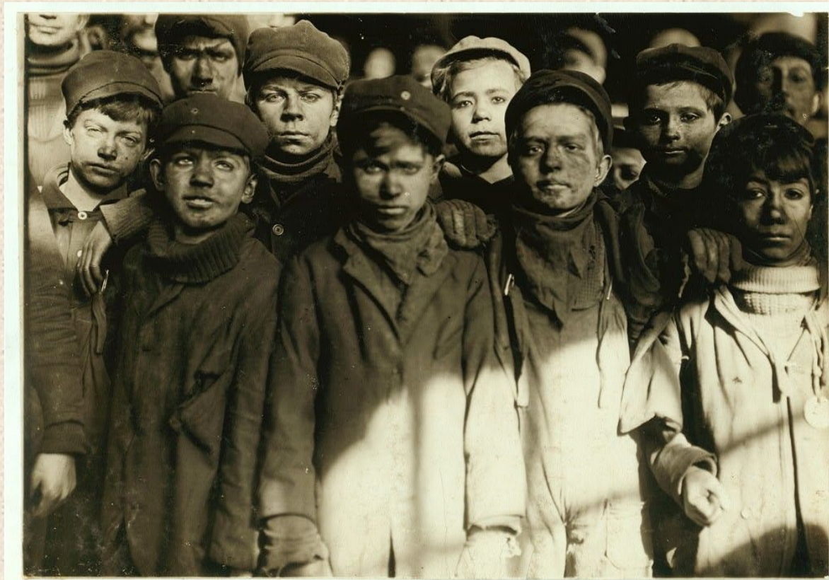
1911 год, Hughestown Borough, Питтстон, штат Пенсильвания. Группа мальчиков-дробильщиков, работающих на Pennsylvania Coal Co.