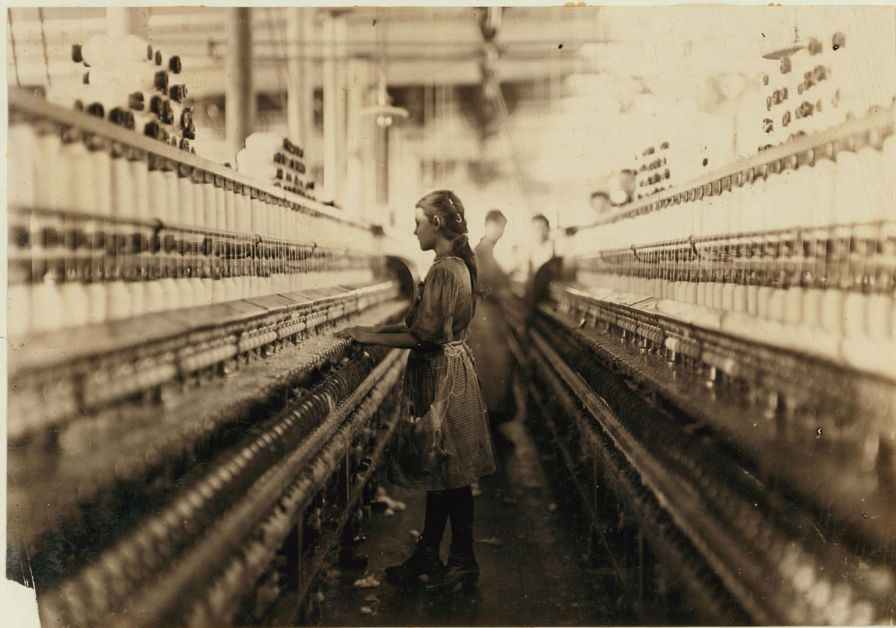
Фотография Льюиса Хайна