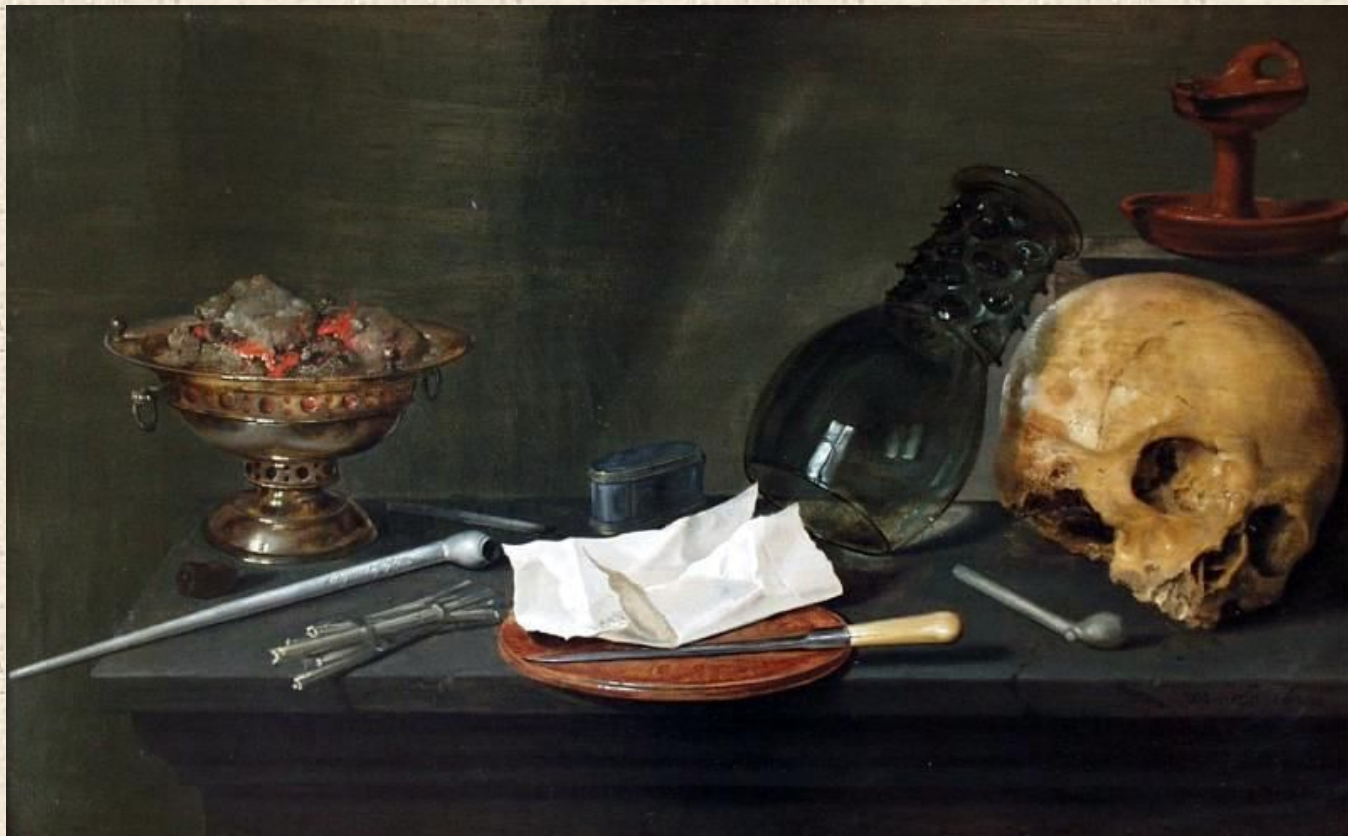
Виллем Клас Хеда. Пример натюрморта на аллегорическую тему.