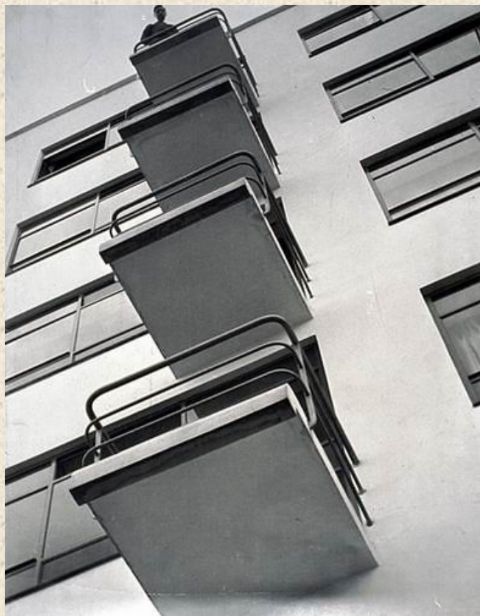
Ласло Мохой-Надь. Bauhaus Balconies, 1926