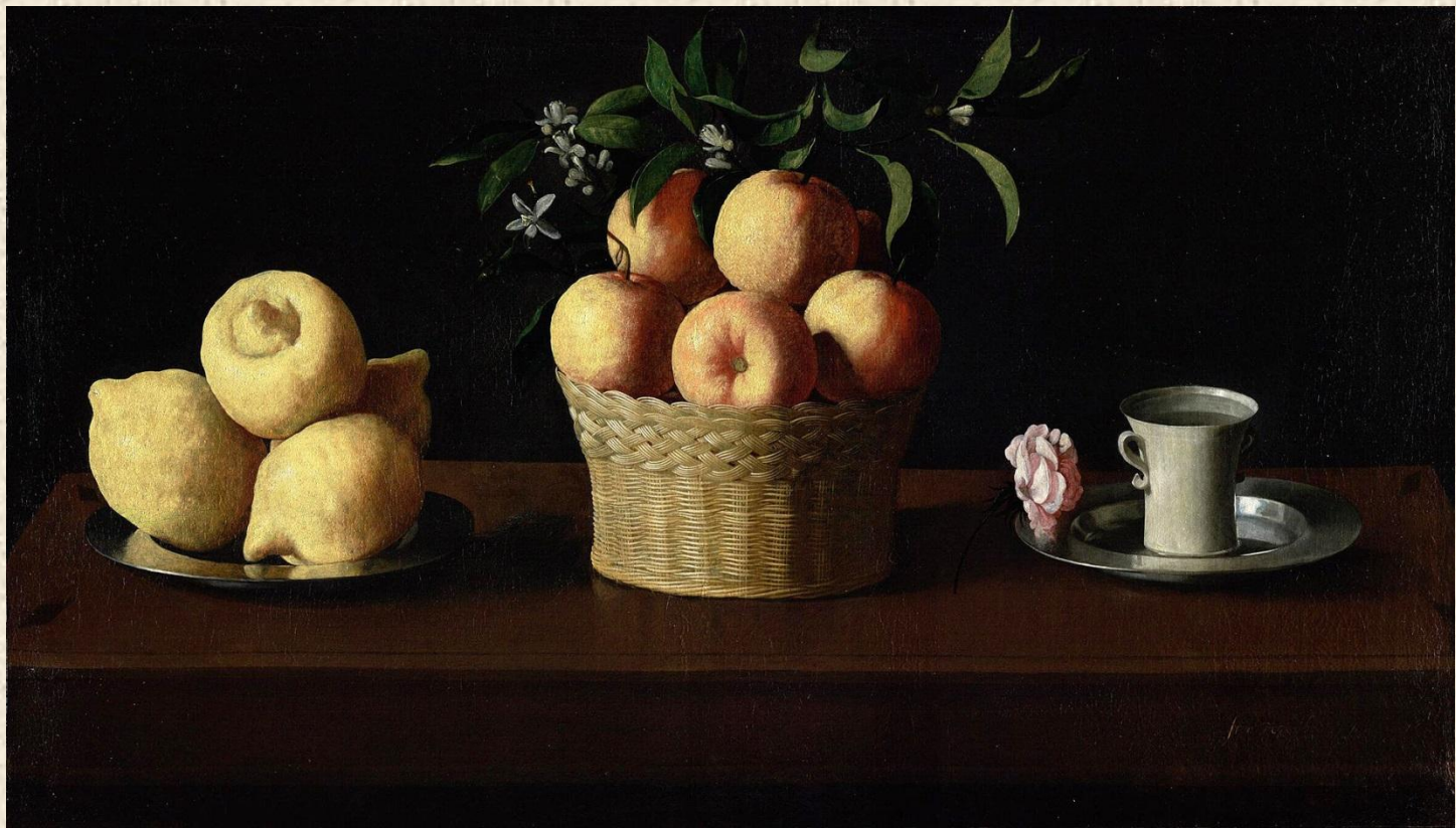
Франсиско де Сурбаран. Натюрморт с лимонами, апельсинами и розой. 1633