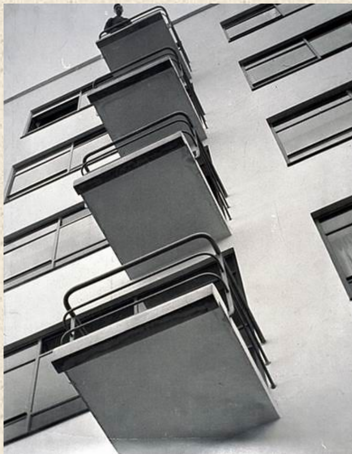
Ласло Мохой-Надь. Bauhaus Balconies, 1926