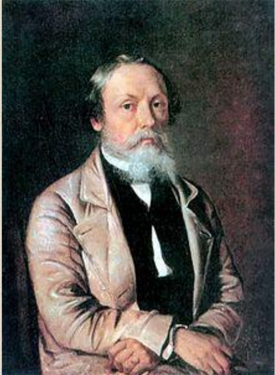
Иван Хруцкий (1810-1885 гг.)