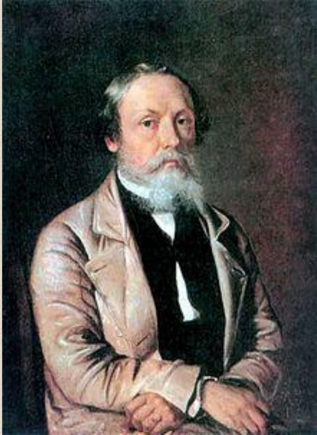
Иван Хруцкий (1810-1885 гг.)