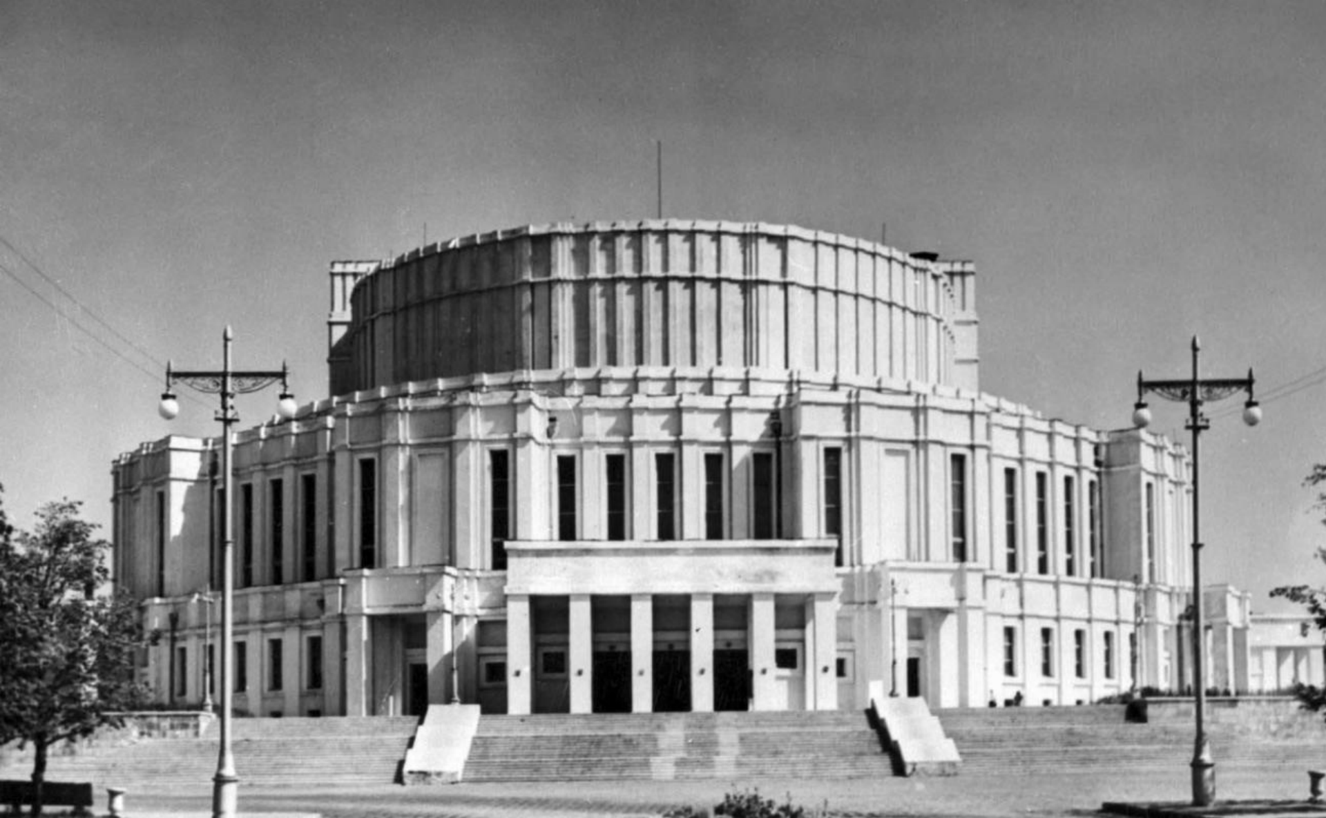
Белорусский театр оперы и балета