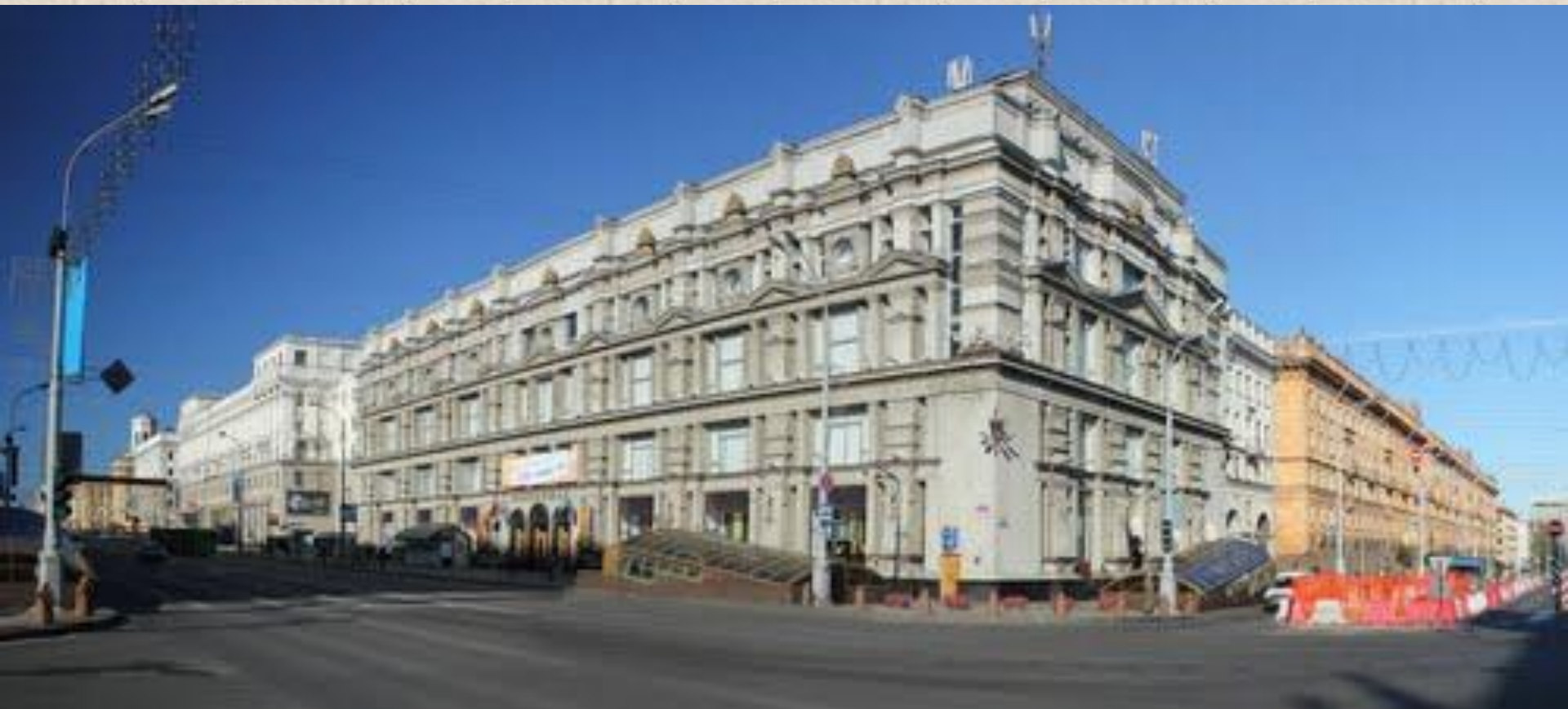
Здание ГУМа (1952 г.)