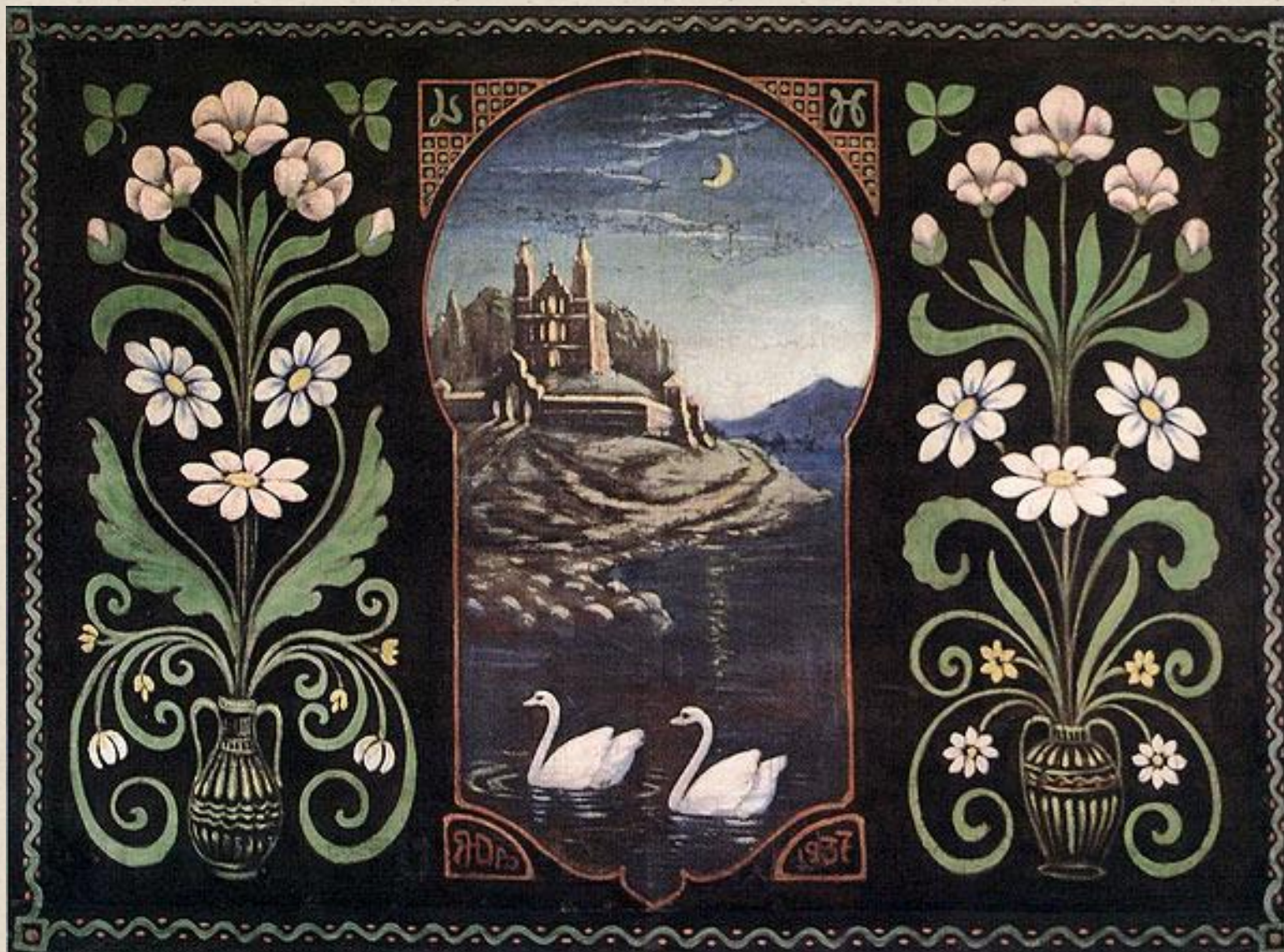
Язеп Дроздович (1888-1965)