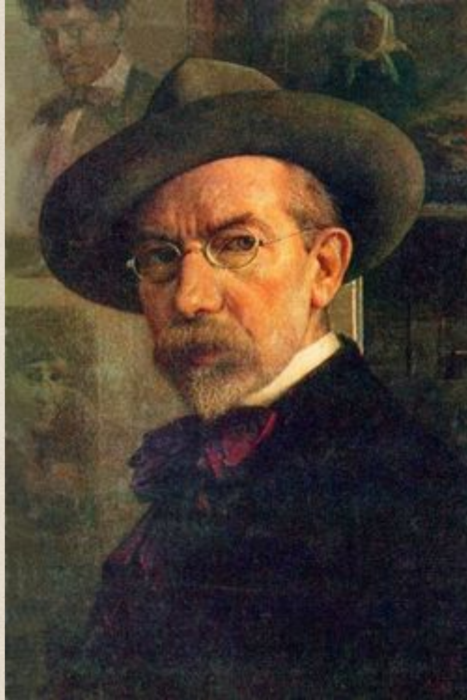
Юдель Пэн (1854—1937)