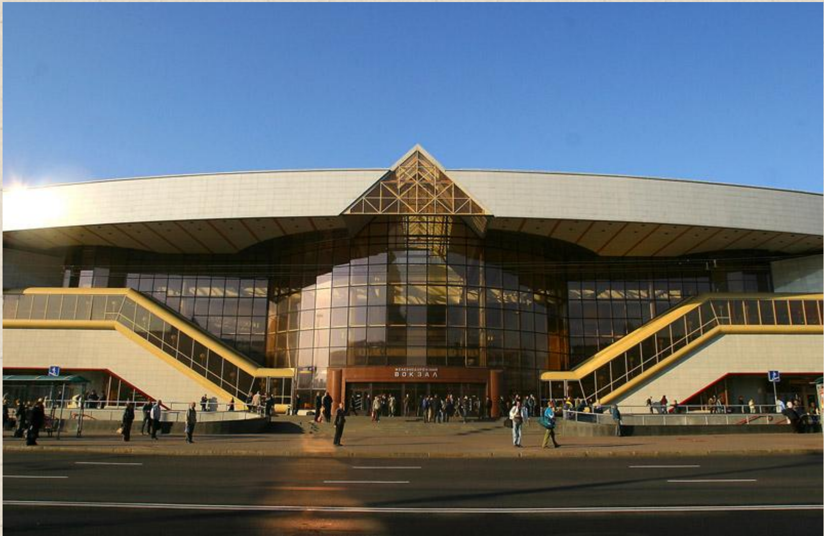
Новый железнодорожный вокзал в Минске В. Крамаренко