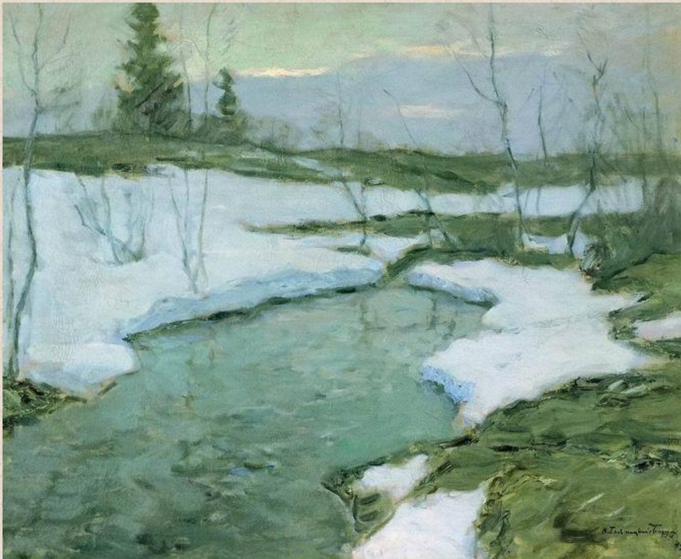
Витольд Бялыніцкі-Біруля (1872-1957)