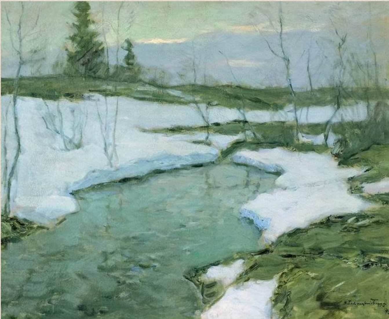
Витольд Бялыніцкі-Біруля (1872-1957)