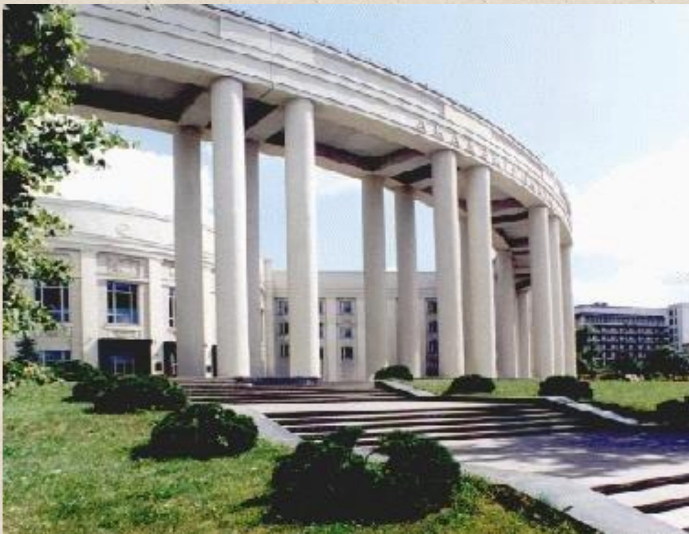
Главный корпус АН БССР в Минске (1935 –39 гг.)