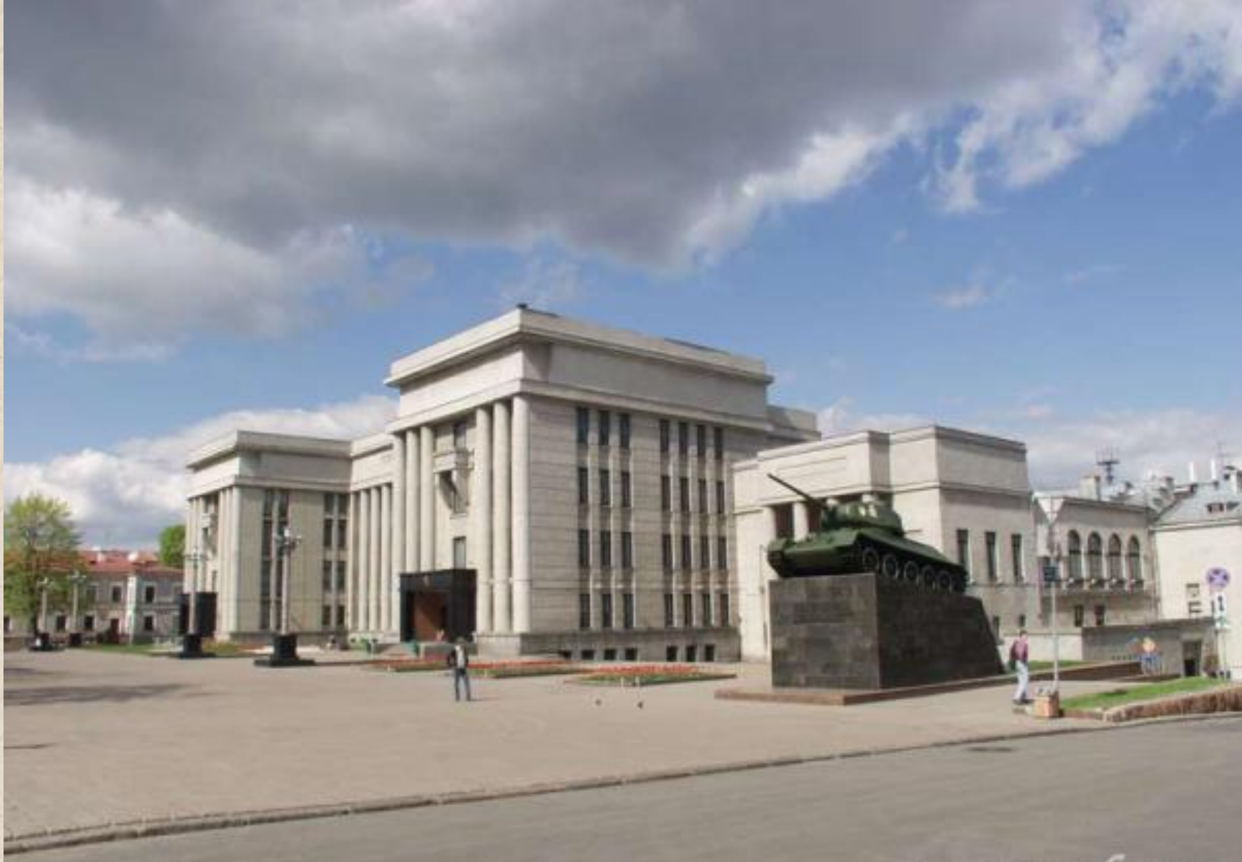
Дом Красной Армии (1934-1939 гг.)