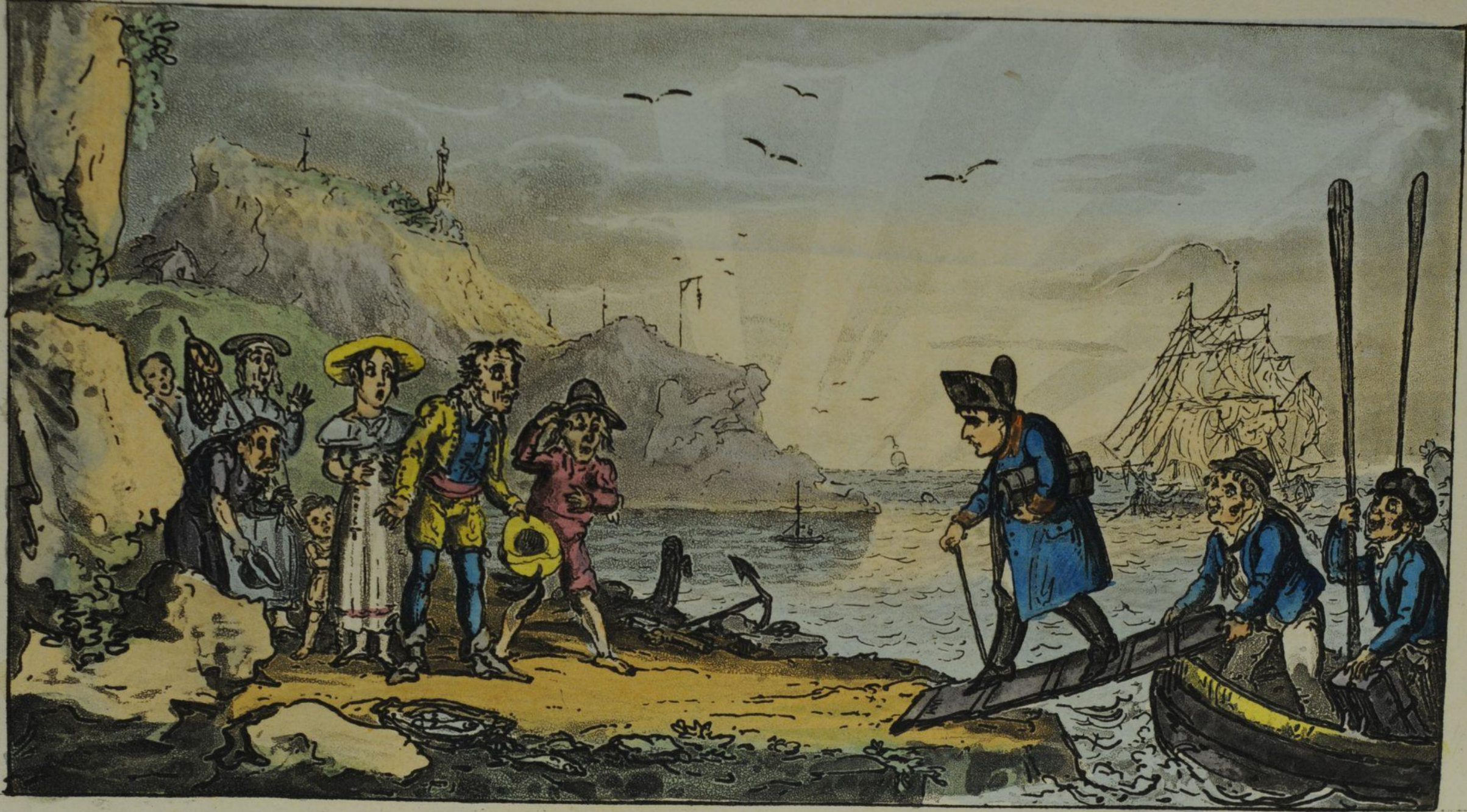
LANDING IN ELBA.