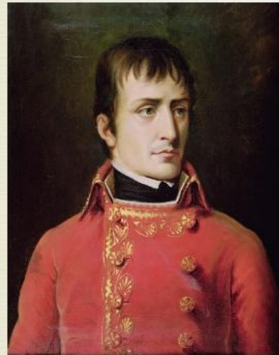
Первый консул Наполеон Бонапарт