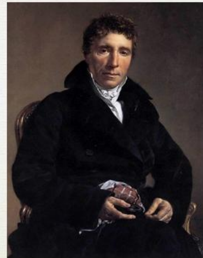
Второй консул Эммануэль – Жозеф Сийес