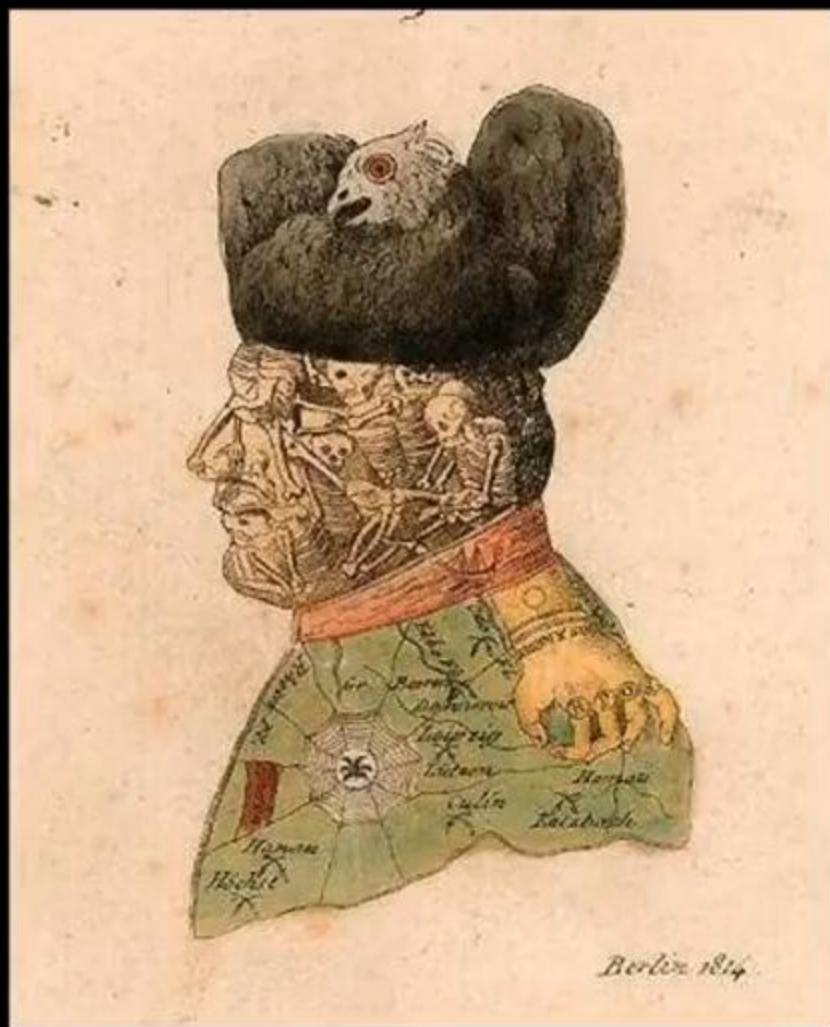
Наполеон. Карикатура 1814