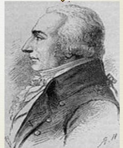
Третий консул Роже Дюко