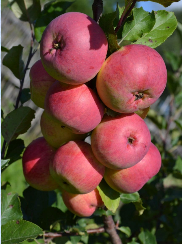
«Вэм - Сувенир»