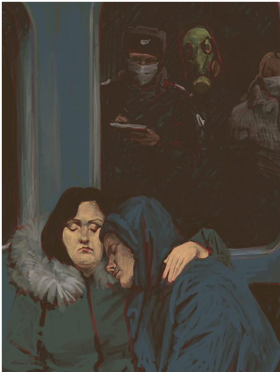
Иллюстрация: NURKA, «Chuma2020»

В понимании этого субъекта психоанализ движется от комплексных структур к элементарным, антропология — в обратном порядке.