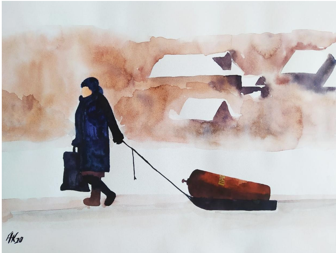
Иллюстрация: Антон Куприянов «Сила Сибири»