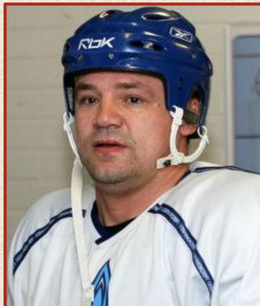
Андрей Николаевич Коваленко, Серебряный призер чемпионата мира среди молодёжи, Олимпийский чемпион 1992 года, серебряный призер Олимпийских Игр 1998 года