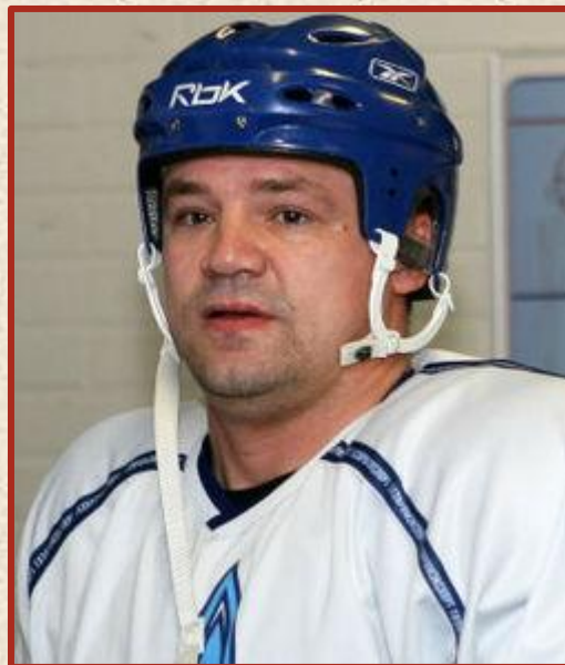
Андрей Николаевич Коваленко, Серебряный призер чемпионата мира среди молодёжи, Олимпийский чемпион 1992 года, серебряный призер Олимпийских Игр 1998 года