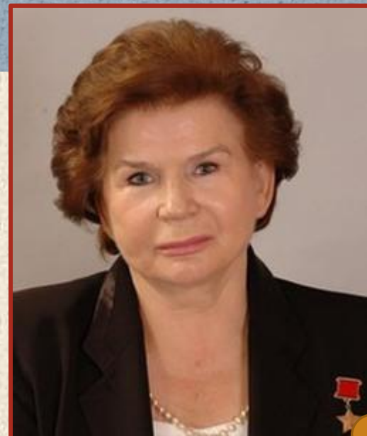
Валентина Владимировна Терешкова, первая в мире женщина- космонавт, герой Советского Союза