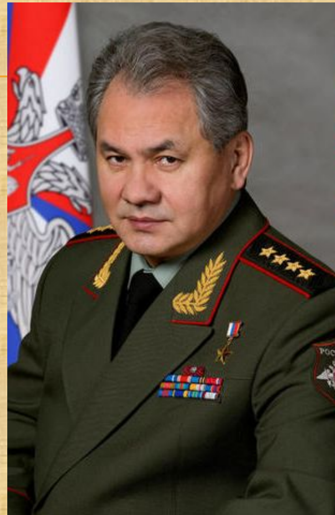
Шойгу Сергей Кужугетович Министр обороны Российской Федерации, генерал армии

□ Непосредственное руководство ВС РФ осуществляет Министр обороны РФ через Министерство обороны. Министерство обороны реализует политику в области строительства ВС РФ в соответствии с решениями высших органов государственной власти Российской Федерации.