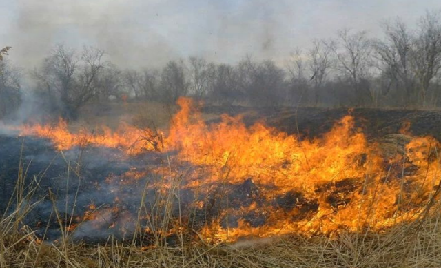
ВОЗГОРАНИЕ СУХОЙ РАСТИТЕЛЬНОСТИ

Прогнозируемые риски. Чрезвычайная пожароопасность (5 класс)