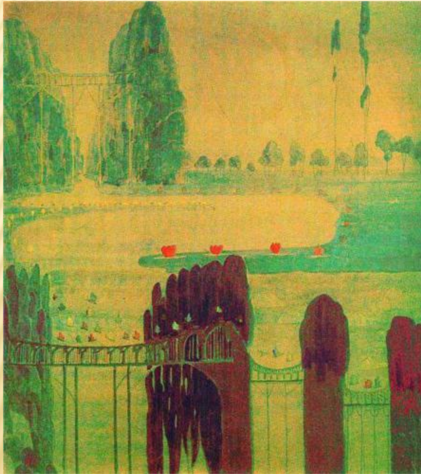
СКЕРЦО (СОНАТА СОЛНЦА)

Его цикл «Соната солнца» - результат увлечения художника астрономией: Анданте – из хаоса появляются солнца, планеты; Аллегро – рождение Земли; Скерцо – пышно расцветает жизнь: необыкновенной красоты цветы, деревья, подвесные мосты. Финал – угасание жизни. Звучит суровое предупреждение человеку: нельзя разрушать гармонию, вечная красота – в созидании, а не в разрушении.