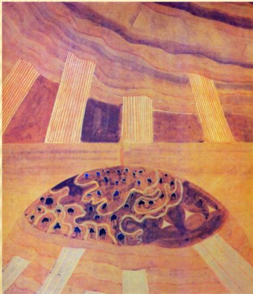
АНДАНТЕ (СОНАТА СОЛНЦА)

За свою недолгую жизнь он написал около 300 картин, многие из которых объединены в циклы: «Знаки зодиака», «Соната моря», «Соната солнца» и другие. Являясь основоположником музыкальной живописи, он разработал целую науку музыки цвета.