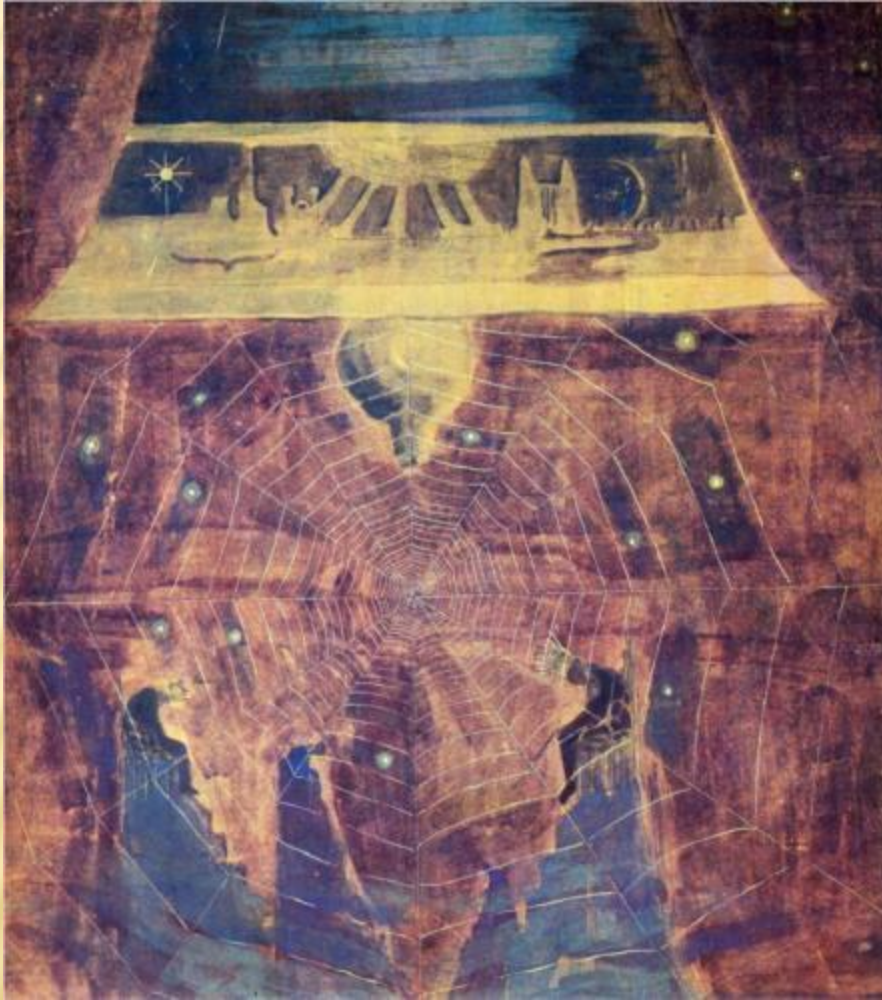
ФИНАЛ (СОНАТА СОЛНЦА)

Чюрлёнис опередил свое время. Вестник далекой Страны мечты, он явился, чтобы пробудить в сердцах стремление к поиску, жажду крыльев и высокого-высокого полета.