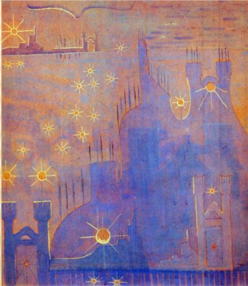
АЛЛЕГРО (СОНАТА СОЛНЦА)