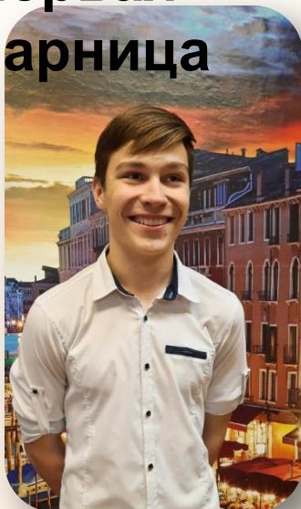
После праздника, все реквизиты со мной...