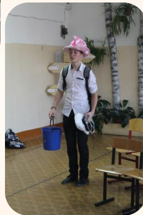
30 лет МЧС