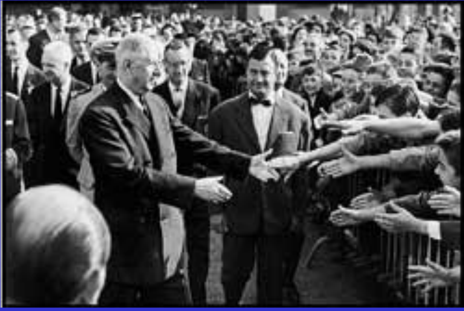
Французы приветствуют Шарля де Голля

вала собой установление во Фран- ции Четвёртой республики.