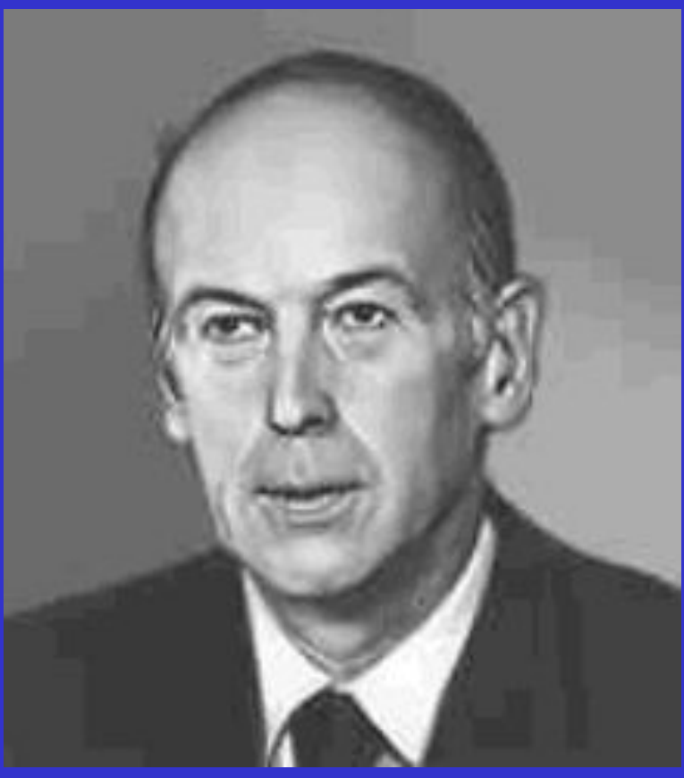
В.Ж. д' Эстен

После ухода в отставку де Голля президентом был избран менее властный Жорж Помпиду. После его смерти в 1974 г. президентом стал лидер независимых республиканцев Валери Жискард д'Эстен.