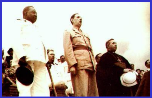
Генерал де Голль

Основные силы страны видели в Шарле де Голле сильную личность. В 1958 г. де Голль стал премьером и провел через референдум Конституцию, превращавшую Францию в президентскую республику. Последующий период вошёл в историю Франции под названием Пятой республики.