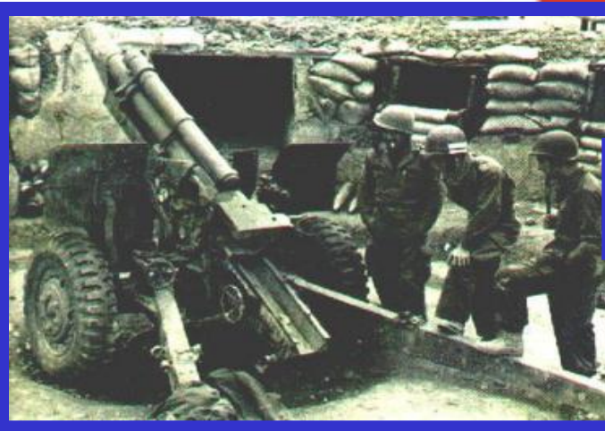
Французские солдаты в Индокитае

Согласно конституции французская колониальная империя преобразовалась во Французский Союз, в который включались и государства, вставшие уже на путь независимости. Среди них были Вьетнам, Камбоджа, Лаос. Но коммунистическое правительство Вьетнама отказалось признать это решение, что привело к войне Франции против Демократической Республики Вьетнам (1946-1954 гг.).