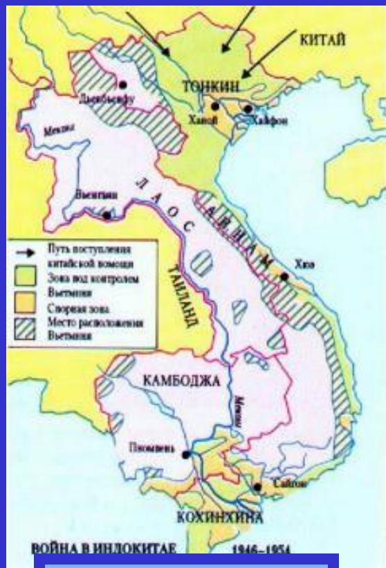
Война в Индокитае