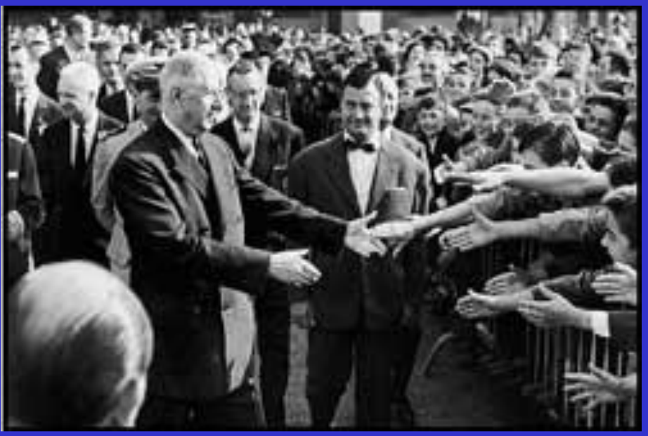
Французы приветствуют Шарля де Голля

вала собой установление во Фран- ции Четвёртой республики.