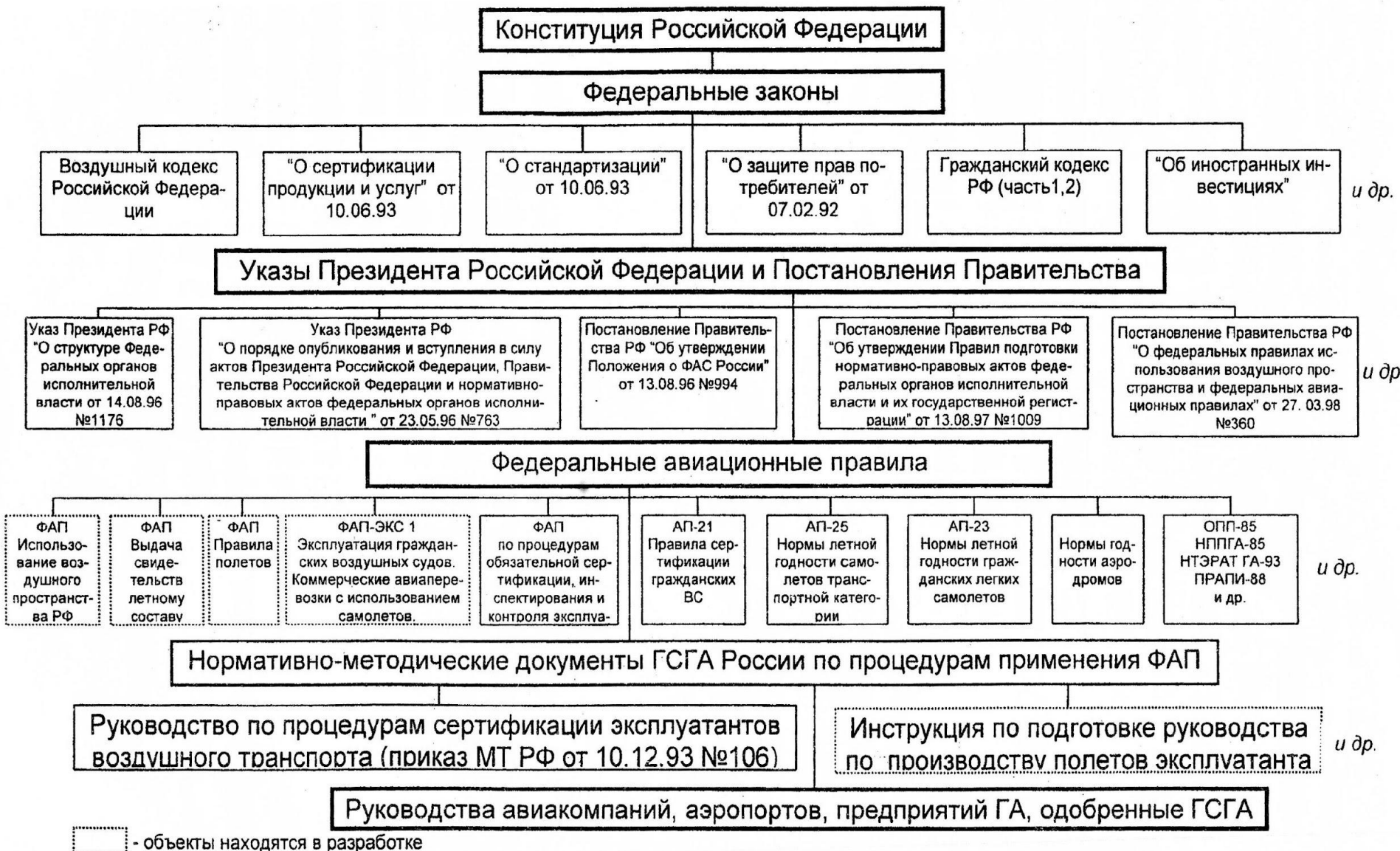
Рис. 3. Иерархия соподчиненности законодательной и нормативной базы в области ВТ.