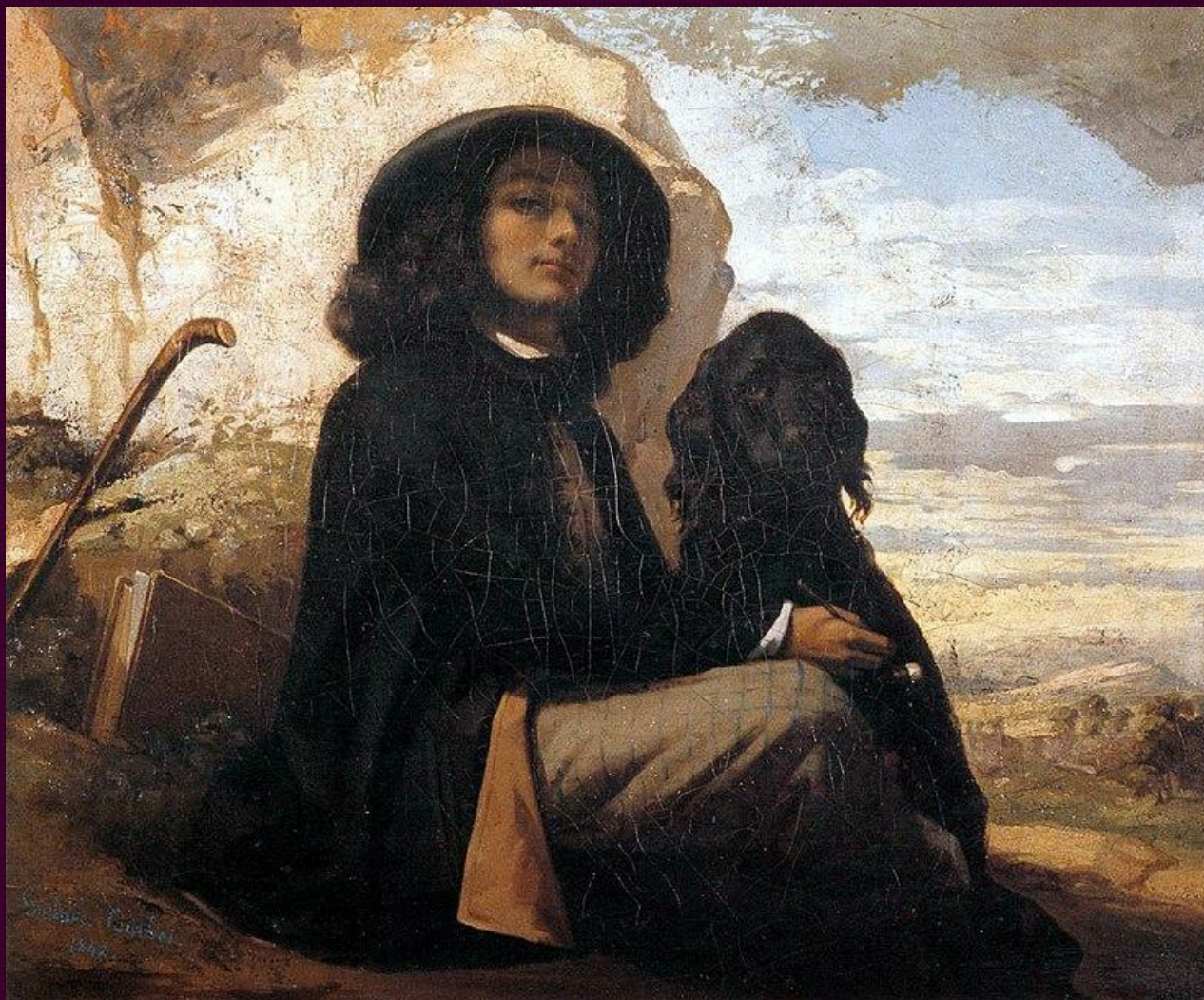
Автопортрет (Курбе с чёрной собакой). 1842. Пти Пале, Париж