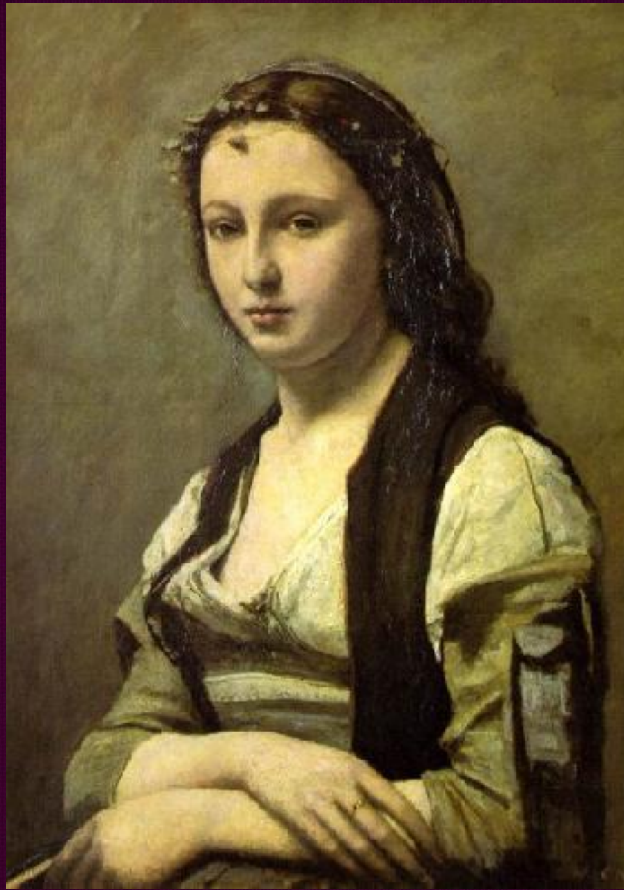
Женщина с жемчужиной. 1868-1870. Лувр, Париж.