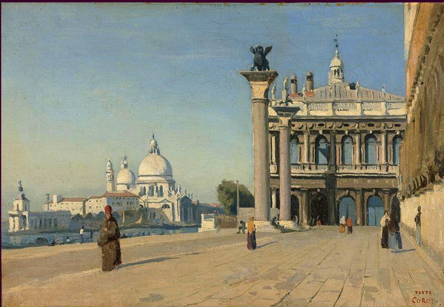
Утро в Венеции. 1834. ГМИИ имени А. С. Пушкина, Москва