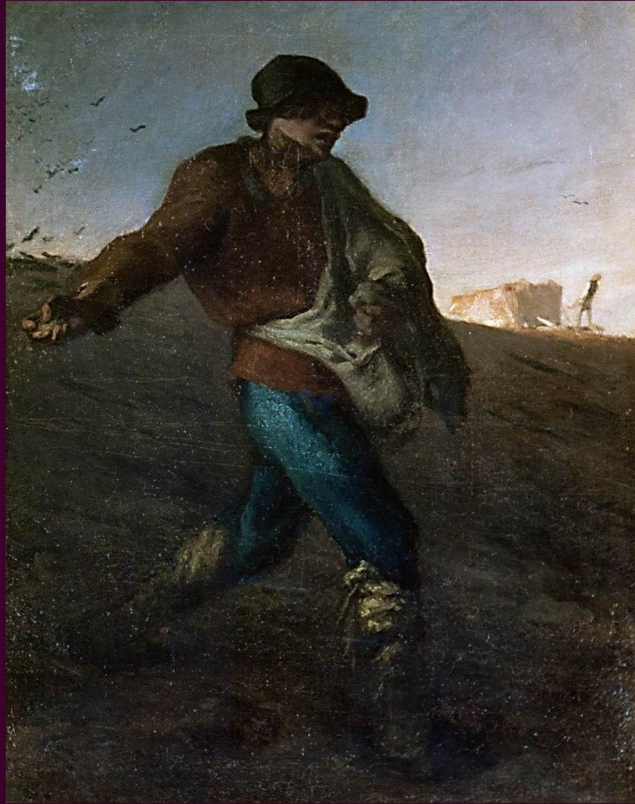
Сеятель. 1850. Музей изящных искусств, Бостон.