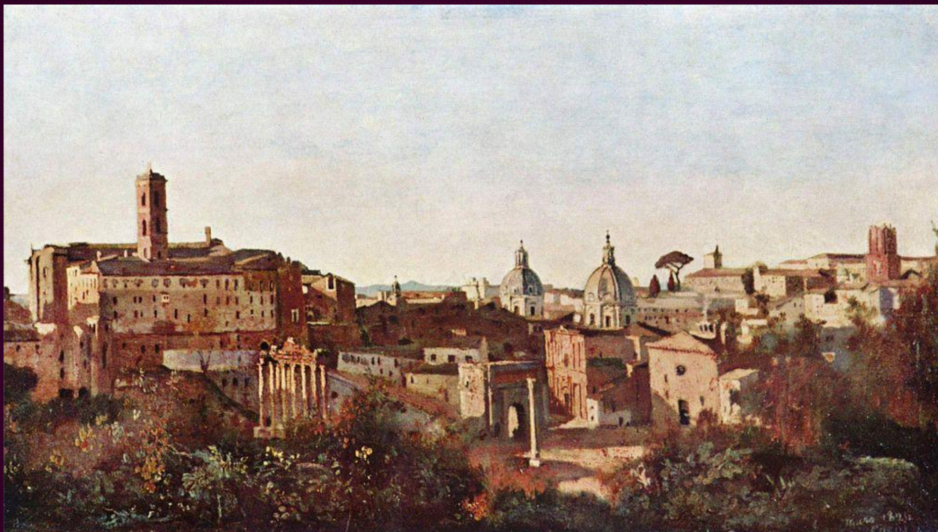
Рим. Форум и сады Фарнезе. 1826. Музей Орсе, Париж