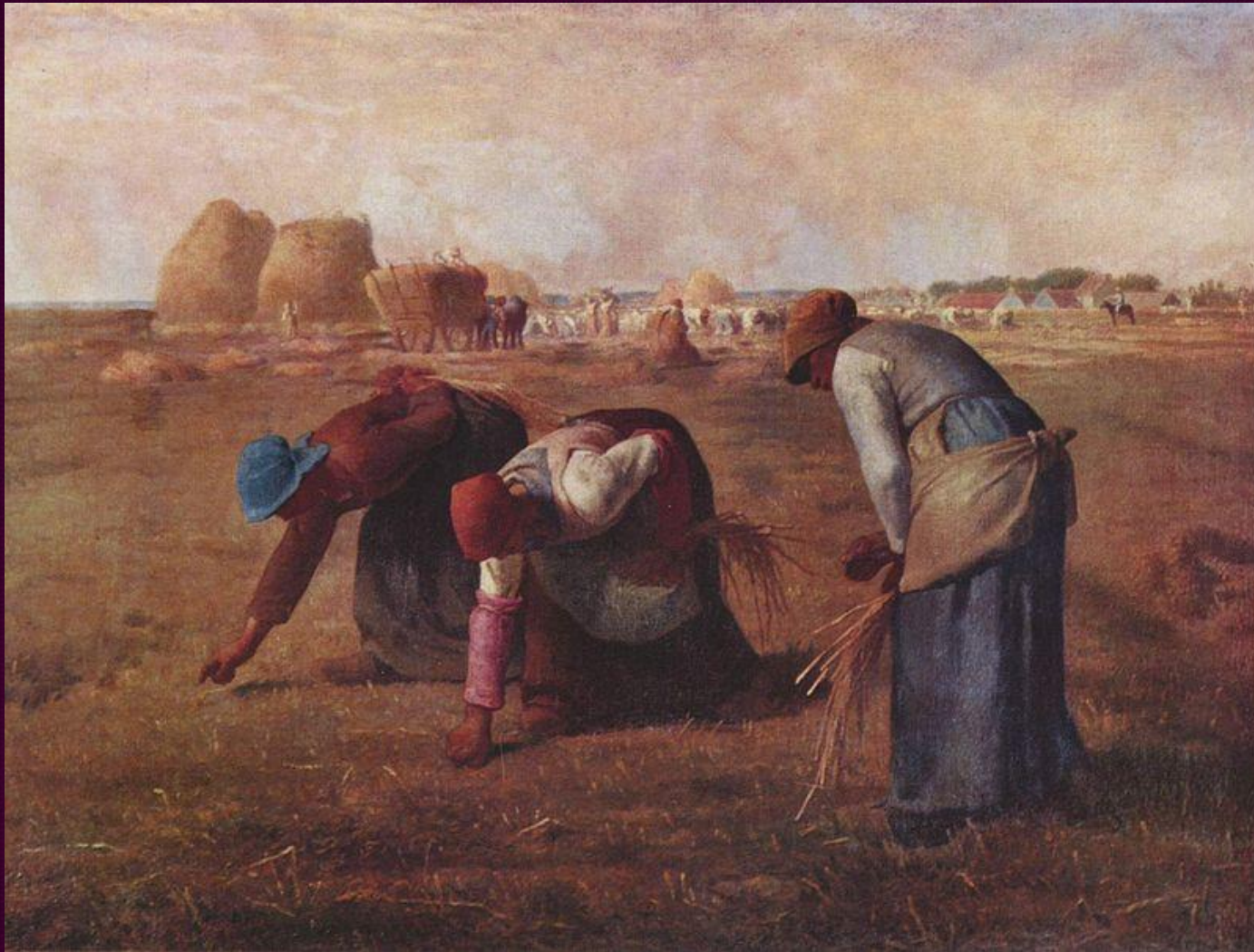
Сборщицы колосьев. 1857. Музей д'Орсе, Париж