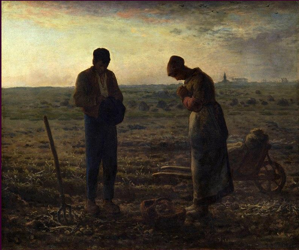
Анжелюс. 1857—1859. Музей д'Орсе, Париж