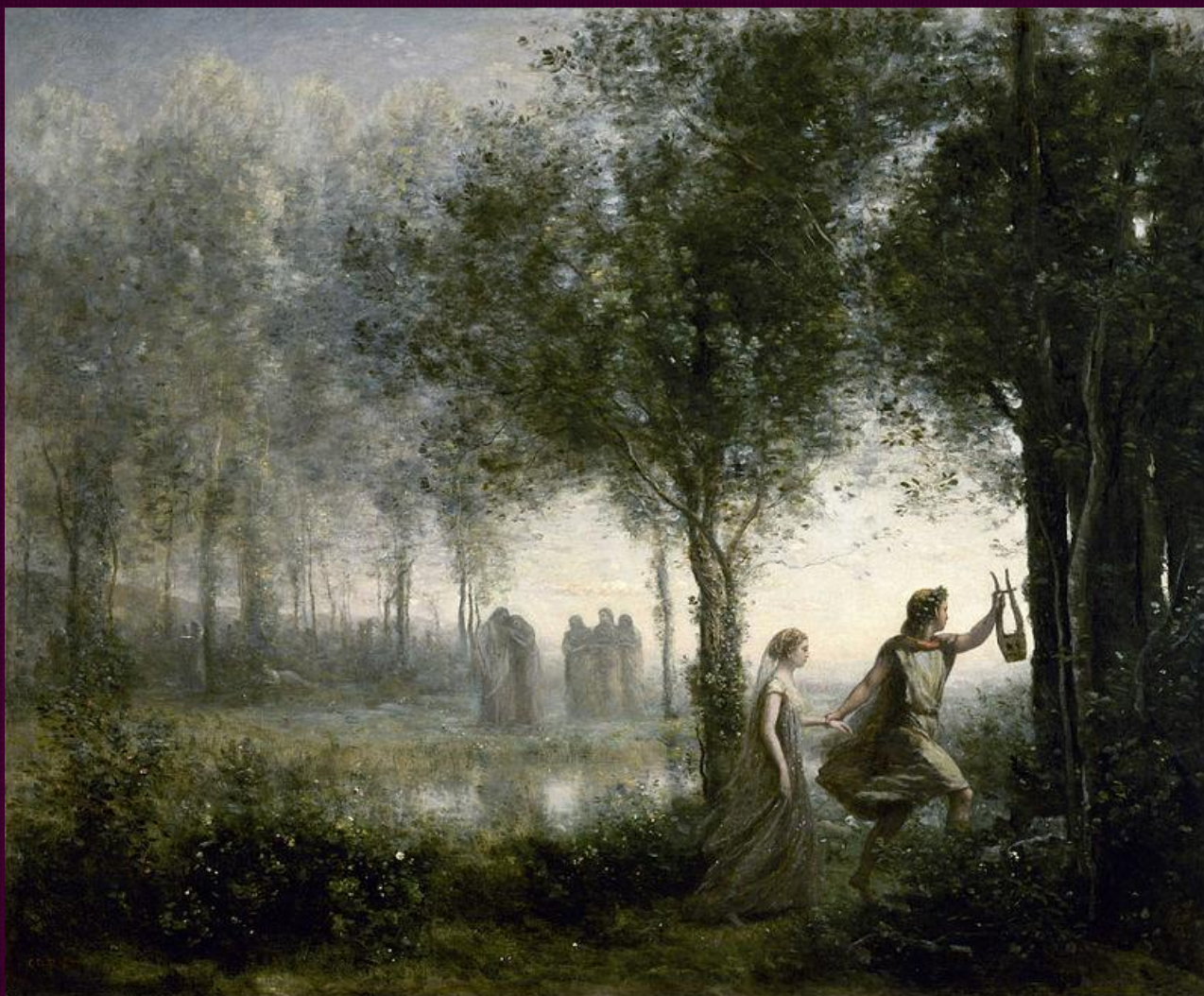
Орфей и Эвридика. 1861. Музей изящных искусств, Хьюстон