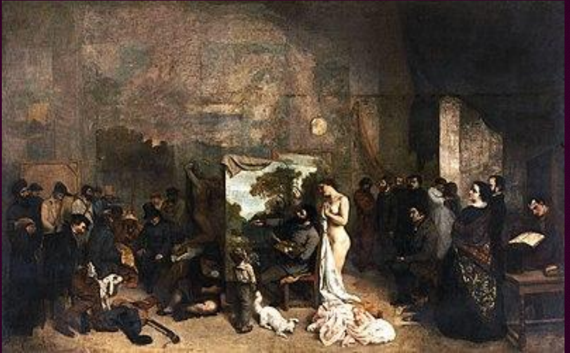
Мастерская. 1855. Музей д'Орсе, Париж