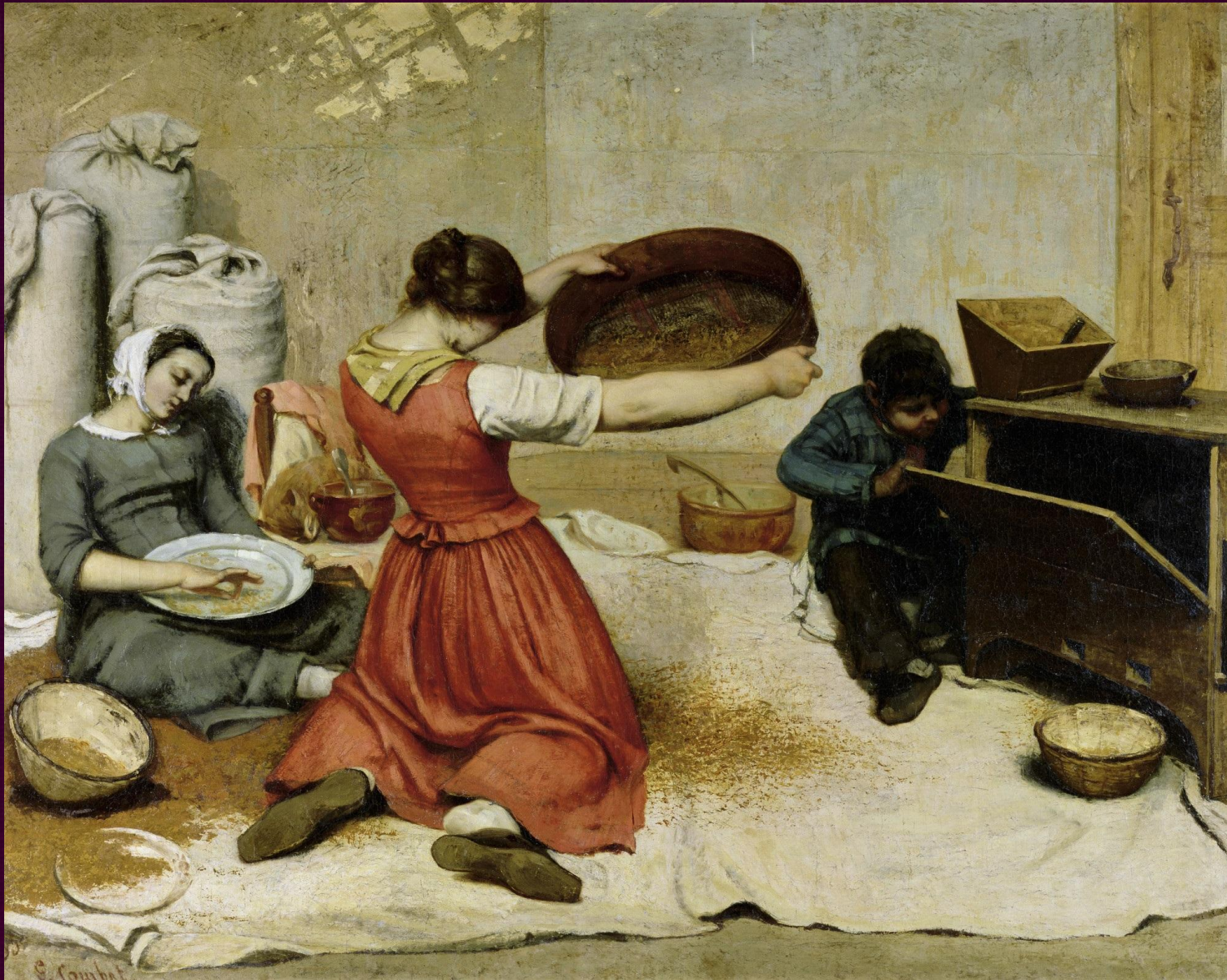
Вяльщицы. 1855. Музей изящных искусств, Нант