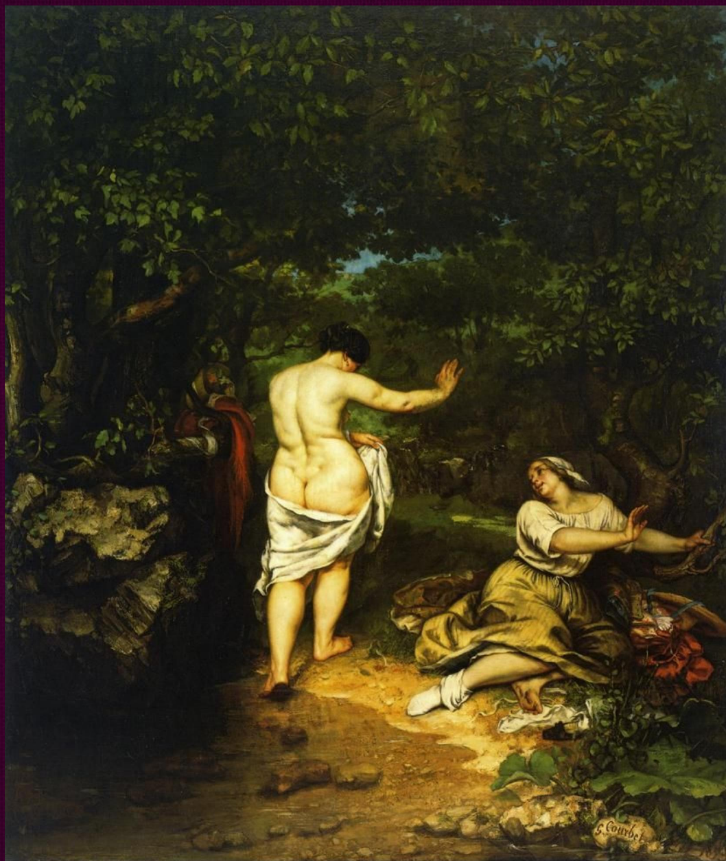
Купальщицы. 1853. Музей Фабр, Монпелье