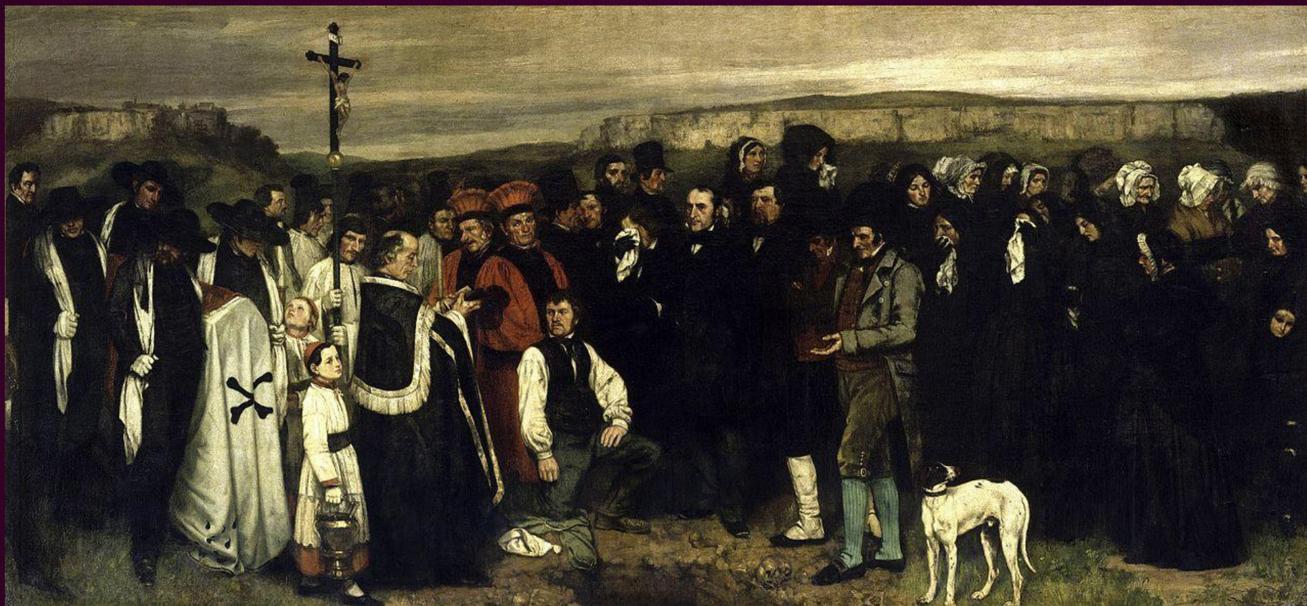
Похороны в Орнане. 1849—1850. Музей д'Орсэ, Париж