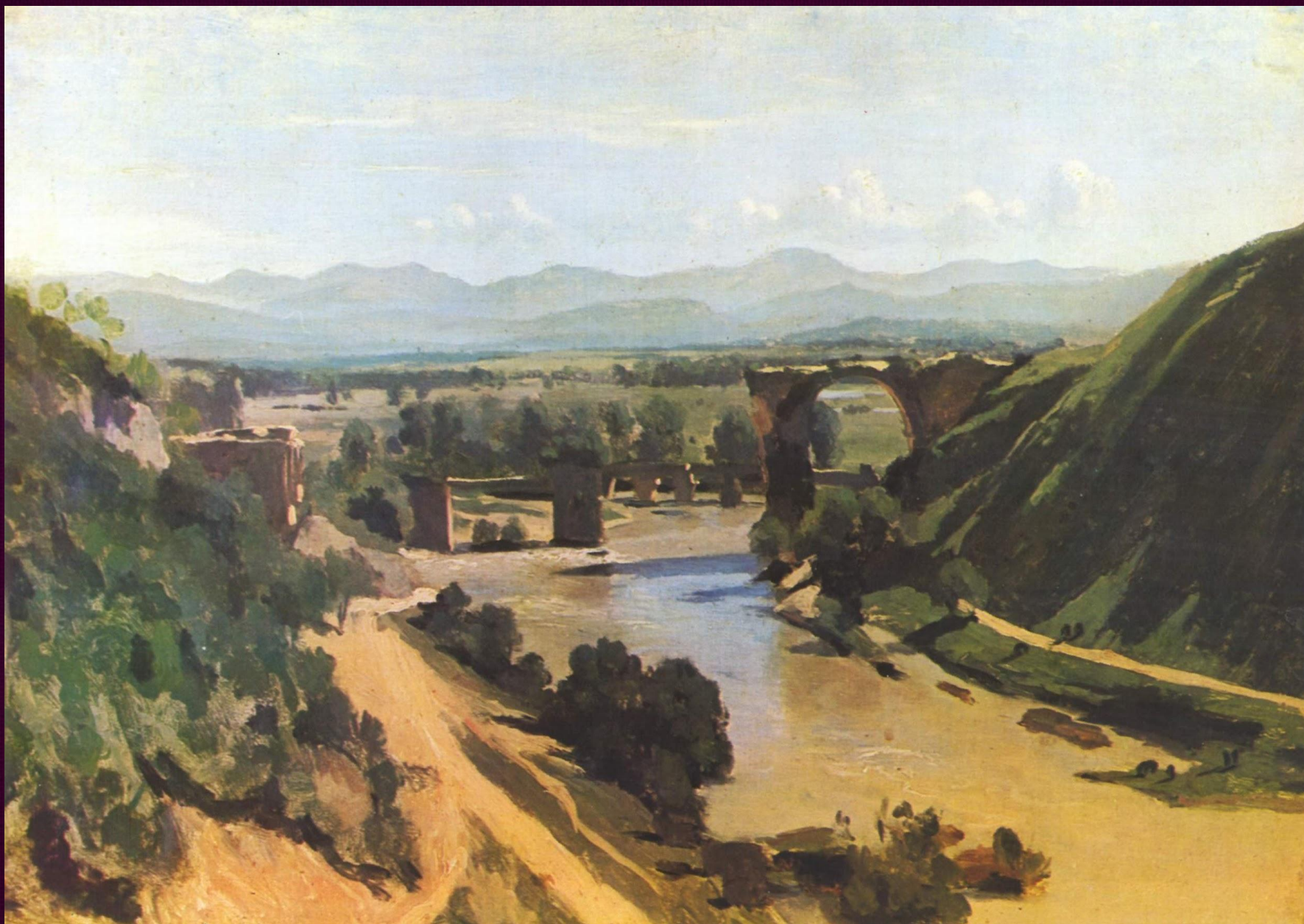
Мост в Нарни. 1826. Лувр, Париж