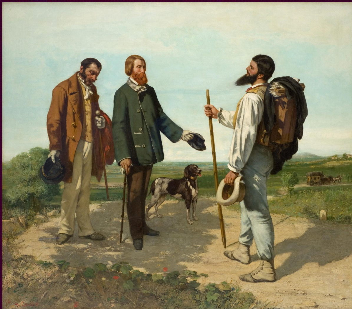
Встреча (Здравствуйте, господин Курбе!). 1854. Музей Фабр, Монпелье