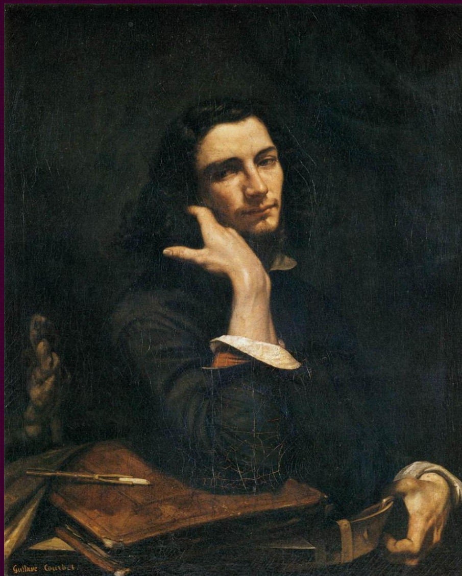
Мужчина с кожаным поясом. 1845-1846. Музей д'Орсэ, Париж