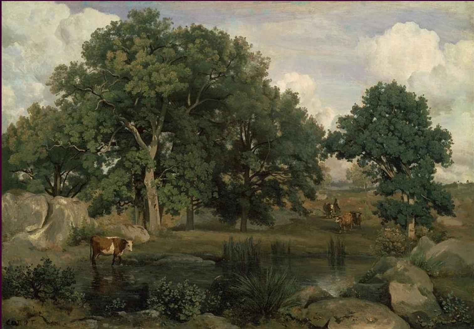
Лес Фонтенбло. 1846. Музей изящных искусств, Бостон