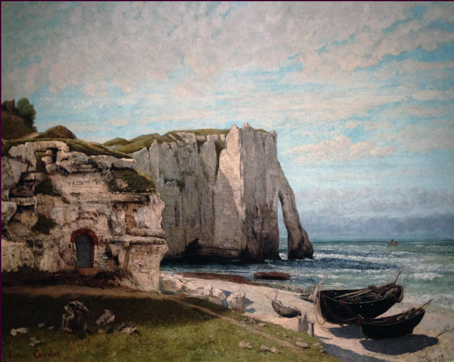
Скала в Этрета после грозы. 1869. Музей д'Орсе, Париж