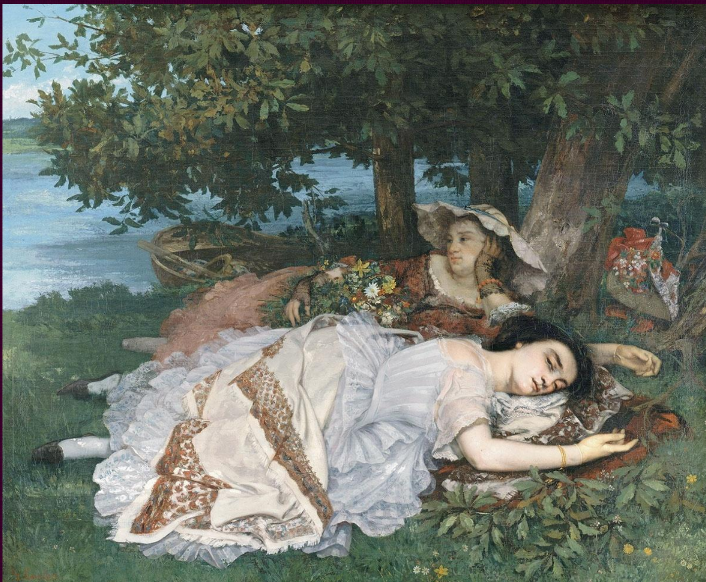
Девушки, отдыхающие на берегу Сены. 1856-1857. Пти Пале, Париж