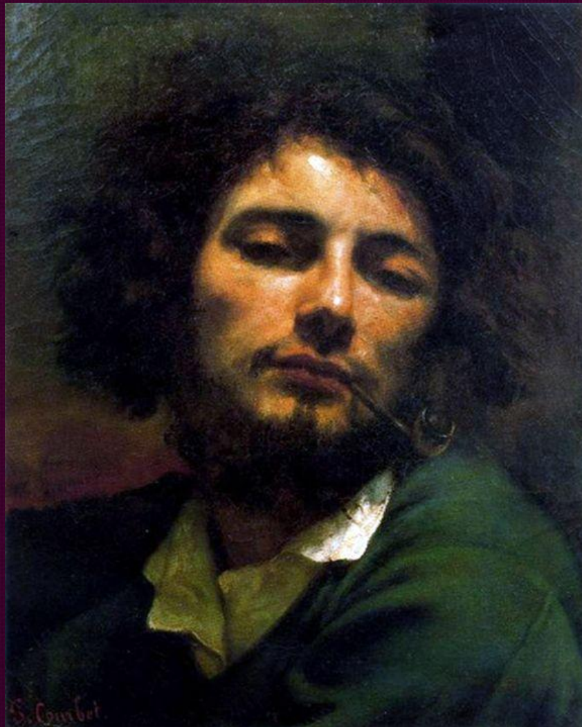
Автопортрет (Мужчина с трубкой). 1849. Музей Фабр, Монпелье