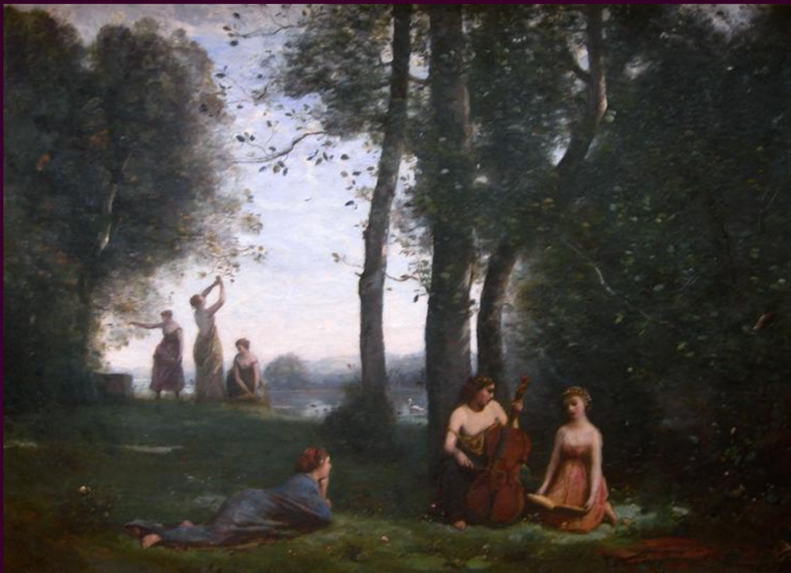
Сельский концерт. 1844-1857. Музей Конде, Шантийи