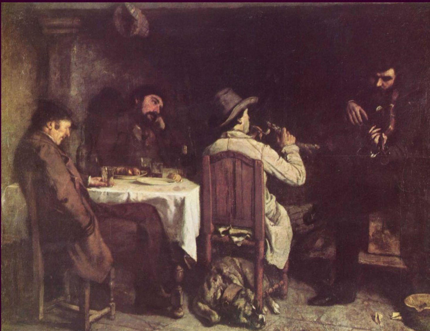
Послеобеденный отдых в Орнани. 1848-1849. Музей изящных искусств, Лилль