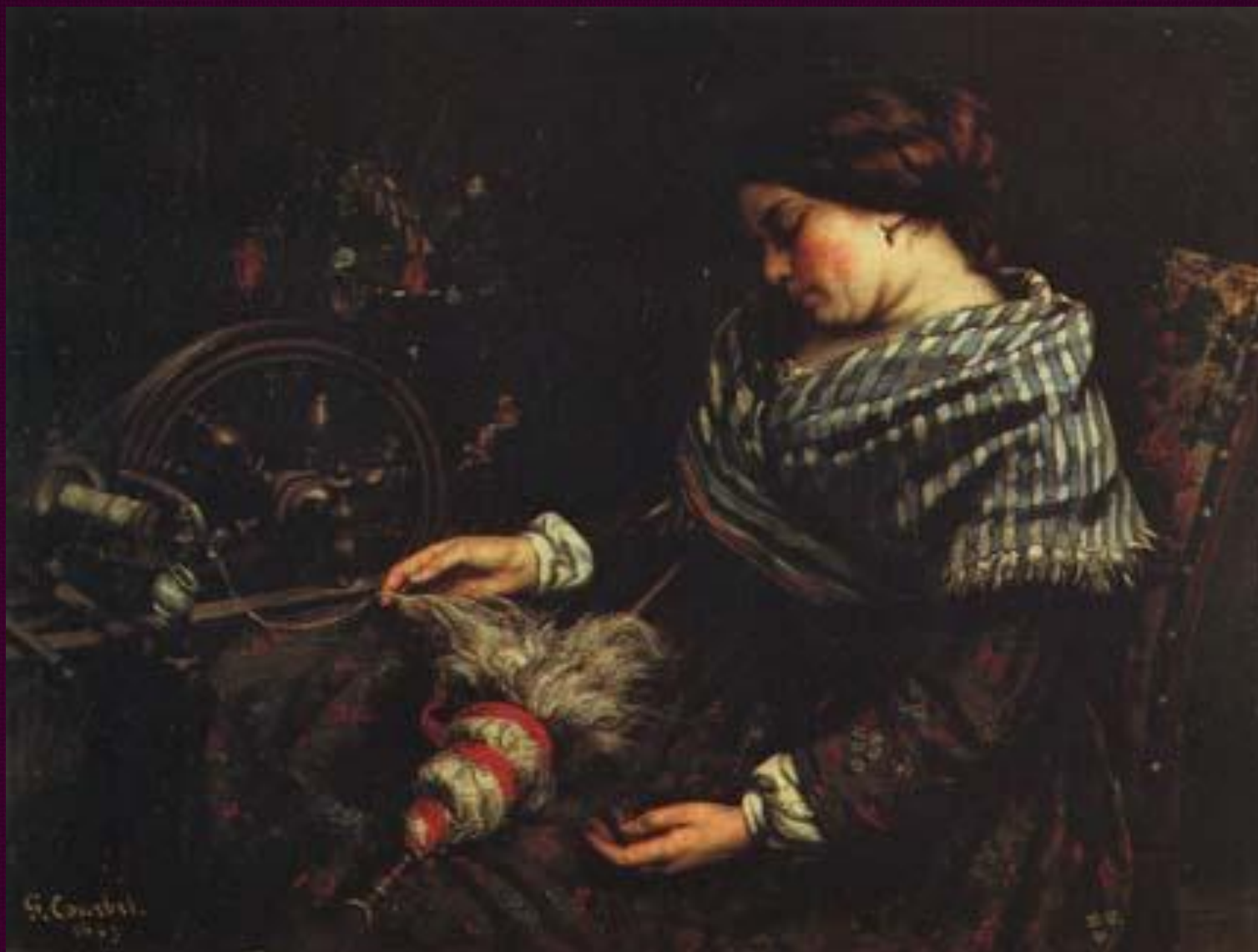
Спящая пряжа. 1853. Музей Фабр, Монпелье