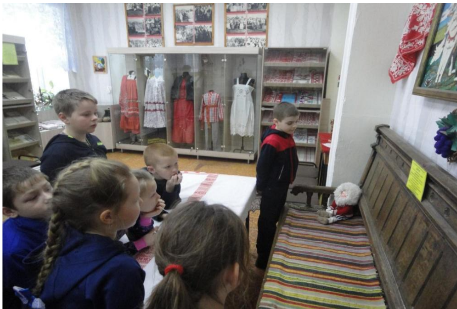
Ткацкий станок из краеведческого музея МКОУ «Бирюковская ООШ»