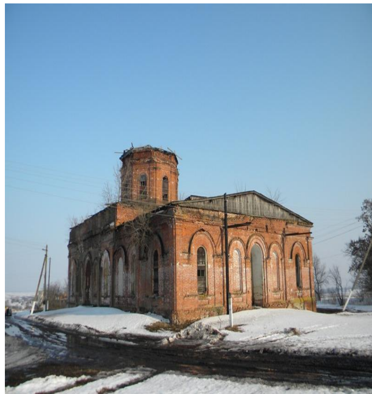
Храм Михаила Архангела в селе Любостань