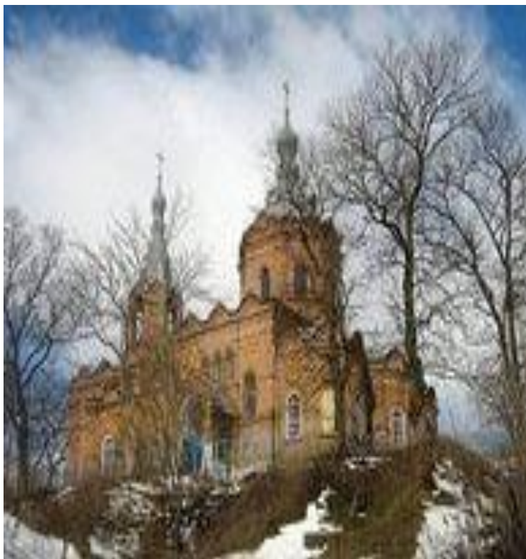
Храм Николая Чудотворца в селе Ржава