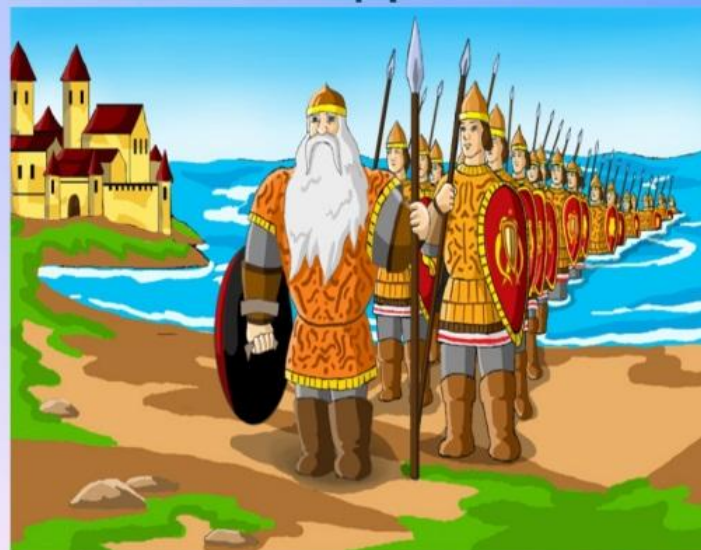
Сказка о царе Салтане

30 ЛЕТ И 3 ГОДА, 33 БОГАТЫРЯ — ЭТА ЦИФРА ВСТРЕЧАЕТСЯ ВО МНОГИХ СКАЗКА, ФРАЗЕОЛОГИЗМАХ И СКОРОГОВОРКАХ.