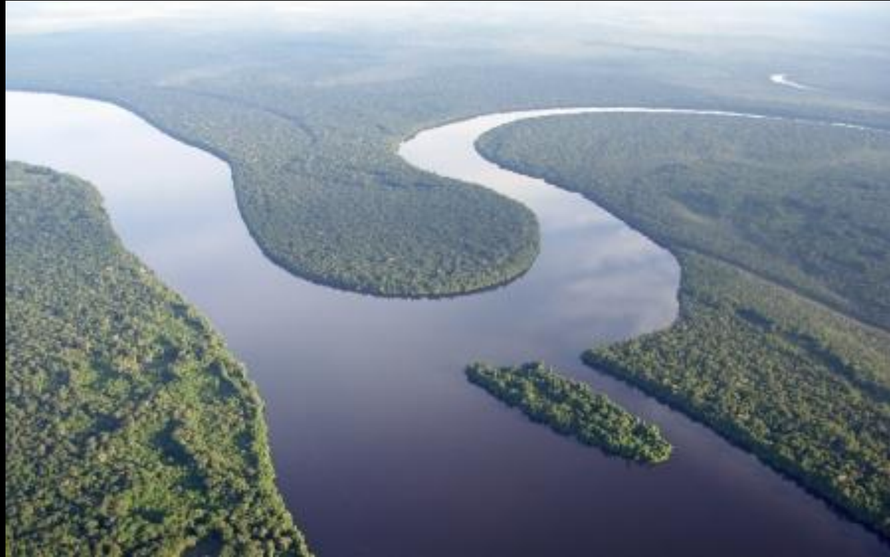
Рио-Негро крупнейший левый приток Амазонки, 2300 км