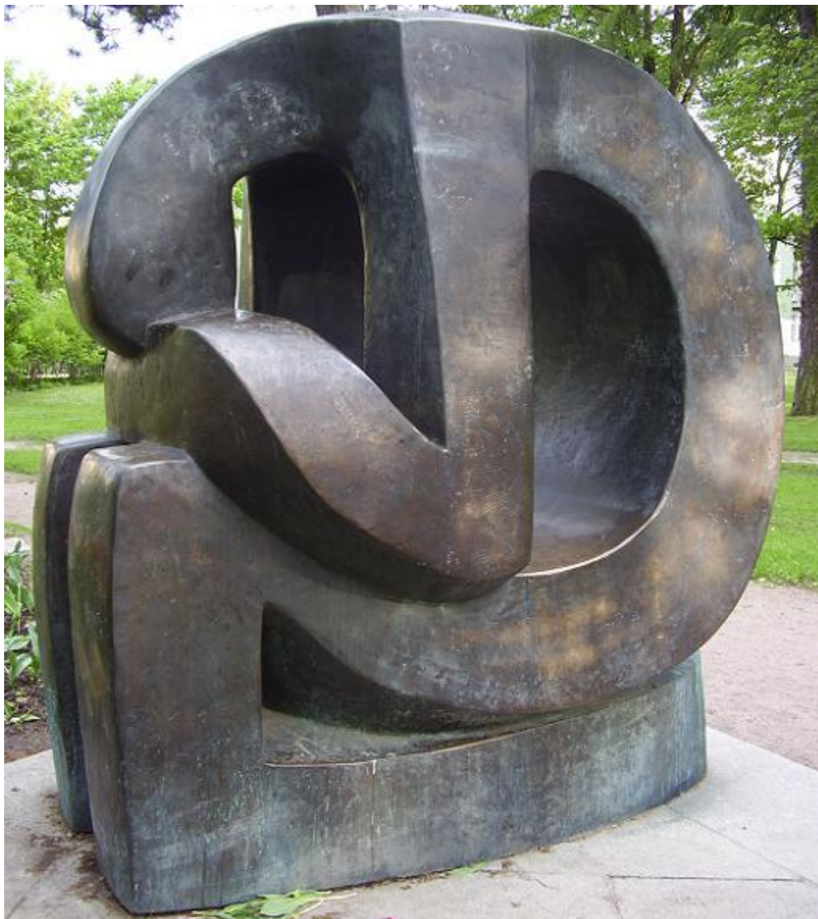
ВАДИМ СИДУР. ФОРМУЛА СКОРБИ (1991, г. Пушкин Ленинградско й обл.)