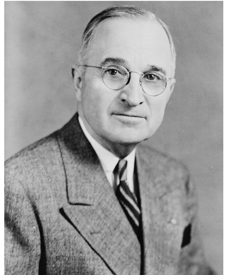
Гарри Трумэн государственный деятель, 33-й президент США в 1945—1953 годах от Демократической партии.