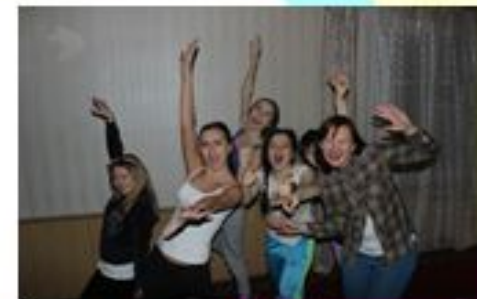
Общий выезд кафедры на базу отдыха