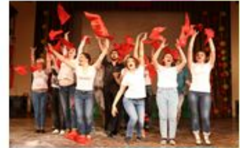
День специальности «Государственное и муниципальное управление»