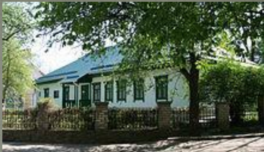
Житомирский дом, в котором прошли детские и ранние юношеские годы В. Короленко, с 1972 года — музей