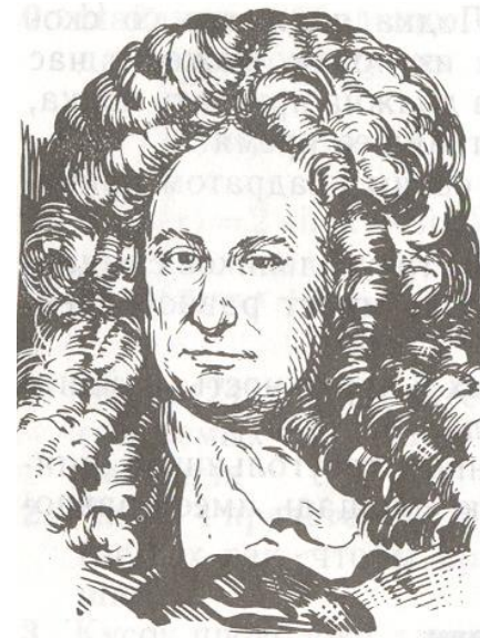
Лейбниц Готфрид Фридрих (1646 – 1716) – великий немецкий учёный. Философ, математик, физик, юрист, языковед.