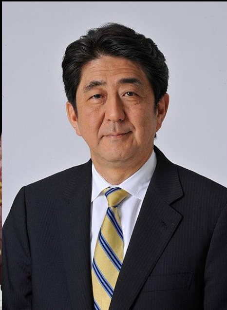
Синдзо Абэ — 57-й Премьер-министр Японии

Япония - унитарное демократическое национальное государство, парламентская конституционная монархия.