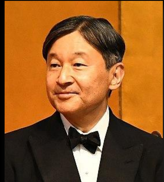
Нарухито — 126-й император Японии