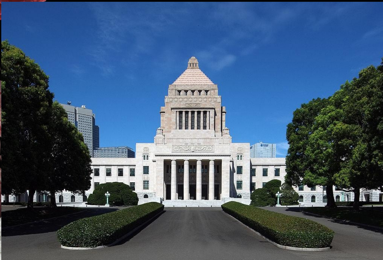
Здание Парламента Японии