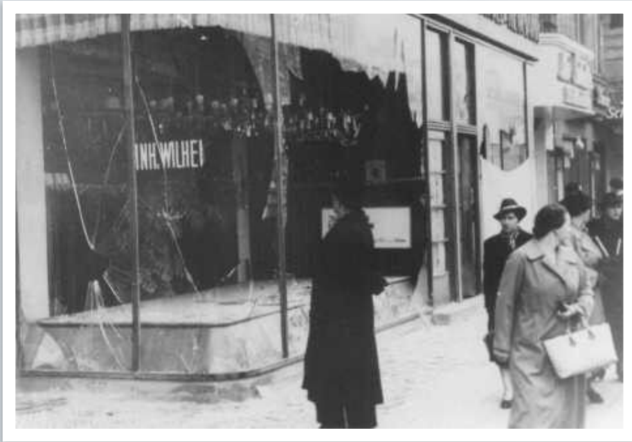
Магазин, принадлежавший евреям и разоренный во время "Хрустальной ночи"

Поводом к началу еврейских погромов послужило убийство 7 ноября 1938 в Париже 17-летним польским евреем Гершелем Гриншпаном советника германского посольства Эрнста фон Рата.