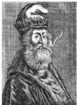
Раймонд Луллий (1235-1315) и его машина открытий