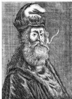
Раймонд Луллий (1235-1315) и его машина открытий