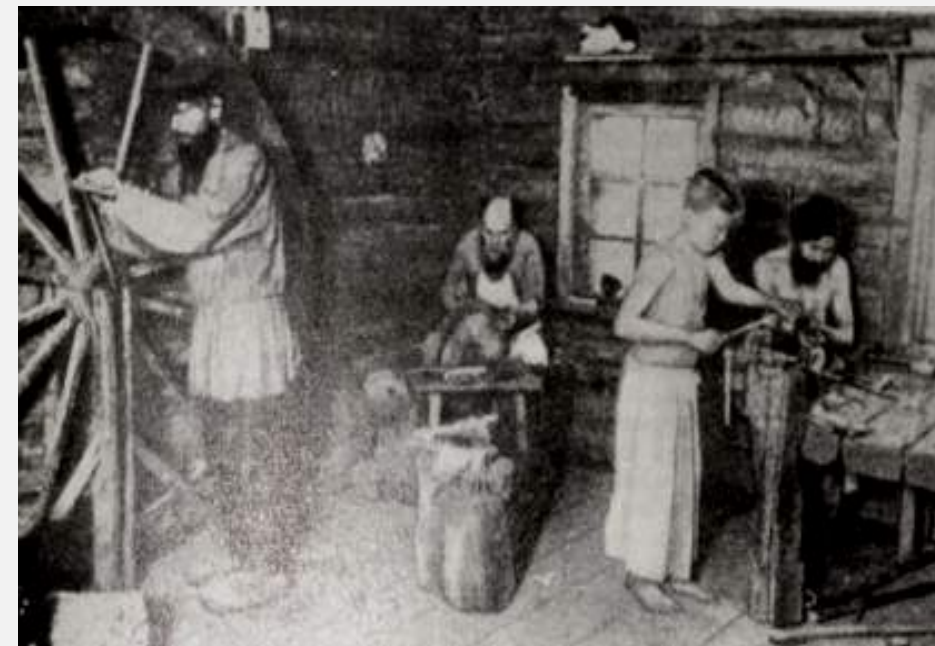
Производство ножниц в кустарной мастерской (Фотография. 90-е годы XIX века).

классы общества: капиталисты и наемные рабочие