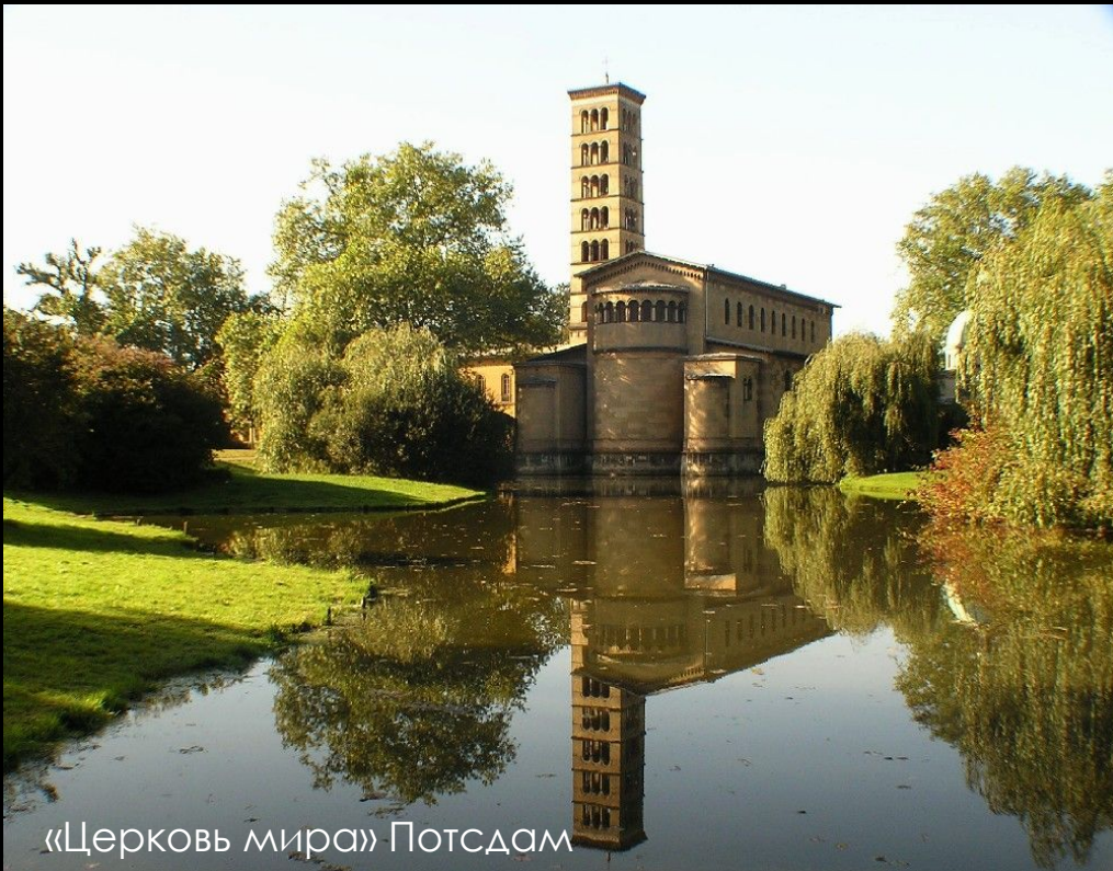
«Церковь мира» Потсдам

Большинство верующих — лютеране. Крупнейшая лютеранская деноминация — Евангелическая церковь Берлина-Бранденбурга-Силезской Верхней Лужицы (Evangelische Kirche Berlin-Brandenburg-schlesische Oberlausitz).