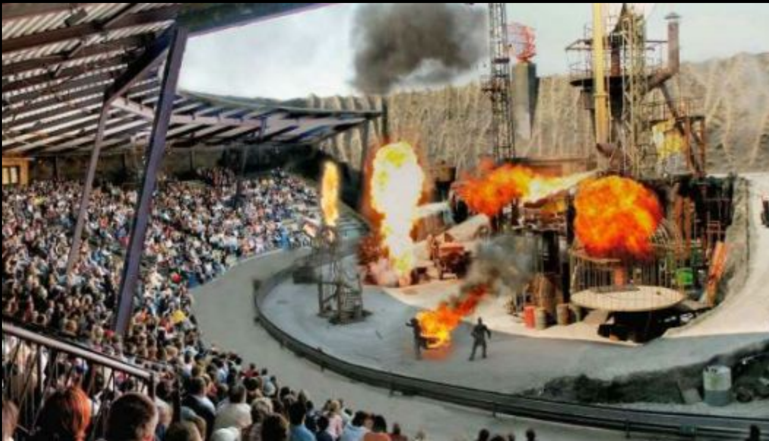
В кинопарке Бабельсберг

Интересным будет посещение местных парков, например, кинопарка Бабельсберг, считающимся местным Голивудом или тропического парка Биосфера.