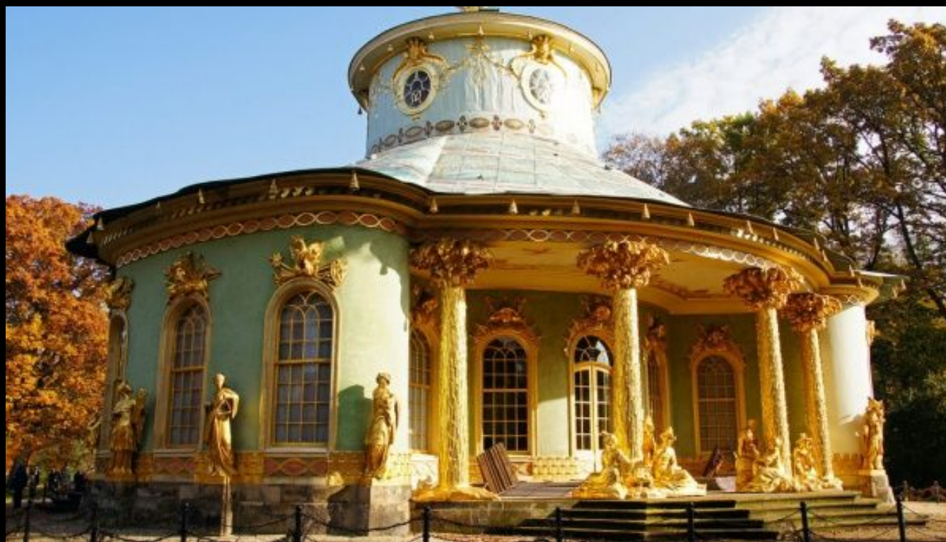
Китайский чайный домик в Потсдаме

Массу удовольствия доставит выставка фарфора, расположенная в китайском чайном домике восемнадцатого века в Потсдаме. Дрезден знаменит самым красивым молочным магазином на свете, великолепным зоопарком и огромным количеством исторических ценностей.