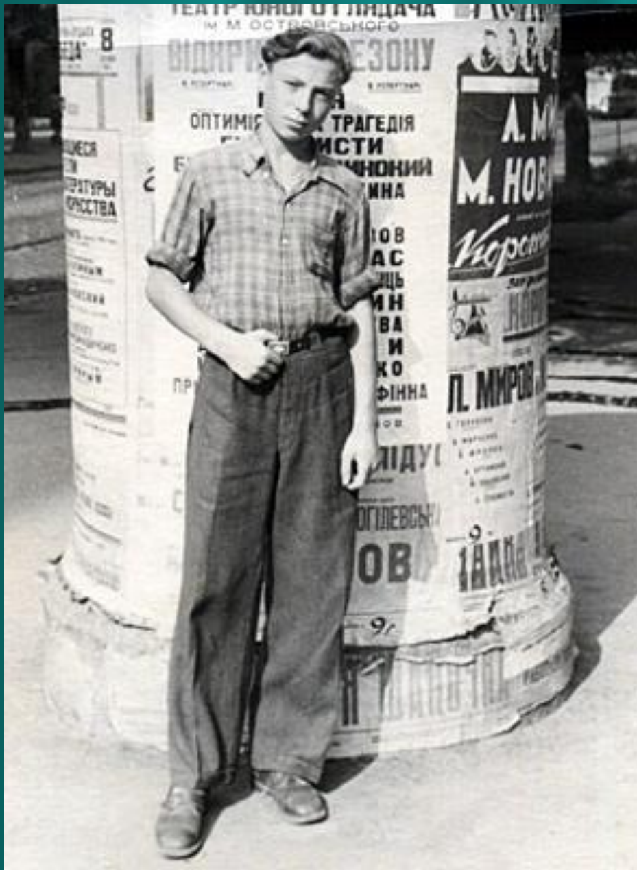
1956 год. Будущий певец В.Ободзинский в Одессе у тумбы с афишами

в 1942 года в Одессе во время оккупации немецкими войсками.