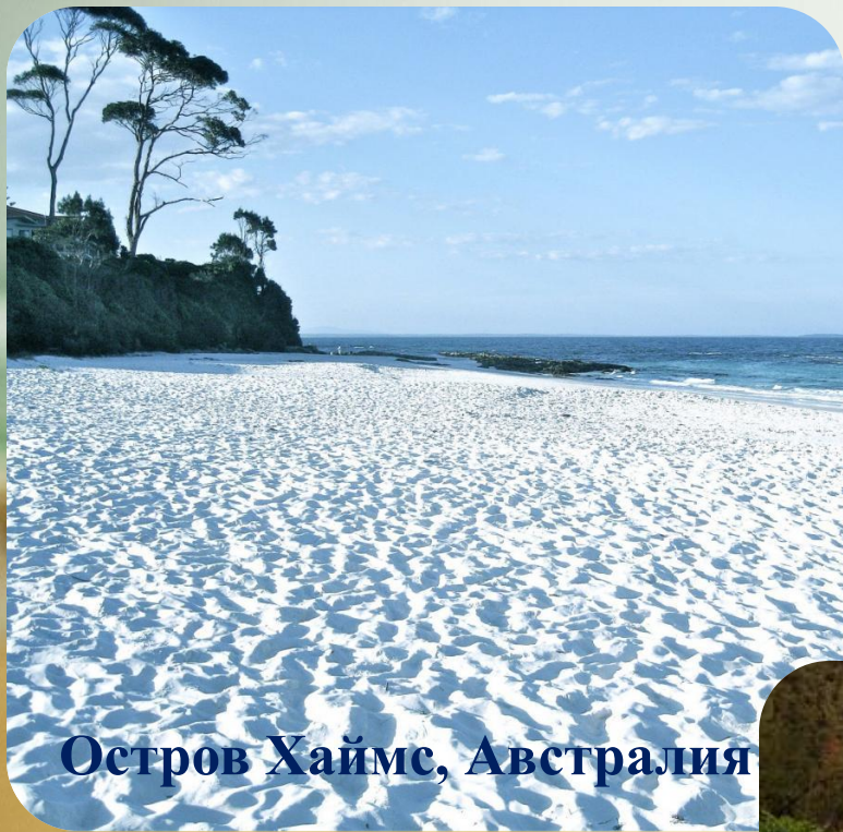
Остров Хаймс, Австралия