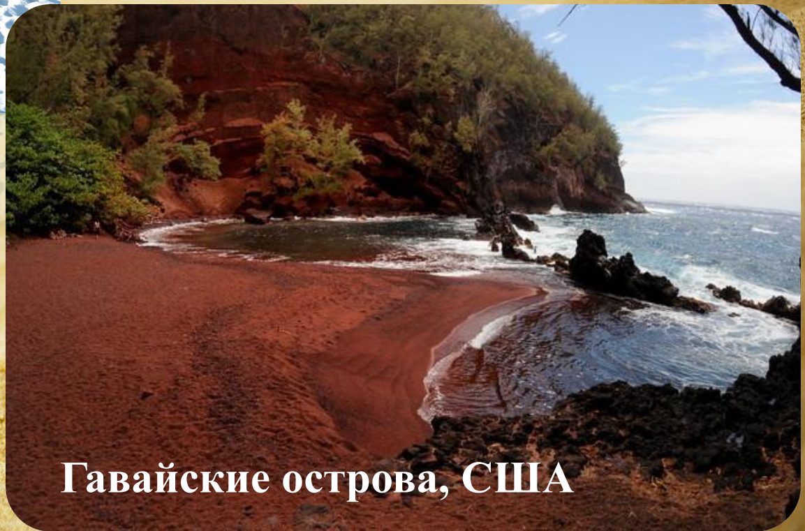
Гавайские острова, США