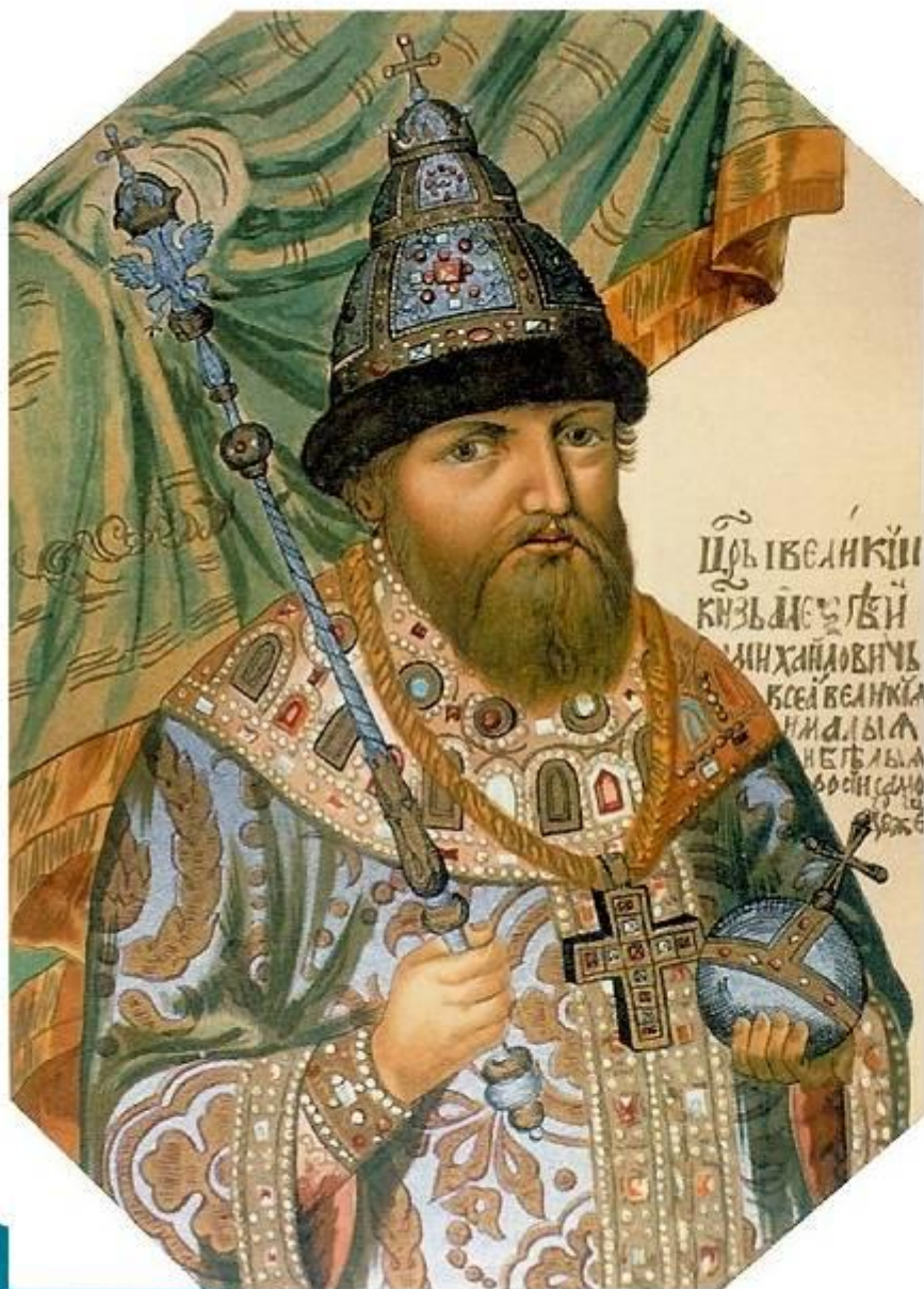
Алексей Михайлович Романов (1645–1676)