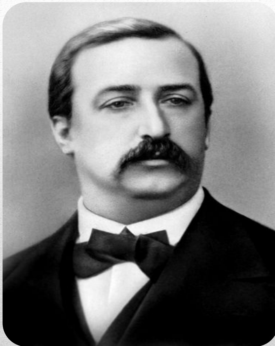
А. С. БОРОДИН