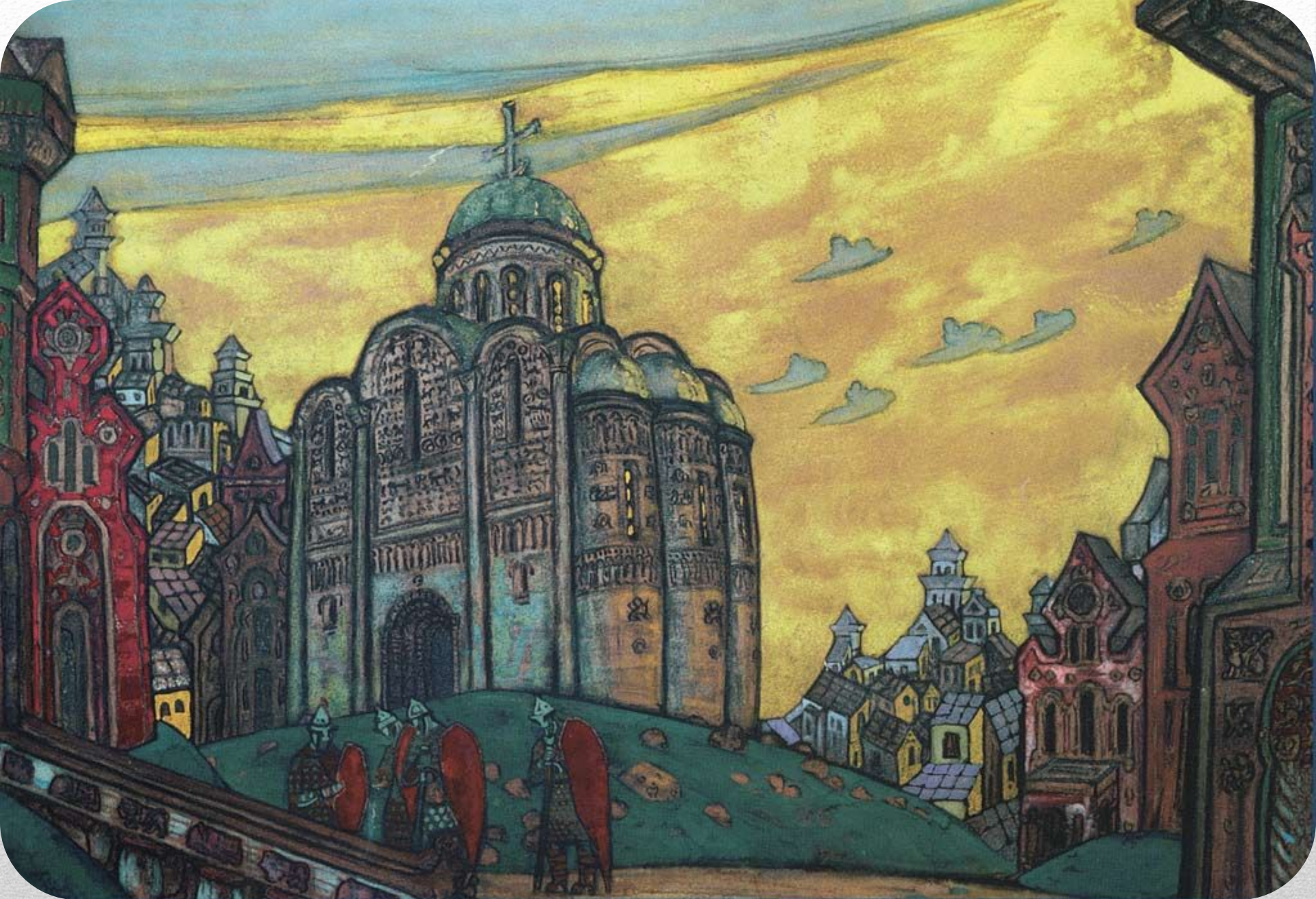
Н. Рерих Путивль. Эскиз декорации оперы А. Бородина «Князь Игорь» 1914 г.