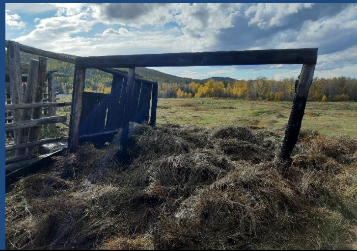
Фото № 4. Обзорный снимок места пожара, стога сена внутри деревянного сарая вид с восточной стороны