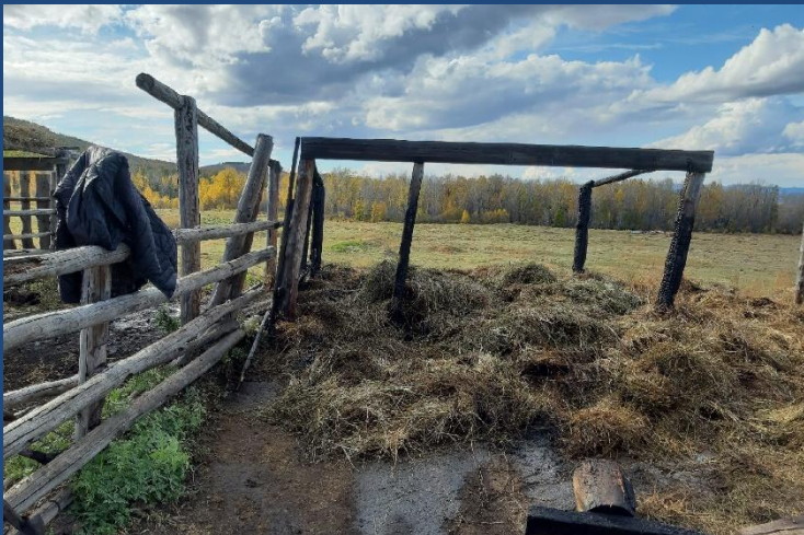
Фото № 1. Обзорный снимок места пожара, стога сена внутри деревянного сарая вид с восточной стороны