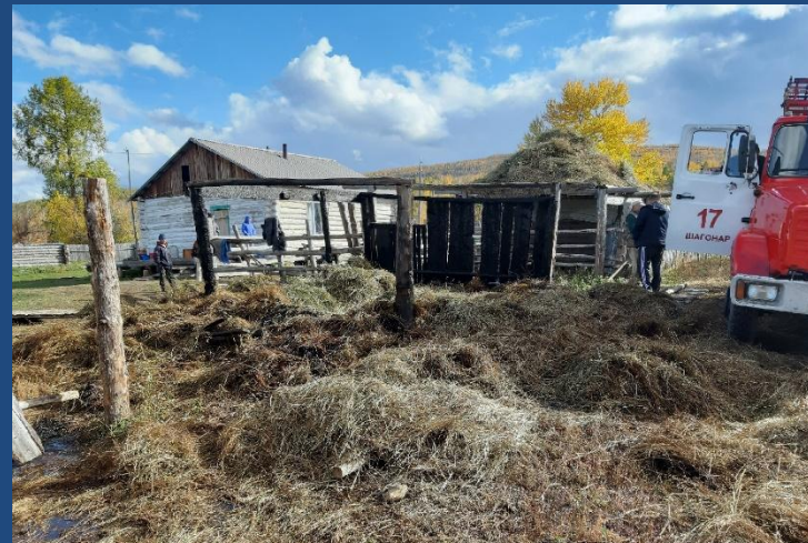
Фото № 2. Обзорный снимок места пожара, стога сена внутри деревянного сарая вид с западной стороны