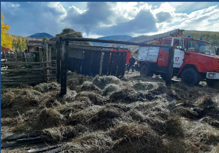
Фото № 3. Обзорный снимок места пожара, стога сена внутри деревянного сарая вид с северной стороны