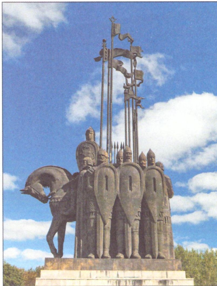
Памятник Александру Невскому и его дружине. Псковская область