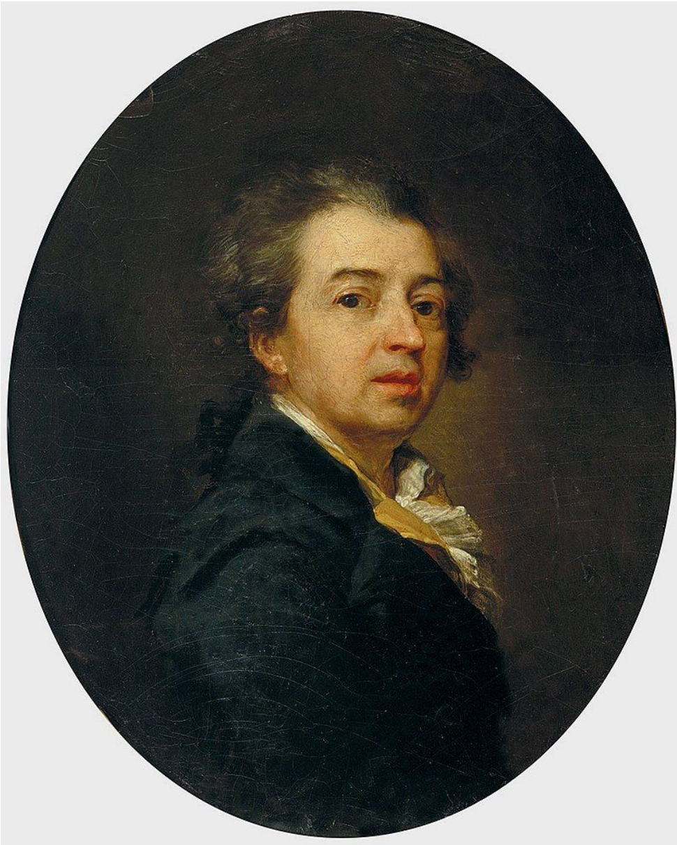
Автопортрет Д. Левицкого