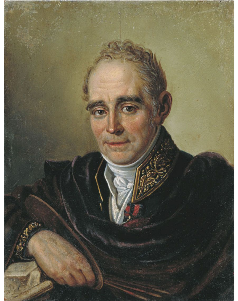
Портрет В. Боровиковского работы И.С. Бугаевского-Благодарного

Творчество ВЛАДИМИРА ЛУКИЧА БОРОВИКОВСКОГО (1757 - 1825) принадлежит сразу двум столетиям. Последний живописец века Просвещения, он как бы подготавливает появление российских романтиков: биографией и воспитанием связанный с «рационалистами», эмоционально он тяготеет к тому, еще неведомому поколению, что придет им на смену. Его искусство неоднородно, его судьба при всем внешнем благополучии (успех, карьера, ученики) внутренне драматична. Расцвет его искусства был недолгим - чуть более десятка лет на рубеже XVIII - XIX вв., - но прекрасным. Он создал множество прекрасных портретов своих современников. Но наиболее ярко его талант раскрылся в серии женских портретов. Они невелики по размерам, порой сходны по композиционному решению, но их отличает исключительная тонкость в передаче характеров, неуловимых движений душевной жизни и объединяет нежное поэтическое чувство.