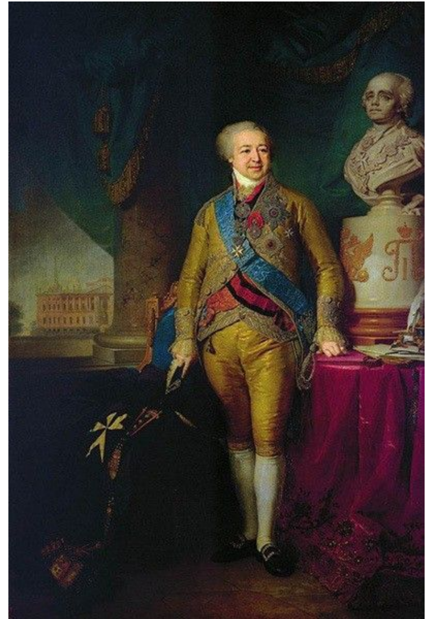
«Портрет князя А. Б. Куракина»

Особое место в творчестве Боровиковского составляют мужские парадные портреты . Своеобразием русского парадного портрета, призванного прославлять прежде всего положение человека в сословном обществе, было стремление к раскрытию внутреннего мира человека. Художнику позировали вельможи, генералы, отцы церкви. Нарочитой роскошью блещет изображение «бриллиантового князя» Куракина , прозванного так за любовь к драгоценностям и показной пышности. Подобно ряду полотен Ф. Гойи, оно показывает, что великолепие живописи становится одним из последних доводов в пользу величия аристократии: сами модели уже не всегда способны выдержать тот пафос, который диктуется жанром. Исполнение заказных парадных портретов свидетельствует о широте творческих возможностей Боровиковского, которому были доступны не только лирические и интимные портреты, но и произведения монументального плана.