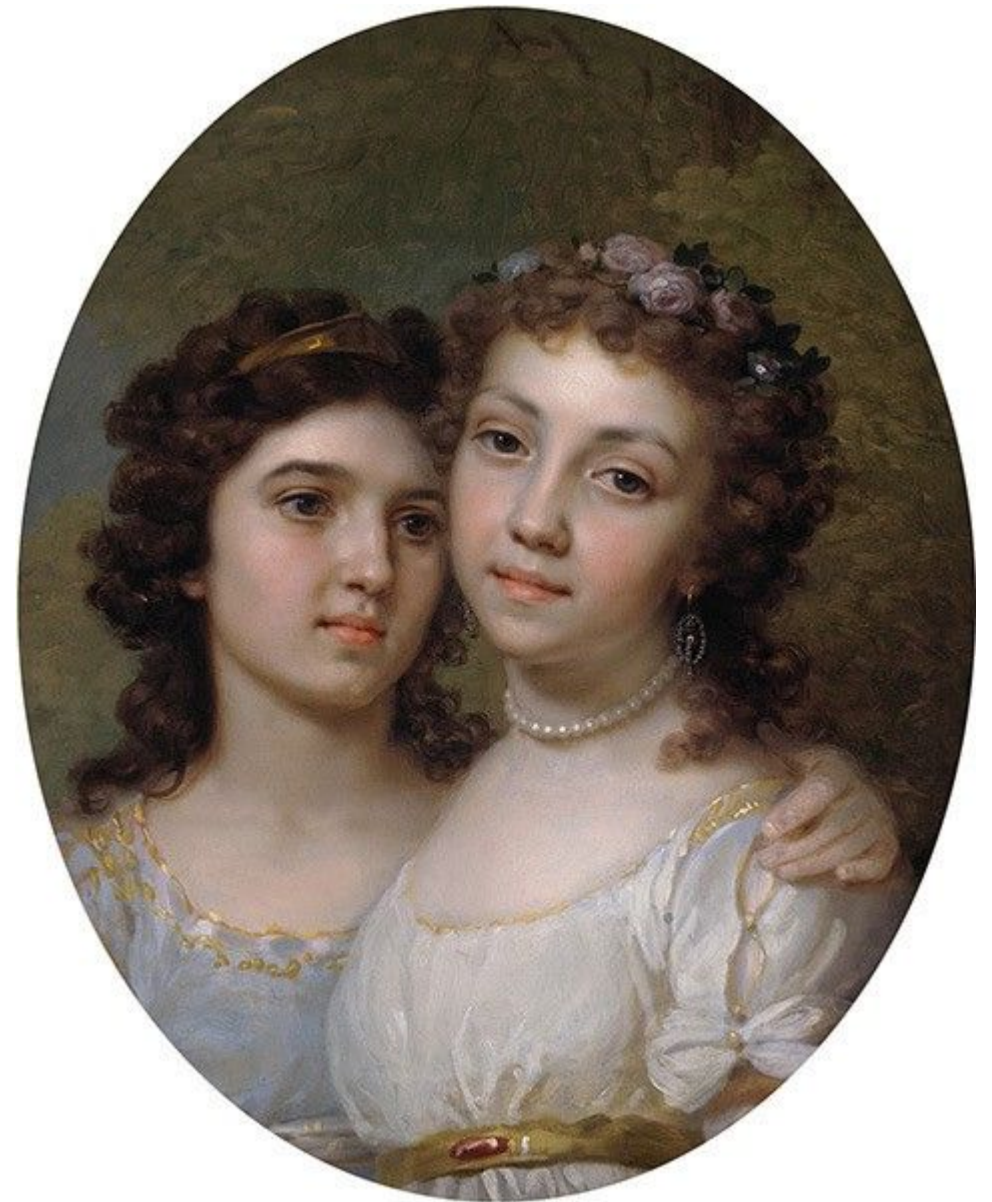
«Лизынька и Дашинька»

Правда, во многих произведениях Боровиковского «причастность природе» персонажа приобретает характер клише, свидетельствующего о том, что чувствительность и естественность превратились в моду. Особенно это заметно в виртуозно исполненных женских портретах, следующих идеалу юной «природной» красоты и калькирующих позы и атрибуты модели. С другой стороны, эта рамка пасторального портрета позволяла включать в число персонажей крепостных. Таковы, например, «Лизынька и Дашинька» - дворовые девушки покровительствовавшего живописцу Львова, почти неотличимые внешне от молодых дворянок.