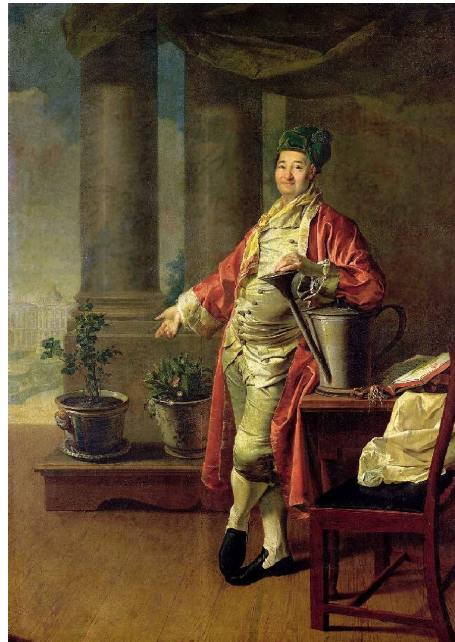
«Портрет П.А. Демидова»

Уже в ранних работах Д. Левицкий показал себя первоклассным мастером парадного портрета, способным найти выразительную позу и жест, сочетать интенсивность цвета с тональным единством и богатством оттенков. Это проявилось, например, в портрете Прокопия Демидова , владельца крупнейших горнопромышленных предприятий. Вместе с нелепыми прихотями богатого человека в нем уживались образованность и любознательность, страсть к просвещению и бескорыстная щедрость мецената. Однажды он скупил в Петербурге всю пеньку, чтобы проучить англичан, заставивших его во время пребывания в Англии заплатить непомерную цену за нужные ему товары. Им было основано Коммерческое училище в Москве и были переданы большие суммы Московскому воспитательному дому и Московскому университету. Научным увлечением Демидова было собирание гербария: его усадьба славилась цветниками и ботаническим садом, где были собраны редчайшие растения.