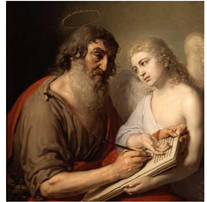
«Евангелист Матфей» Икона из Царских врат главного иконостаса Казанского собора в Петербурге

Много десятилетий прошло, прежде чем появился широкий общественный интерес к этому большому художнику. Его работы, разбросанные по дворянским усадьбам и частным собраниям, только после 1917 г. влились в музеи и сейчас с достаточной полнотой представляют творческое наследие этого выдающегося мастера.