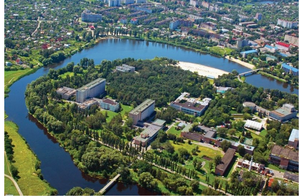
Миргород – родина В. Боровиковского

Художник родился в Миргороде в небогатой казацкой семье. По семейной традиции в 1774 г. поступил на военную службу в Миргородский полк, но в походах не бывал. Вместе с отцом и братьями занимался иконописью. В 1787 г. Екатерина II совершала путешествие в Крым. На пути ее следования воздвигали «путевые» дворцы. Для одного из них Боровиковский написал аллегорические картины, прославлявшие императрицу (Петр I вспахивает землю, а Екатерина II засеивает ее семенами). Картины понравились и в 1788 г. Боровиковский был приглашен в Петербург. Учился живописи у Д. Левицкого. Через несколько лет стал одним из известнейших художников-портретистов. В 1802 г. получил почетное звание советника Академии художеств. Ни слава, ни деньги не меняли художника. Он вел одинокую, замкнутую жизнь, всецело поглощенный искусством. О себе писал: «Я занят трудами моими непрерывно. Мне потерять час превеликую в моих обязанностях произведет расстройку».