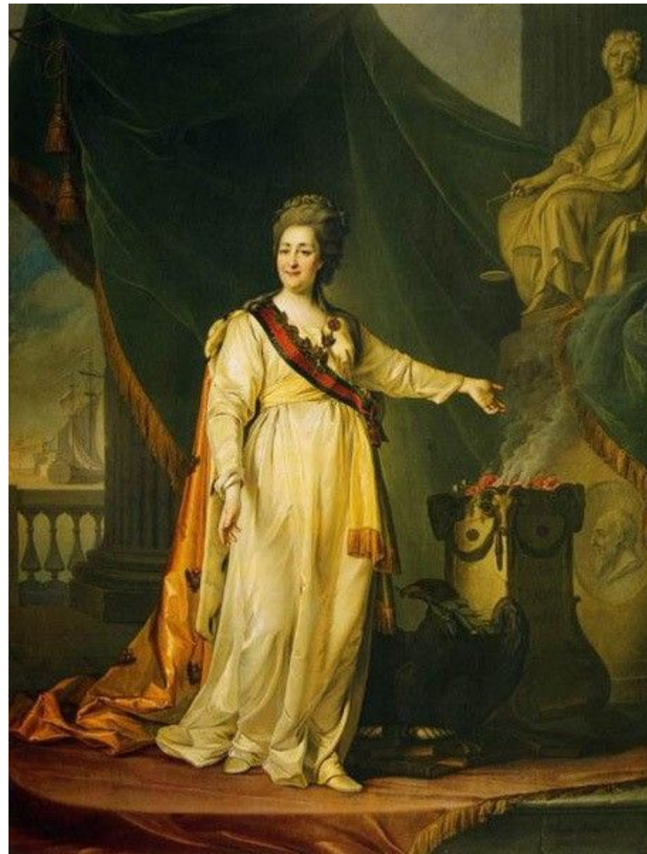
«Портрет Екатерины-законодательницы в храме богини правосудия»

Актуальные для русского Просвещения идеи подчинения самовластию закону были воплощены Левицким в картине «Екатерина II-законодательница в храме богини правосудия» . Полотно Левицкого - уникальный случай, когда изображение монарха, полностью отвечая канонам жанра, является посланием общества государю, передает чаяния просвещенного дворянства. Императрица в лавровом венке и гражданской короне, жертвуя своим покоем, сжигает маки на стоящем под статуей Фемиды алтаре с надписью «для общего блага». На постаменте скульптуры вырезан профиль Солона — афинского законодателя. Имперский орел восседает на фолиантах законов, а в раскрытом позади царицы море виден русский флот под Андреевским флагом с жезлом Меркурия, знаком защищенной торговли, то есть мира и процветания.