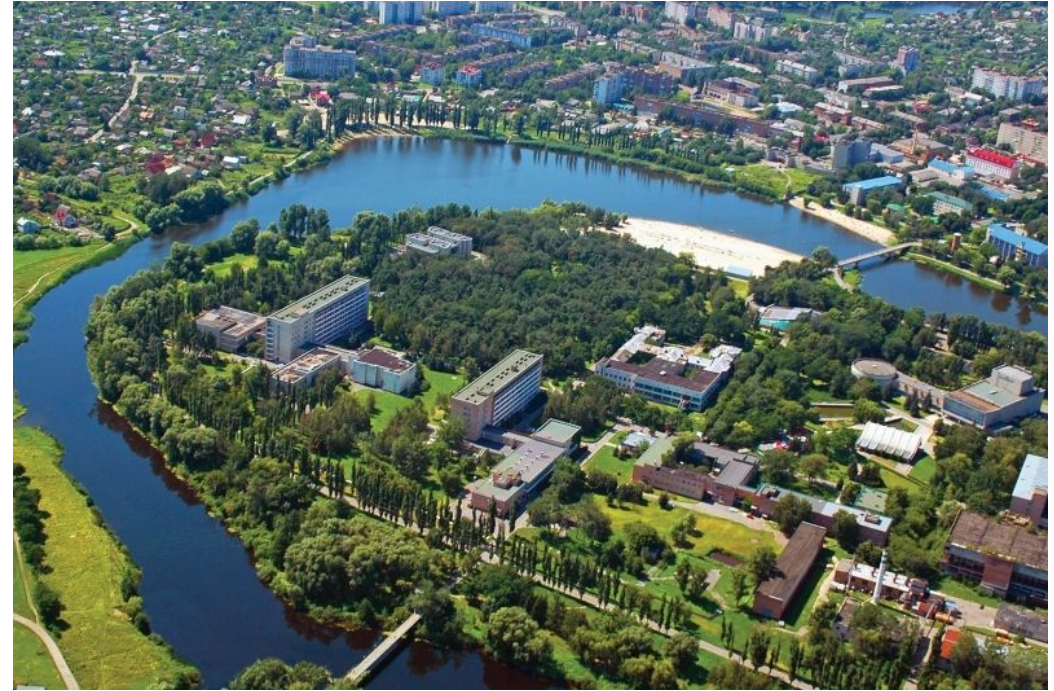
Миргород – родина В. Боровиковского

Художник родился в Миргороде в небогатой казацкой семье. По семейной традиции в 1774 г. поступил на военную службу в Миргородский полк, но в походах не бывал. Вместе с отцом и братьями занимался иконописью. В 1787 г. Екатерина II совершала путешествие в Крым. На пути ее следования воздвигали «путевые» дворцы. Для одного из них Боровиковский написал аллегорические картины, прославлявшие императрицу (Петр I вспахивает землю, а Екатерина II засеивает ее семенами). Картины понравились и в 1788 г. Боровиковский был приглашен в Петербург. Учился живописи у Д. Левицкого. Через несколько лет стал одним из известнейших художников-портретистов. В 1802 г. получил почетное звание советника Академии художеств. Ни слава, ни деньги не меняли художника. Он вел одинокую, замкнутую жизнь, всецело поглощенный искусством. О себе писал: «Я занят трудами моими непрерывно. Мне потерять час превеликую в моих обязанностях произведет расстройку».