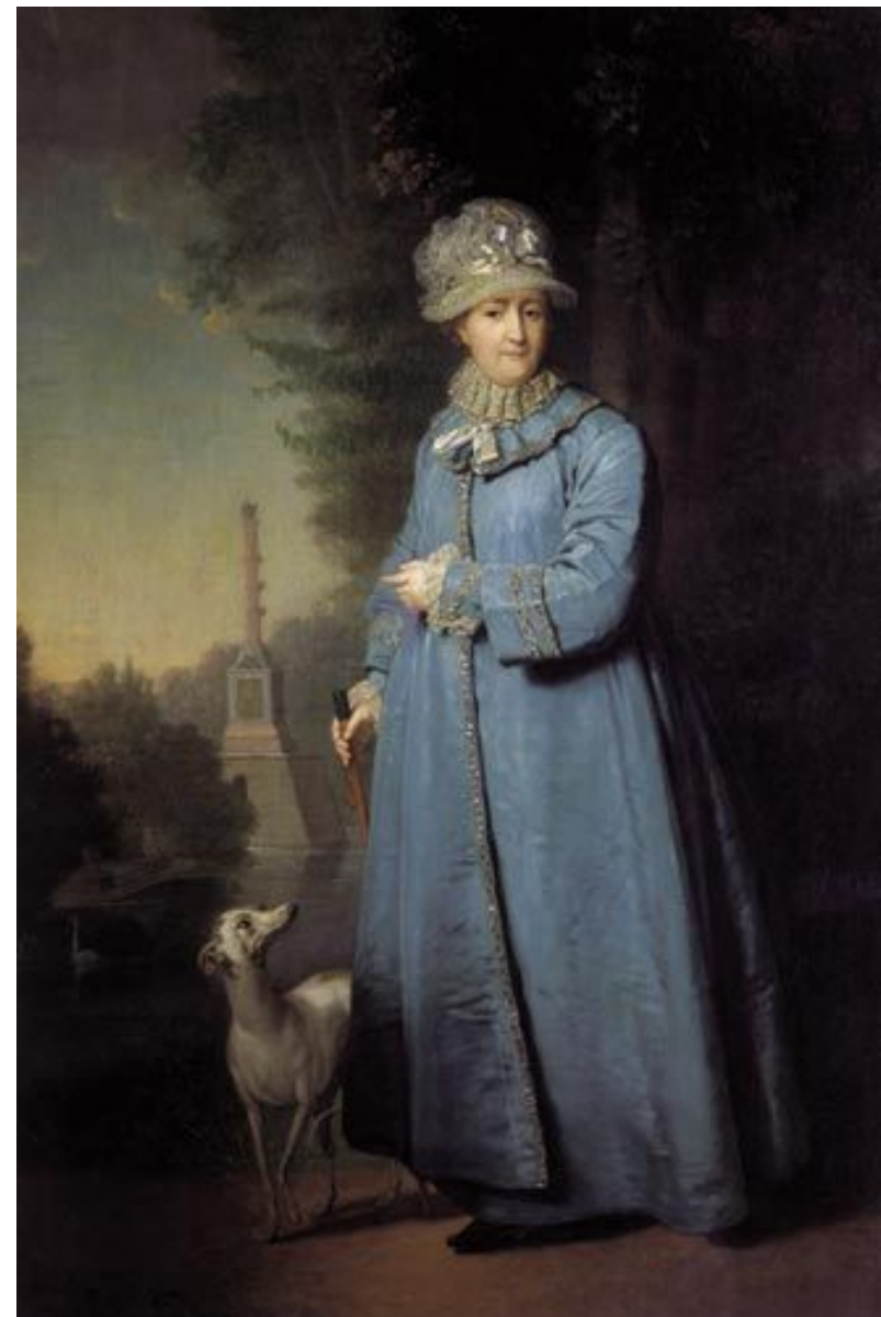
«Екатерина II на прогулке в Царскосельском парке»

Боровиковский удостоивался чести писать с натуры Екатерину II. Портрет «Екатерина II на прогулке в Царскосельском парке» отличается непринужденностью, даже интимностью. Екатерина II изображена гуляющей по парку Царского Села со своей любимой собачкой. Образ ее не лишен сентиментальности. Боровиковский отказался от изображения царицы в виде «земной богини». Она предстала в обычном домашнем облике. Не случайно этот образ позднее привлек А. С. Пушкина. Именно такой, благосклонной, величественно-снисходительной, должна была показаться императрица невинной, неопытной, доверчивой Маше Мироновой - капитанской дочке, искавшей помощи и покровительства. Именно у Боровиковского пейзаж впервые среди русских художников становится постоянным фоном портрета , обозначая целый комплекс представлений, связанных с идеями естественности, чувствительности, частной жизни и единения родственных душ.