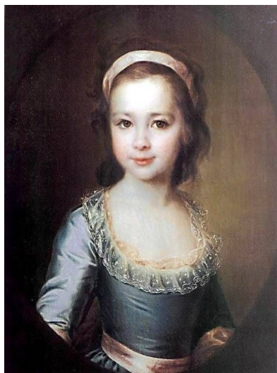
«Портрет А. Воронцовой»