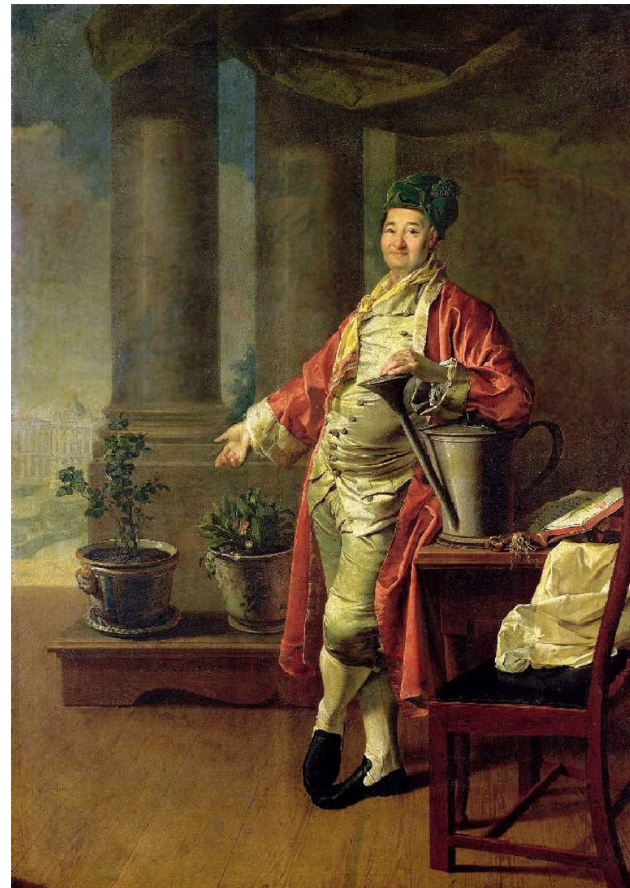
«Портрет П.А. Демидова»

Уже в ранних работах Д. Левицкий показал себя первоклассным мастером парадного портрета, способным найти выразительную позу и жест, сочетать интенсивность цвета с тональным единством и богатством оттенков. Это проявилось, например, в портрете Прокопия Демидова , владельца крупнейших горнопромышленных предприятий. Вместе с нелепыми прихотями богатого человека в нем уживались образованность и любознательность, страсть к просвещению и бескорыстная щедрость мецената. Однажды он скупил в Петербурге всю пеньку, чтобы проучить англичан, заставивших его во время пребывания в Англии заплатить непомерную цену за нужные ему товары. Им было основано Коммерческое училище в Москве и были переданы большие суммы Московскому воспитательному дому и Московскому университету. Научным увлечением Демидова было собирание гербария: его усадьба славилась цветниками и ботаническим садом, где были собраны редчайшие растения.