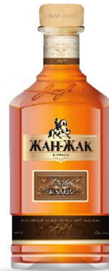
Коньяк ЖАН-ЖАК V.S.O.P.

Солнечный золотисто-медовый оттенок, нотки миндального ореха, имбиря и шафрана соединились в ансамбле с легкими фруктовыми оттенками сочного персика и ароматной груши. Запоминается согревающий пряный привкус.