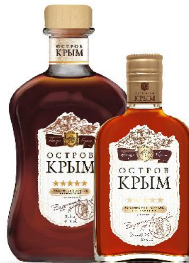
Коньяк ОСТРОВ КРЫМ 5 звезд

Вкус и аромат этого коньяка отражают богатство крымского винограда, из которого он сделан. Он богат нотами дуба, нежной ванили с едва уловимыми нотами пряностей, а насыщенный янтарно-соломенный цвет подчеркивает его индивидуальность.