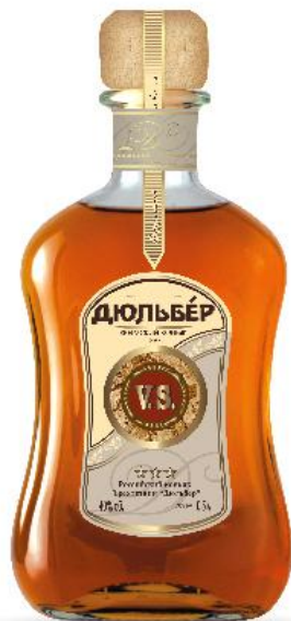
Коньяк ДЮЛЬБЕР V.S

Выдержка не менее 3 лет, Алк. 40% об. Объем: 0,5 л.