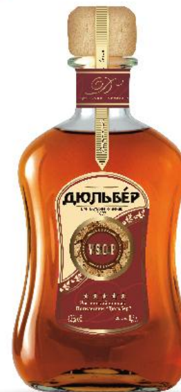
Коньяк ДЮЛЬБЕР V.S.O.P

Цвет гречишного меда, фруктовый аромат, бархатистая текстура, мягкий и нежный вкус, привкус с оттенками миндаля, ванили и карамели станут настоящим подарком для ценителей коньяка высокого качества, созданного в лучших традициях крымских коньяков.