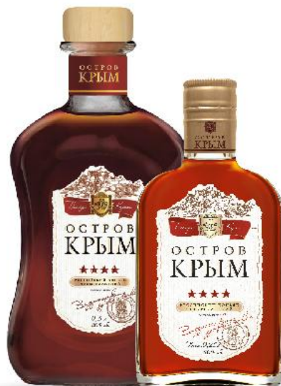
Коньяк ОСТРОВ КРЫМ 4 звезды

Коньяк обладает темно-золотистым цветом, сочетает в себе полноту букета и чрезвычайную тонкость, отличаясь фруктовыми ароматами с примесями листьев липы, перца и табака. Богатый и мягкий вкус подчеркивает бархатистая глубина, наряду с изысканной терпкостью.