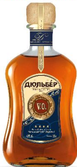
Коньяк ДЮЛЬБЕР V.O

Этот удивительный коньяк медово-золотистого цвета отличается тонким, приятным ароматом с пьянящим благоуханием душистых цветов, апельсиновой цедры и дуба. Его богатый и сбалансированный вкус имеет долгое послевкусие с нотками орехов, сушеных фруктов и какао.