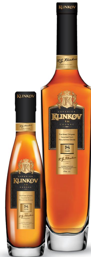
коньяк «KLINKOV S-CLASS» Выдержка не менее 5 лет. Объем: 0,5 л., 0,25 л. 40%

KLINKOV S-CLASS – Получивший жизнь в стиле S-CLASS.