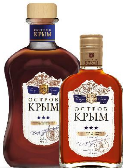
Коньяк ОСТРОВ КРЫМ 3 звезды

Выдержка не менее 3 лет, Алк. 40% об. Объем: 0,5 л.