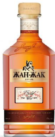
Коньяк ЖАН-ЖАК V.O.

Коньяк «Жан-Жак V.S.» имеет приятный золотисто-медный оттенок. Богатый и гармоничный букет цветочно-травяных, ванильно-сливочных, медово-пряных, ореховых и древесных ароматов, имеет бархатистый вкус с нотками тропических фруктов.