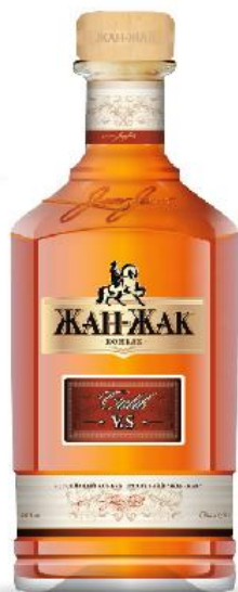
Коньяк ЖАН-ЖАК V.S.

Коньячные спирты выдерживаются в бочках из-под виски.