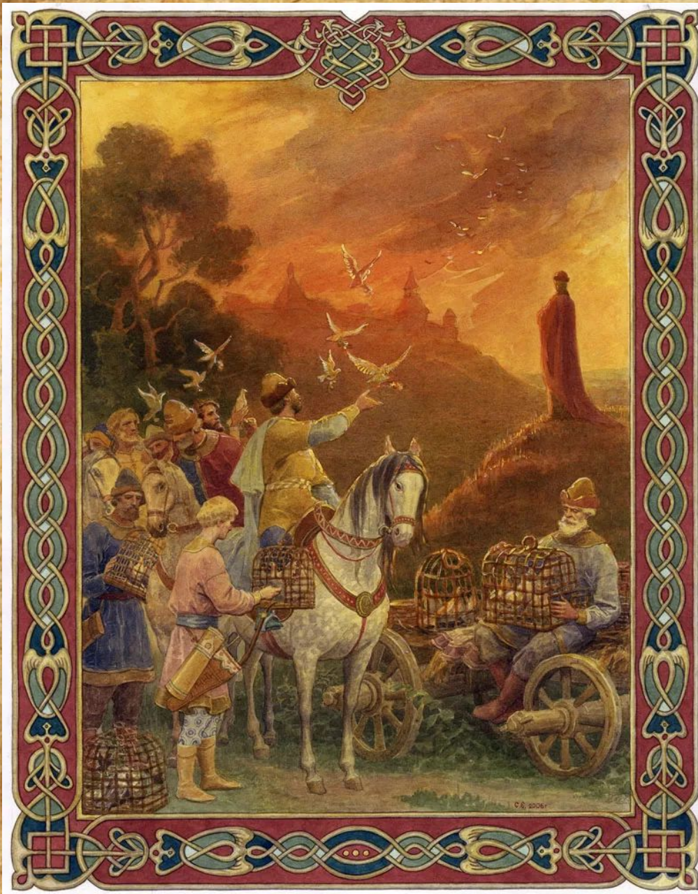
С.Н.Ефошкин "Месть древлянам" Сжигание Ольгой Искоростеня