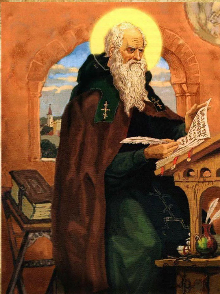
Фрагмент картины В. М. Васнецова «Нестор- летописец»