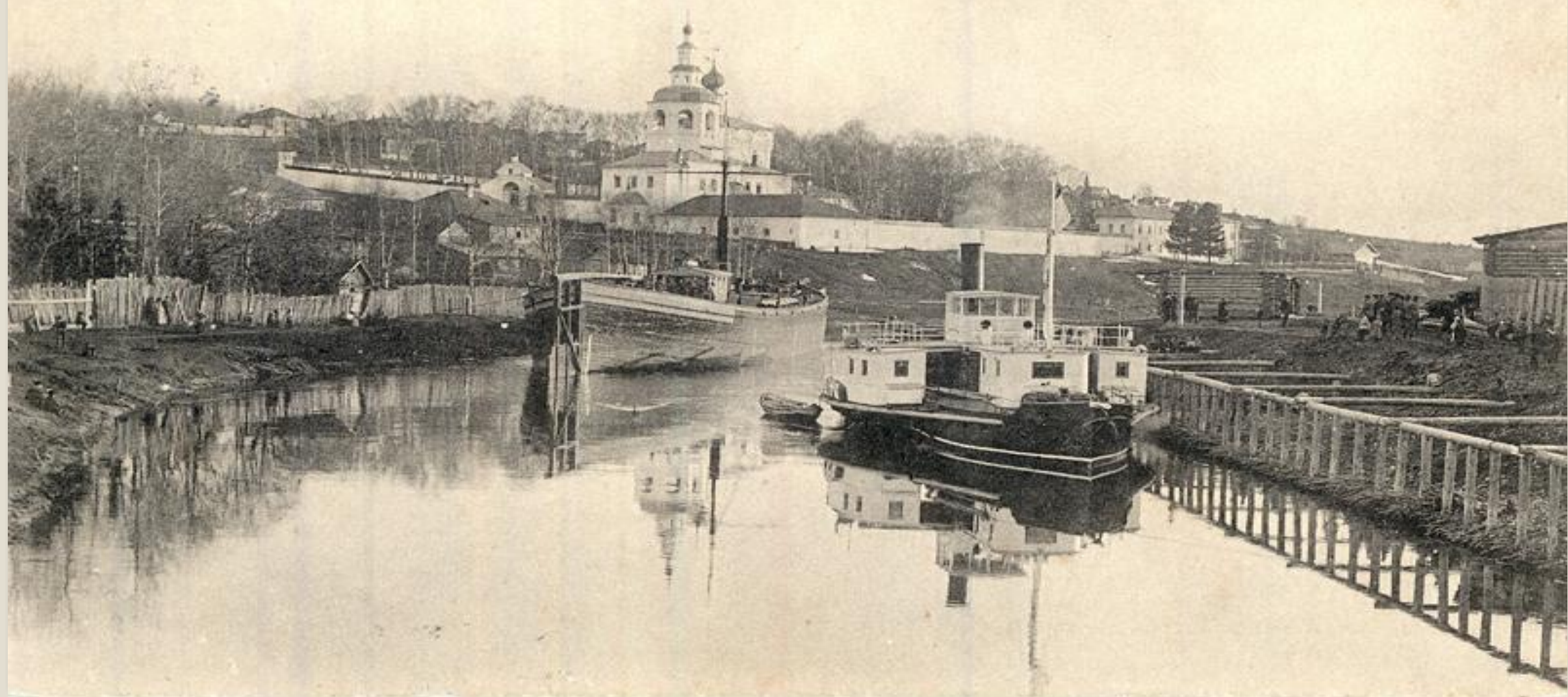
г. Соликамскъ, Пермск. губ. № 24. Мужской монастырь.