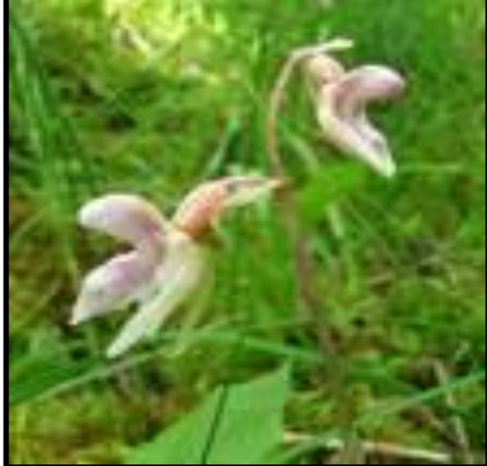
1. ВЕНЕРИН БАШМАЧОК