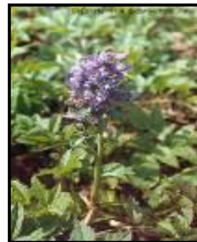
6. ХОХЛАТКА ГАЛЛЕРА