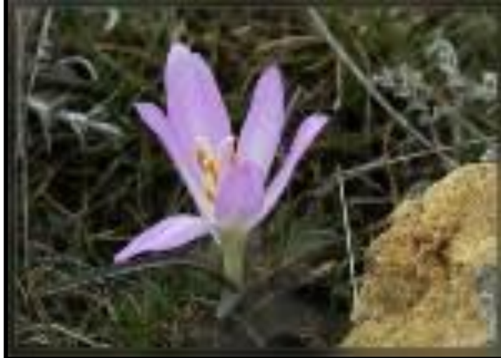
2. БРАНДУШКА 3. ВЕЧЕРНИЦА РУССКАЯ