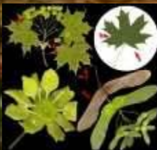
6. ЧЁРНЫЙ КЛЁН