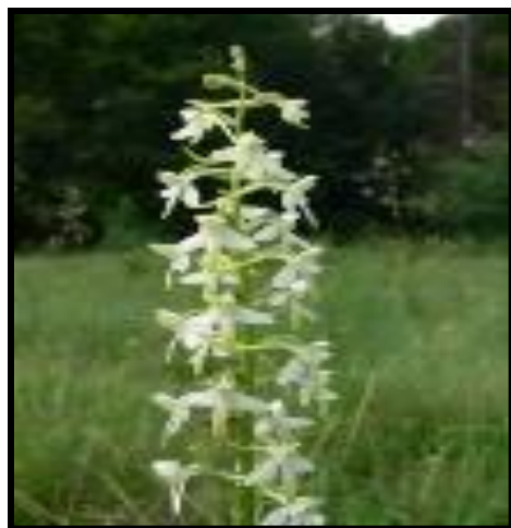
4. ЛЮБКА ДВУЛИСТНАЯ