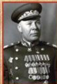
ТИМОШЕНКО СЕМЕН КОНСТАНТИНОВИЧ (1895 - 1970)

Нарком и заместитель наркома обороны СССР (1941), командующий войсками Западного (1941), Юго-Западного (1941 - 1942) и Северо-Западного (1942-1943) фронтов, член и представитель Ставки ВГК на ряде фронтов (1942-1945).