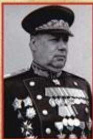
ТОЛБУХИН ФЕДОР ИВАНОВИЧ (1894 - 1948)

Начальник штаба ЗаКВФ (1941) и Крымского фронта (1941 - 1942), командующий войсками 57-й общевойсковой армии (1942 - 1943), Южного (1943), 4-го Украинского (1943 - 1944) и 3-го Украинского (1944-1945) фронтов.