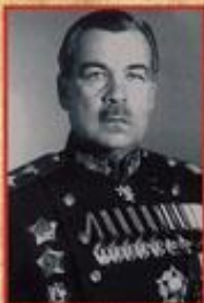
ГОВОРОВ ЛЕОНИД АЛЕКСАНДРОВИЧ (1897 - 1955)

Начальник артиллерии Западного и Резервного фронтов (1941), командующий 5-й общевойсковой армией (1941 - 1942), Волховской группой войск (1942), Ленинградским (1942-1945) и 2-м Прибалтийским (1945) фронтами.