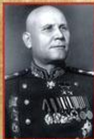
ХОНЕВ ИВАН СТЕПАНОВИЧ (1896 - 1973)

Командующий 19-й общевойсковой армией, Западным (1941), Калининским (1941 - 1942), Западным (1942 - 1943), Северо-Западным (1943), Степным (1943), 2-м Украинским (1943 - 1944) и 1-м Украинским (1944 - 1945) фронтами.