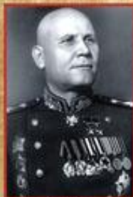
ХОНЕВ ИВАН СТЕПАНОВИЧ (1896 - 1973)

Командующий 19-й общевойсковой армией, Западным (1941), Калининским (1941 - 1942), Западным (1942 - 1943), Северо-Западным (1943), Степным (1943), 2-м Украинским (1943 - 1944) и 1-м Украинским (1944 - 1945) фронтами.