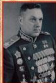
РОКОССОВСКИЙ КОНСТАНТИН КОНСТАНТИНОВИЧ (1895 - 1977)

Командир 9-го мехкорпуса (1941), командующий войсками 4-й и 16-й общевойсковых армий (1941 - 1942), Брянского (1942), Сталинградского (Донского) (1942-1943), Центрального (1943), Белорусского (1943-1944), 1-го Белорусского (1944) и 2-го Белорусского (1945) фронтов.