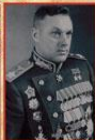
РОКОССОВСКИЙ КОНСТАНТИН КОНСТАНТИНОВИЧ (1895 - 1977)

Командир 9-го мехкорпуса (1941), командующий войсками 4-й и 16-й общевойсковых армий (1941 - 1942), Брянского (1942), Сталинградского (Донского) (1942-1943), Центрального (1943), Белорусского (1943-1944), 1-го Белорусского (1944) и 2-го Белорусского (1945) фронтов.