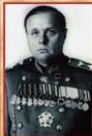
МЕРЕЦКОВ КИРИЛ АБРАМОВИЧ (1897 - 1968)

Заместитель наркома обороны СССР (1941), командующий войсками 4-й и 7-й отдельных общевойсковых армий (1941), Волховского (1941 - 1944), Карельского (1944 - 1945) и 1-го Дальневосточного (1945) фронтов.