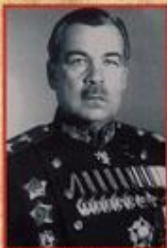
ГОВОРОВ ЛЕОНИД АЛЕКСАНДРОВИЧ (1897 - 1955)

Начальник артиллерии Западного и Резервного фронтов (1941), командующий 5-й общевойсковой армией (1941 - 1942), Волховской группой войск (1942), Ленинградским (1942-1945) и 2-м Прибалтийским (1945) фронтами.