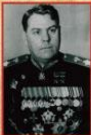
ВАСИЛЕВСКИЙ АЛЕКСАНДР МИХАЙЛОВИЧ (1895 - 1977)

Начальник Оперативного управления Генштаба РККА (1941-1942), начальник Генерального штаба РККА (1942 - 1945), командующий войсками 3-го Белорусского фронта (1945). Главнокомандующий советскими войсками на Дальнем Востоке (1945), член Ставки ВГК (1942-1945).