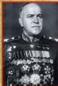
ЖУКОВ ГЕОРГИЙ КОНСТАНТИНОВИЧ (1896 - 1974)

Начальник Генерального штаба РККА (1941), командующий войсками Резервного (1941), Ленинградского (1941), Западного (1941-1942), 1-го Украинского (1944) и 1-го Белорусского (1945) фронтов. Заместитель Верховного Главнокомандующего (1942 - 1945), член Ставки ВГК (1941-1945).