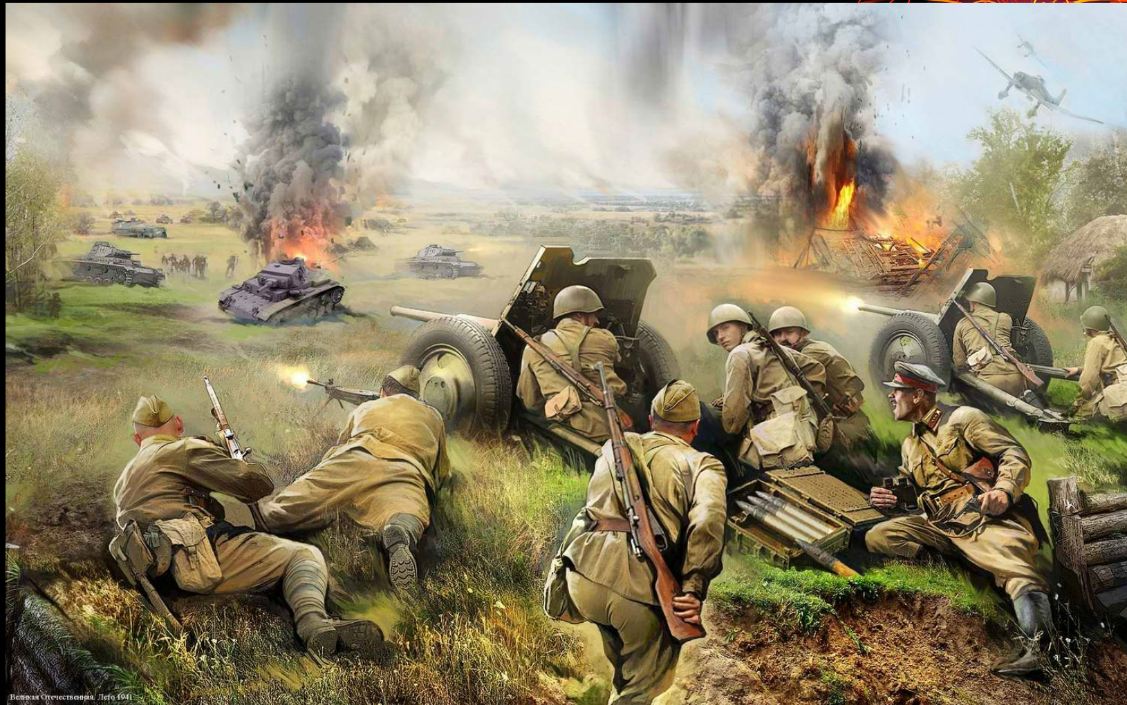
Великая Отечественная. Лето 1941