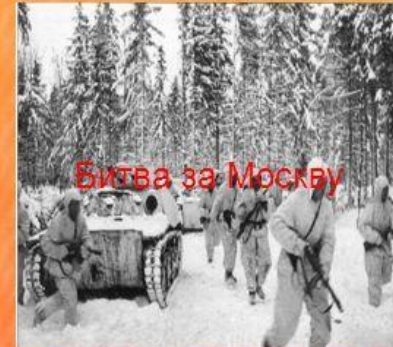
Битва за Москву