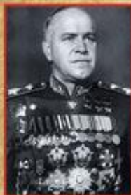
ЖУКОВ ГЕОРГИЙ КОНСТАНТИНОВИЧ (1896 - 1974)

Начальник Генерального штаба РККА (1941), командующий войсками Резервного (1941), Ленинградского (1941), Западного (1941-1942), 1-го Украинского (1944) и 1-го Белорусского (1945) фронтов. Заместитель Верховного Главнокомандующего (1942 - 1945), член Ставки ВГК (1941-1945).