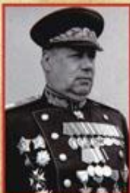
ТОЛБУХИН ФЕДОР ИВАНОВИЧ (1894 - 1948)

Начальник штаба ЗаКВФ (1941) и Крымского фронта (1941 - 1942), командующий войсками 57-й общевойсковой армии (1942 - 1943), Южного (1943), 4-го Украинского (1943 - 1944) и 3-го Украинского (1944-1945) фронтов.