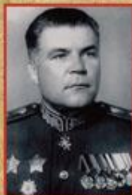
МАЛИНОВСКИЙ РОДИОН ЯКОВЛЕВИЧ (1888 - 1967)

Командующий войсками 6-й, 66-й, общевойсковых и 2-й гвардейской армий (1941 - 1943), Южным (1941-1943), Юго-Западным (1943), 3-м Украинским (1943 - 1944), 2-м Украинским (1944 - 1945) и Забайкальским (1945) фронтами.