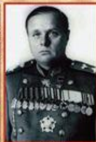
МЕРЕЦКОВ КИРИЛ АБРАМОВИЧ (1897 - 1968)

Заместитель наркома обороны СССР (1941), командующий войсками 4-й и 7-й отдельных общевойсковых армий (1941), Волховского (1941 - 1944), Карельского (1944 - 1945) и 1-го Дальневосточного (1945) фронтов.