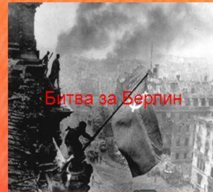
Битва за Берлин