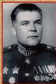
МАЛИНОВСКИЙ РОДИОН ЯКОВЛЕВИЧ (1888 - 1967)

Командующий войсками 6-й, 66-й, общевойсковых и 2-й гвардейской армий (1941 - 1943), Южным (1941-1943), Юго-Западным (1943), 3-м Украинским (1943 - 1944), 2-м Украинским (1944 - 1945) и Забайкальским (1945) фронтами.