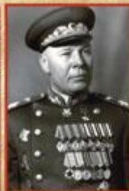
ТИМОШЕНКО СЕМЕН КОНСТАНТИНОВИЧ (1895 - 1970)

Нарком и заместитель наркома обороны СССР (1941), командующий войсками Западного (1941), Юго-Западного (1941 - 1942) и Северо-Западного (1942-1943) фронтов, член и представитель Ставки ВГК на ряде фронтов (1942-1945).