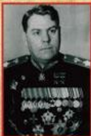
ВАСИЛЕВСКИЙ АЛЕКСАНДР МИХАЙЛОВИЧ (1895 - 1977)

Начальник Оперативного управления Генштаба РККА (1941-1942), начальник Генерального штаба РККА (1942 - 1945), командующий войсками 3-го Белорусского фронта (1945). Главнокомандующий советскими войсками на Дальнем Востоке (1945), член Ставки ВГК (1942-1945).