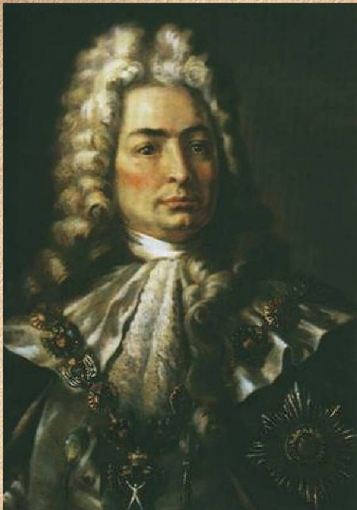
Павел Иванович Ягужинский