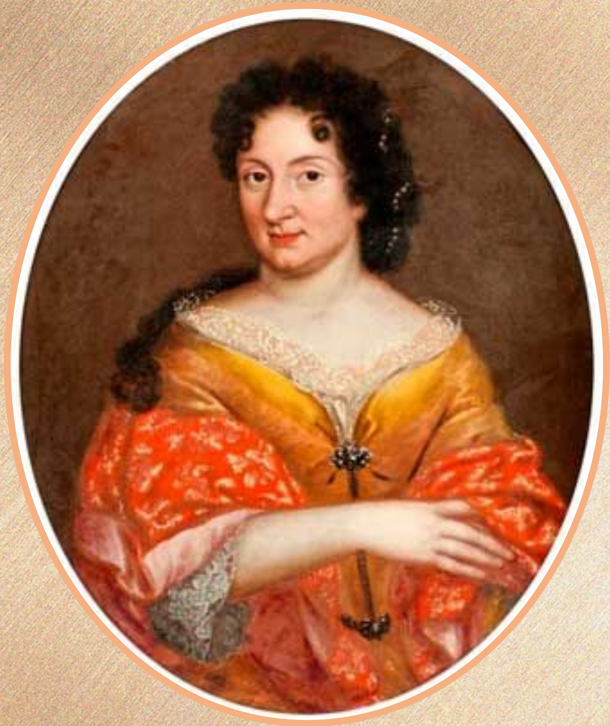
Предполагаемый портрет Анны Монс