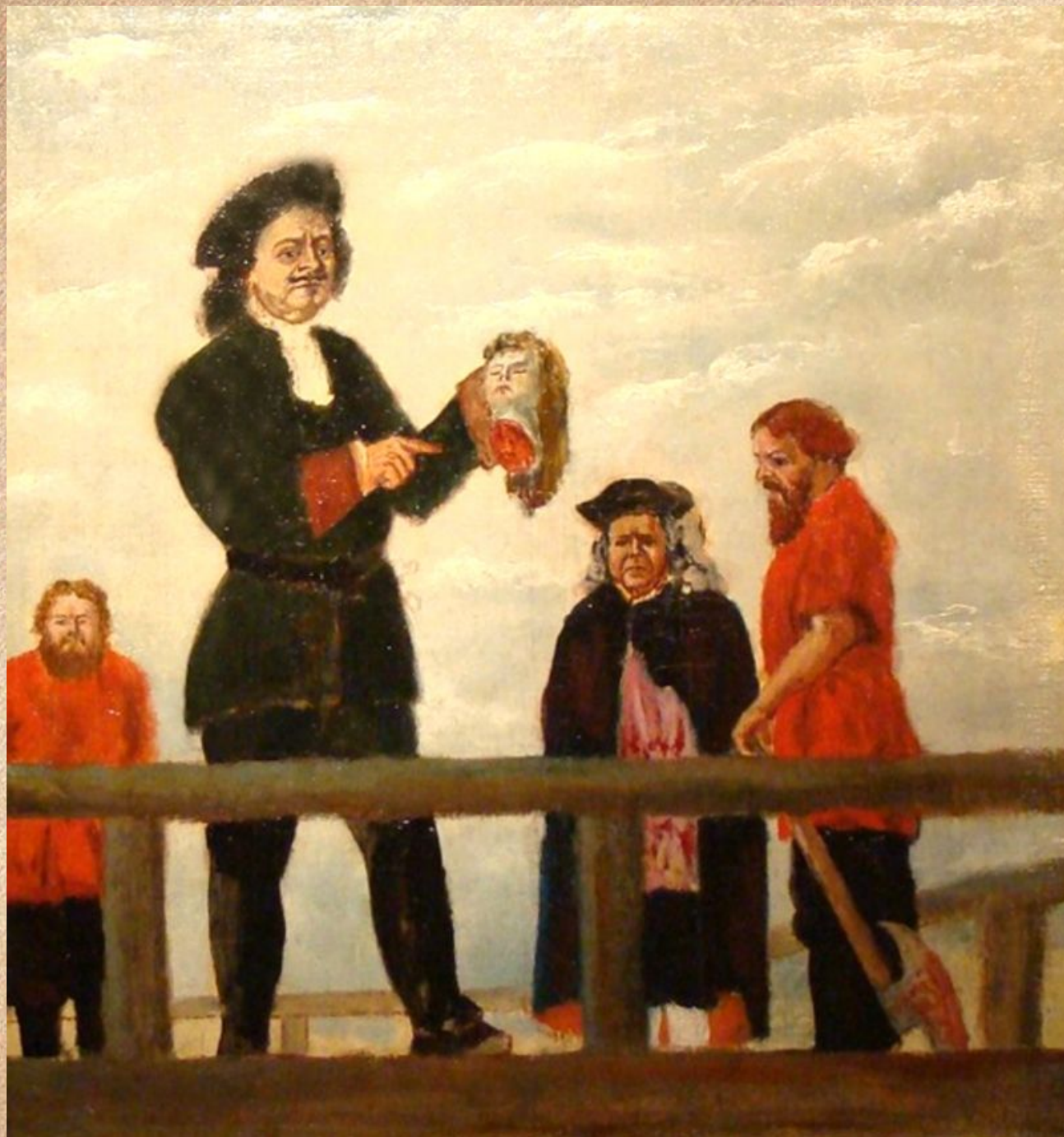
Казнь в присутствии Петра Первого. Неизв. худ. Егорьевский музей.