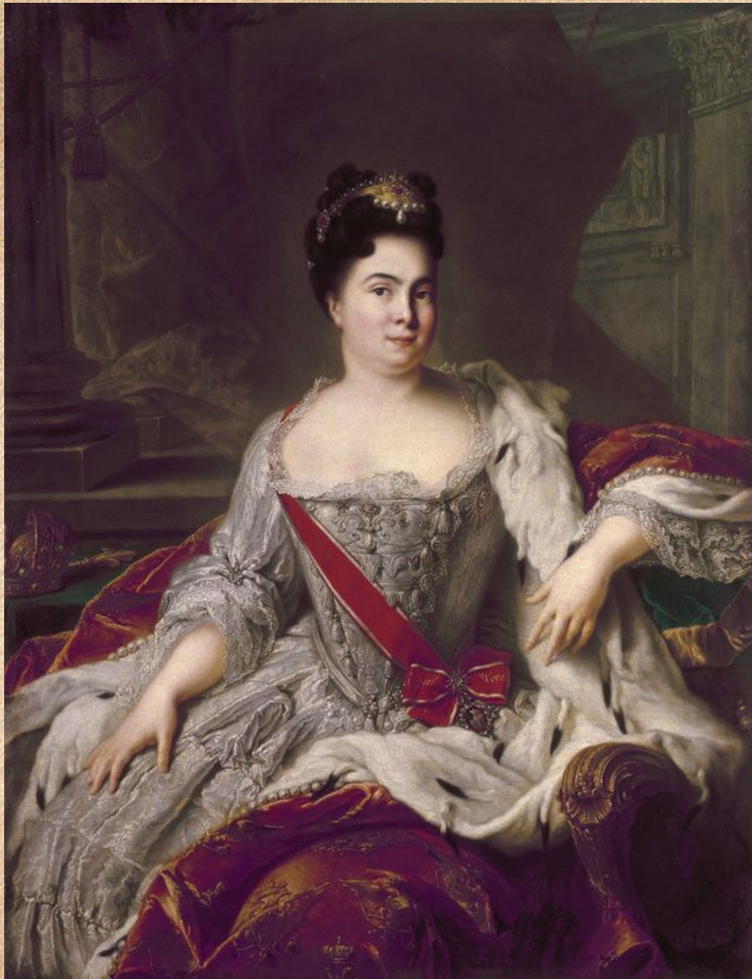
Екатерина Алексеевна Михайлова (Марта Скавронская)