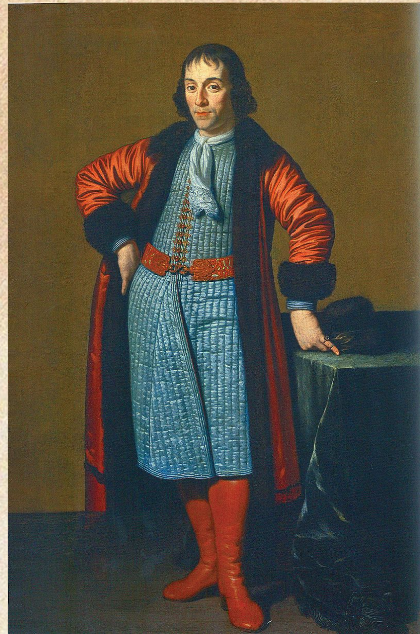
М. ван Мюссхер. Портрет А. Меншикова