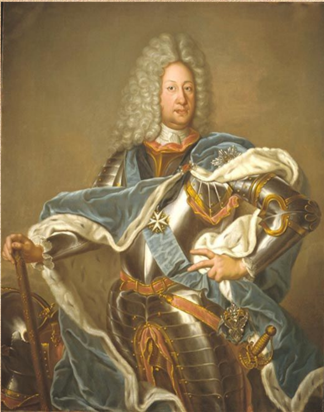
Портрет Б. Шереметьева, И. Аргунов, 1768