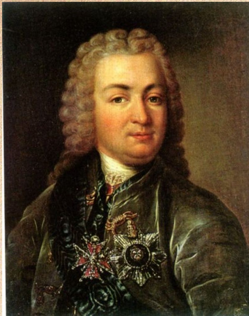
Рейнгольд Густав Лёвенвольде