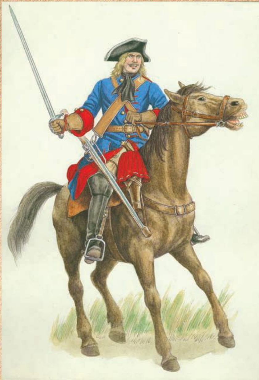
Армия Петра Великого. Драгун 1702–1712