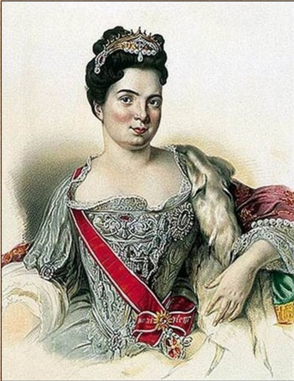
Екатерина I (М. Скавронская) в молодости