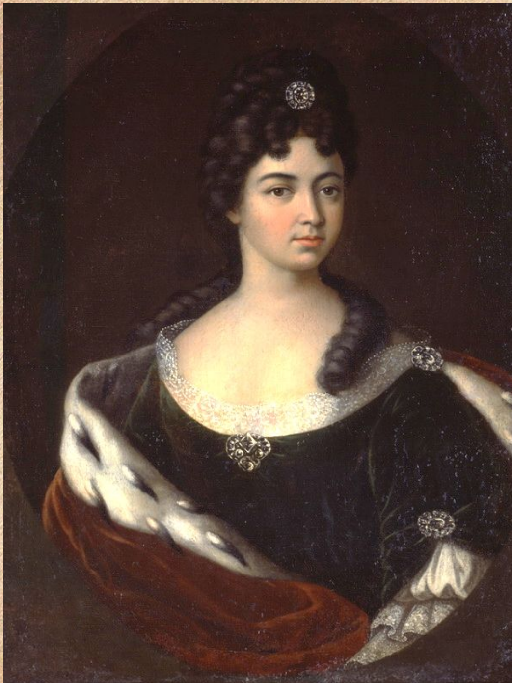
Портрет княжны Марии Кантемир. 1710-е — 1720-е., худ Никитин И. Н.