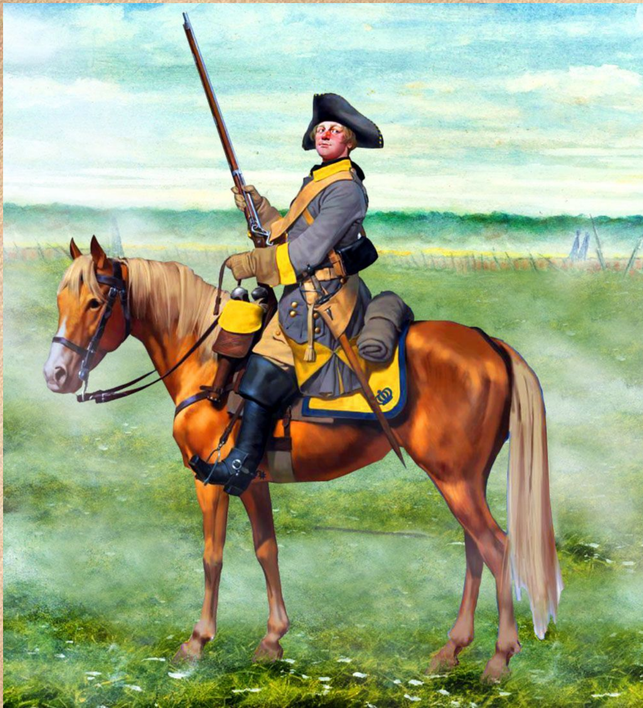
Шведский драгун 1700г