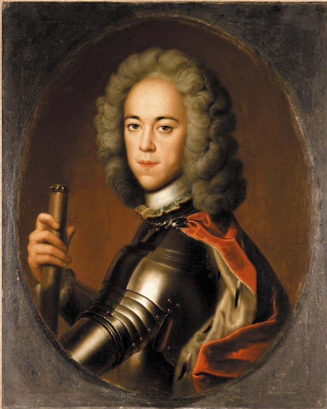
Алексей Петрович Романов — сын Петра I и Евдокии Лопухиной