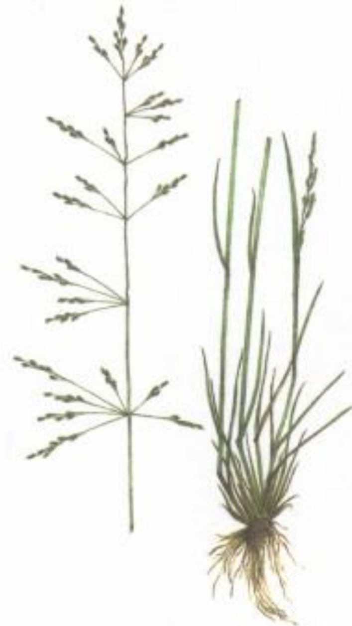
Бескильница расставленная ( Puccinellia distans )