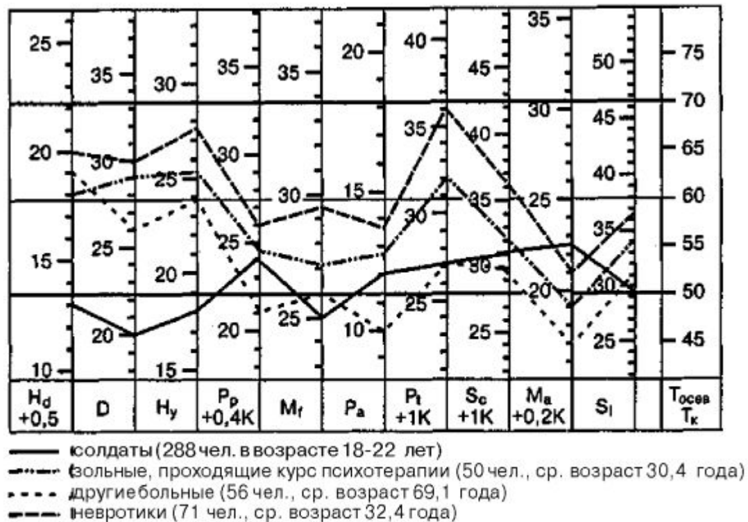
Рис. 5.1. Профиль личности