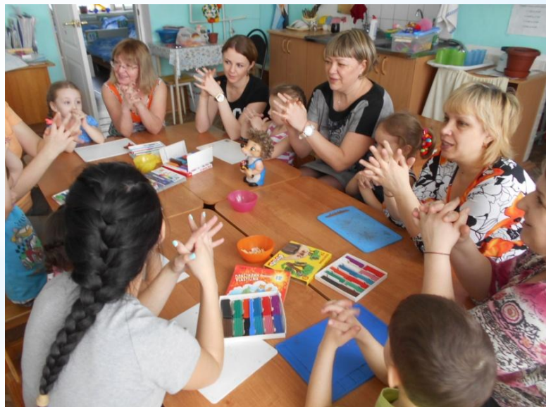
Занятия в детско-родительском клубе «Вместе с мамой»