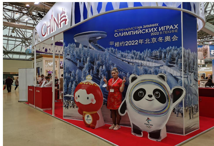
Бингдун Дун и Сюэ Ронгронг

В фотозоне рекламировались предстоящие зимние Олимпийские игры в Пекине в 2022 году, и посетители могли фотографировать Биндундун и Сюэронгронг, талисманы зимних Олимпийских игр в Пекине.