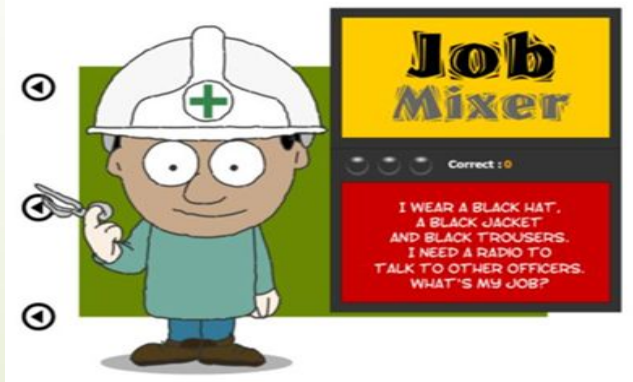
Рис. 3. Игра «Job