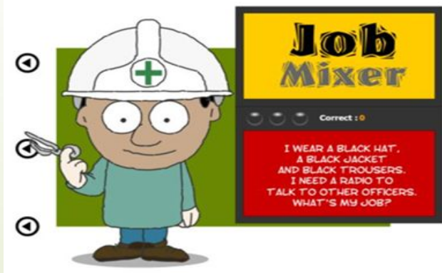
Рис. 3. Игра «Job