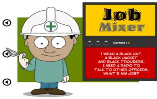
Рис. 3. Игра «Job