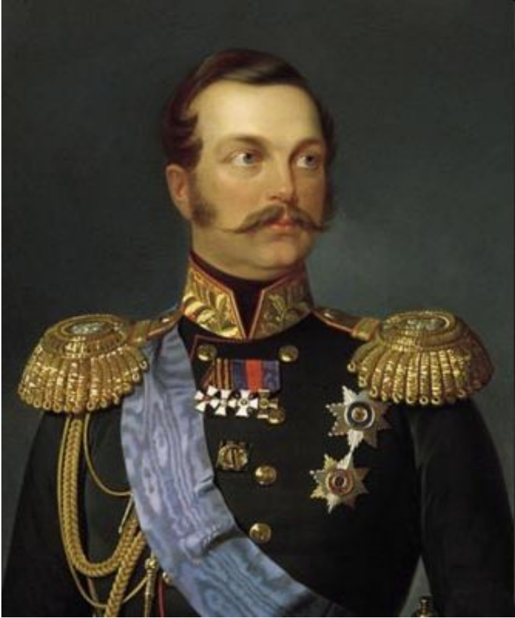
Император Александр II Освободитель