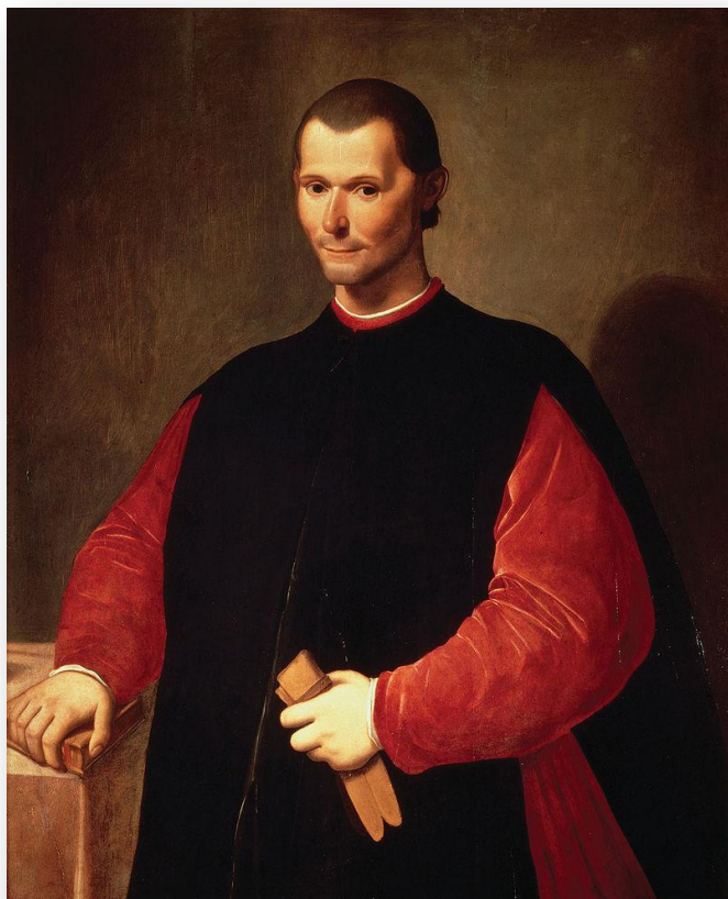
Никколо Макиавелли (1469-1527), итальянский мыслитель, философ, писатель, политический деятель