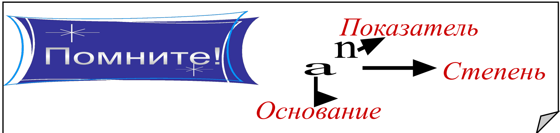
Таблица основных степеней