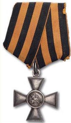
Орден Святого Георгия (Российская империя)

С виду обыкновенный человек, который в критической ситуации совершает героический подвиг, даже в ущерб своей жизни.