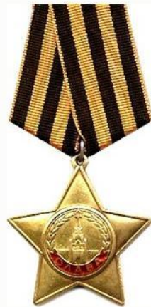
Орден Славы (СССР)