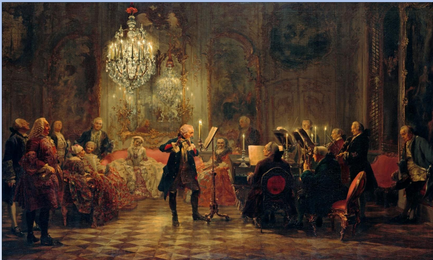
Концерт Фридриха Великого

Монархи, надеясь использовать идеи просветителей в своих интересах, покровительствовали философам, называли их «друзьями», просили у них совета, приглашали ко двору и оказывали финансовую помощь.