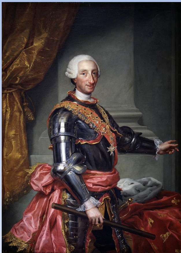
Карл III — король Испании