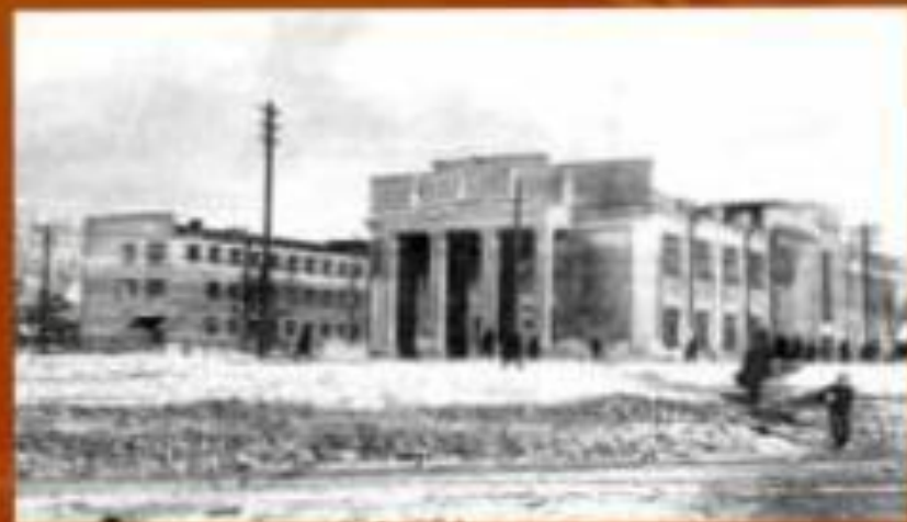
Фабрика-кухня ГВРЗ им. Рудзутака. Омск. 1942