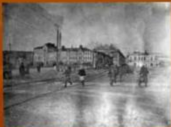
Трамвайный мост через реку Омь. Омск. 1942