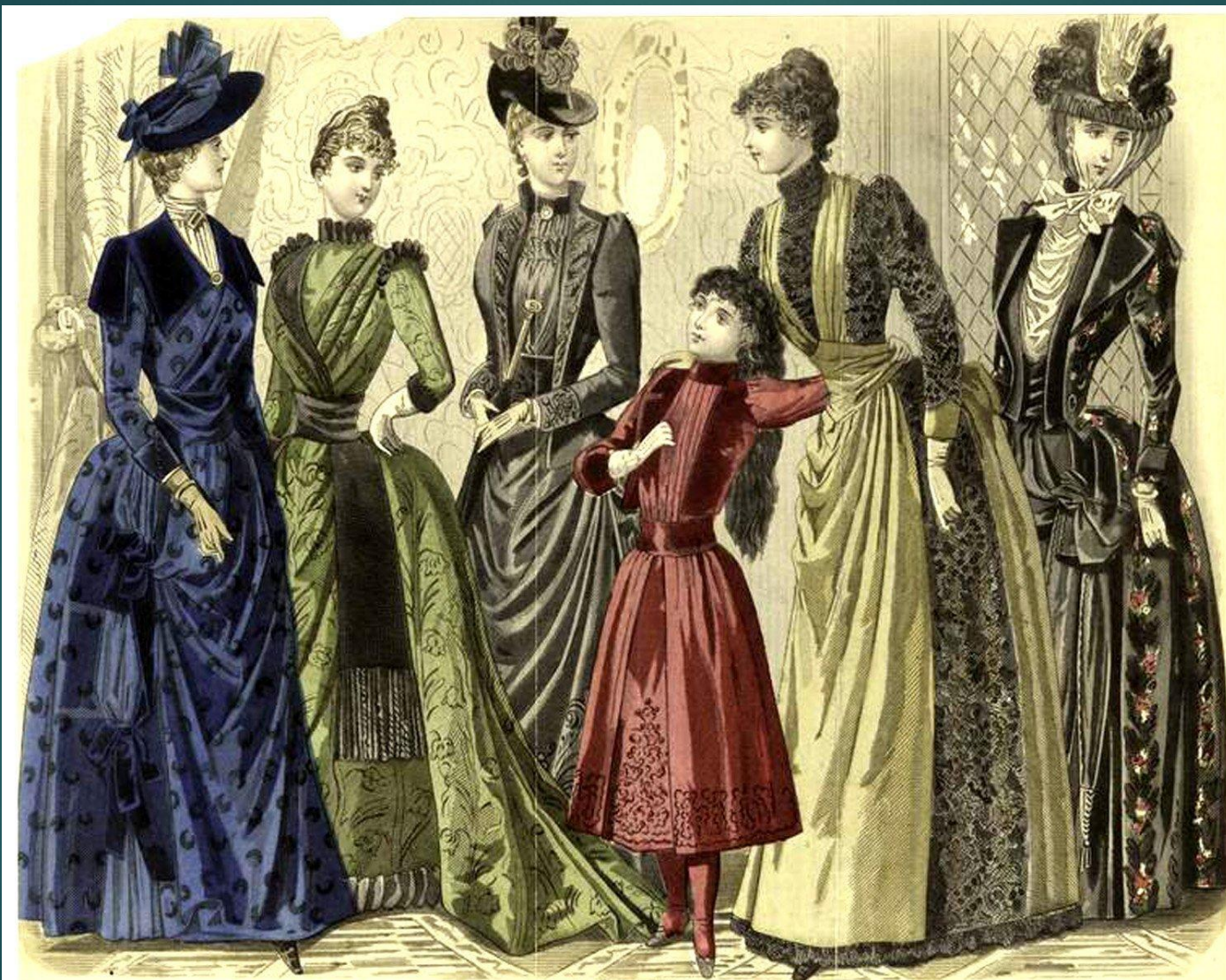
LES MODES PARISIENNES. PETERSON'S MAGAZINE. SEPTEMBER, 1889. EARLY AUTUMN RECEPTION