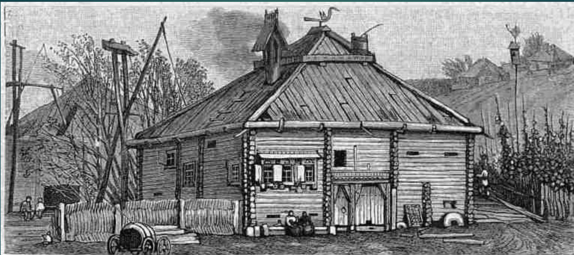
Грестьянская изба Вятской губернии.